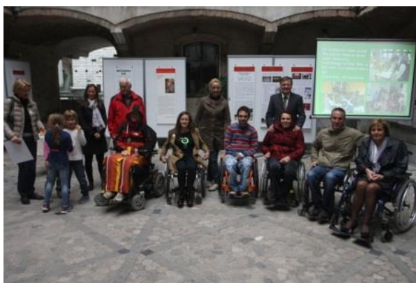
Slika 2: Razstava v Mestni hiši, v okviru dogodka Odprte hiše Slovenije 2013