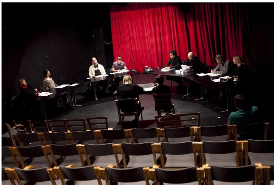
Slika 14: Vaja za Mandragolo (avtor: Niccolò Machiavelli), eno od predstav iz cikla bralnih uprizoritev pod naslovom »Velike drame sveta« v Mestnem gledališču ljubljanskem

Glede na konkretne potrebe je bilo na nekaj dramskih predstavah za osebe z okvaro sluha izvedeno simultano tolmačenje. Uvedba rednega cikla predstav s slovenskimi nadnaslovi za osebe z okvaro sluha sledi v sezoni 2015/ 2016.