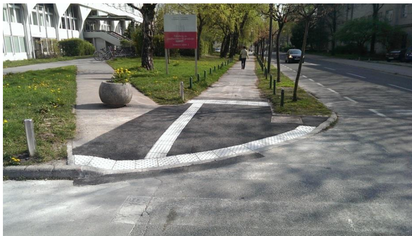
Slika 10: Talne taktilne oznake pred prehodom za pešce, ob Jamovi cesti na Viču

V letu 2014 je bilo 8 klančin izvedenih na sledečih lokacijah: Dolenjska cesta, Stritarjeva ulica 6, Ulica bratov Bezlajev, Brodarjev trg, Prulski most, Kumrovska ulica, Ulica Angele Ljubičeve, 97 znižanj robnikov pa na sledečih lokacijah: Soška ulica - Cesta v Mestni log, Šmartinska cesta - Vilharjeva cesta, Langusova ulica (pri Ministrstvu za infrastrukturo), Jamova cesta - Langusova ulica, Robičeva ulica - Zupanova ulica, Verovškova ulica, Šmartinska cesta - Moskovska ulica, Ob Ljubljani - Na Peči, Karlovska cesta - Levstikov trg, Grablovičeva ulica - Ob Ljubljani, Pod brestu, Zapuška cesta - Regentova cesta, Bravničarjeva ulica, Malnarjeva ulica, Korenčanova ulica, Regentova cesta - Briljeva ulica, Zadobrovska cesta - Novo Polje, cesta XV, Zadobrovska cesta (pri Osnovni šoli Zadobrova), Celovška cesta - Aljaževa ulica, Drenikova ulica - Aljaževa ulica, Ob daljnovodu, Gubčeva ulica.