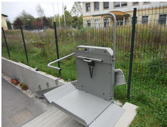
Slika 12: Dvizna ploščad na Euro ključ za dostop do stanovanjske stavbe Javnega stanovanjskega sklada MOL, na lokaciji Pipanova pot 28 (foto: arhiv JSS MOL).

Na lokaciji Pipanova pot 28 je od 2014 za dostop do stanovanjskega objekta Javnega stanovanjskega sklada MOL (v nadaljnjem besedilu: JSS MOL) z 22 bivalnimi enotami na voljo dvizna ploščad na Euro ključ za gibalno ovirane, s čemer je zagotovljena univerzalna dostopnost vseh funkcionalnih površin omenjenega objekta.