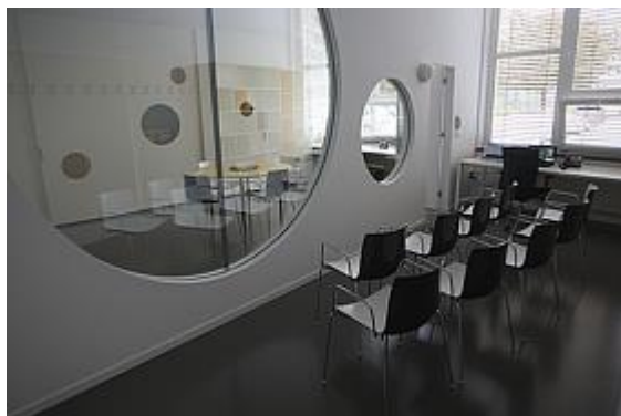
Slika 16: Novi, sodobno opremljeni prostori Izobraževalnega centra za usposabljanje strokovnih delavcev, zaposlenih v vrtcih in osnovnih šolah MOL, za poučevanje otrok s posebnimi potrebami, na Zemljemski ulici 7, v Osnovni šoli Poljane

Izobraževalnega centra. V 2013 je Center Janeza Levca Ljubljana objavil interni razpis za izobraževanje specialnih in socialnih pedagogov iz vrtcev in osnovnih šol MOL, na katerem je bilo izbranih 21 strokovnih delavcev (17 zaposlenih v osnovnih šolah MOL, ostali zaposleni v vrtcih MOL). Tem zaposlenim je MOL zagotovil nadomestila plač za čas odsotnosti z dela zaradi udeležbe na izobraževanju.