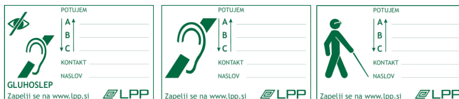
Slika 7: Nekaj primerov LPP identifikacijskih kartic za osebe z oviranostmi.

Za lažje prepoznavanje posebnih potreb oseb z oviranostmi ob uporabi javnega prevoza so bile v času Evropskega tedna mobilnosti 2014 (od 16. do 22. 9. 2014) uvedene identifikacijske kartice, s katerimi se osebe z oviranostmi lahko identificirajo v primeru oziroma če pri uporabi javnega prevoza potrebujejo pomoč (na primer voznika ali sopotnikov). Kartice s simboli posameznih vrst oviranosti so objavljene na spletni strani LPP d.o.o. in jih je mogoče preprosto natisniti, osebe z oviranostmi pa jih uporabljajo na lastno željo in po lastni presoji.