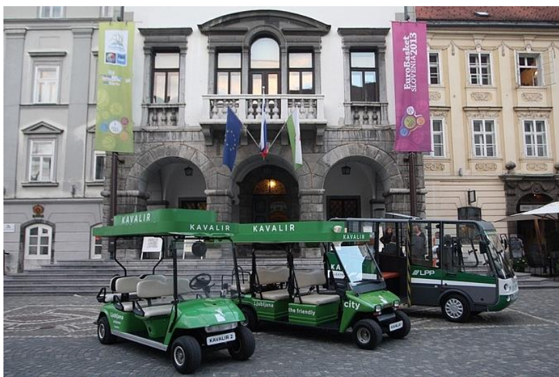
Slika 8: Trije ljubljanski Kavalirji za brezplačne prevoze po ekološki coni v središču mesta

Dvema voziloma Kavalir na električni pogon za brezplačne prevoze po območju ekološke cone v mestnem središču se je v letu 2013 pridružil Kavalir 3 – zaprto in ogrevano vozilo, opremljeno z rampo in prostorom za invalidski voziček. Prevozi s Kavalirjem 3 so možni skozi celo leto, tudi ob neugodnih vremenskih razmerah, in sicer na liniji med postajališčema mestnega linijskega prevoza potnikov Drama in Krekov trg, vsakih 10 do 15 minut, pozimi pa na klic.