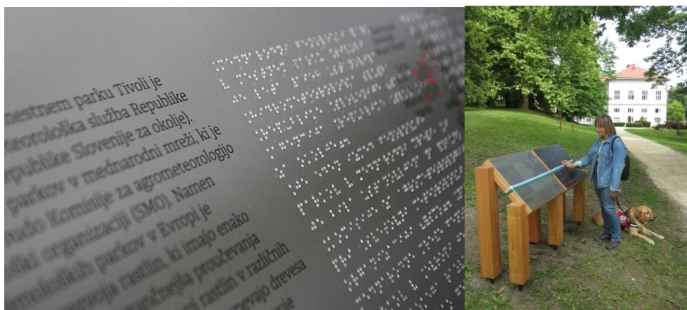
Slika 11: Fenološka opazovalnica je opremljena z informacijskimi tablamami, na katerih so podatki izpisani tudi z Braillovo pisavo

V letu 2014 je bilo v parku Tivoli, v neposredni bližini glavnega parkirišča, postavljeno novo igralo za integracijo otrok s posebnimi potrebami, ne daleč stran (nad tenišskimi igrišči) pa fenološka opazovalnica na novo opremljena z informacijskimi tablamami in označbami za drevesa, tudi z Braillovo pisavo.