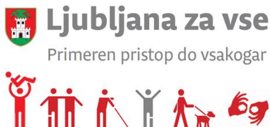
Slika 3: Motivi iz zloženke »Ljubljana za vse, Primeren pristop do vsakogar«, ki je bila v 2014 ponatisnjena v 5.000 izvodih

z oviranostmi in kako jih odpravljati ter najprimernejši načini pristopa do oseb z oviranostmi. Brošura je dostopna tudi v elektronski obliki, na spletni strani www.ljubljana.si .