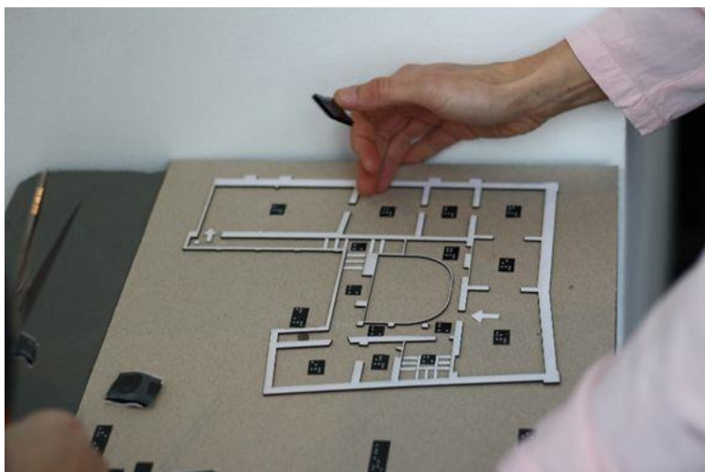
Slika 15: Tipni tloris 1. nadstropja Mestnega muzeja Ljubljana