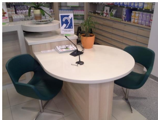
Slika 6: Indukcijska zanka v Lekarni pri Polikliniki, Njegoševa cesta 6K

Vsi novi prostori JZ Lekarna Ljubljana, v katerih ta izvaja lekarniško dejavnost, so dostopni brez arhitekturnih ovir. V obdobju, na katerega se nanaša poročilo, je bila izvedena prenova Lekarne Polje (september 2013) in v treh enotah JZ Lekarna Ljubljana so bile nameščene indukcijske zanke za osebe z okvaro sluha (november 2013). JZ Lekarna Ljubljana ima skupno 46 enot, od teh 24 na območju MOL, indukcijske zanke zagotavlja v štirih enotah v Ljubljani, in sicer: v Lekarni pri Polikliniki (Njegoševa cesta 6k), v Lekarni Polje (Cesta 30. avgusta 2), v Centralni lekarni (Prešernov trg 5) in v Lekarni Trnovo, (Devinska ulica 1a).