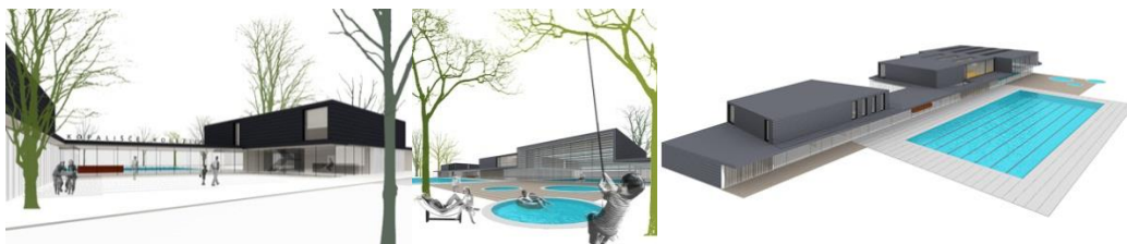
Slika 5: Računalniški izrisi bodoče podobe kopališča Kolezija

V objektih MOL, v katerih potekata predšolska vzgoja (vrtci), osnovnošolsko izobraževanje (osnovne šole) in ostale aktivnosti, namenjene mladim (četrtni mladinski centri), so bile izvedene oziroma so na voljo sledeče ureditve in prilagoditve za povečanje njihove dostopnosti otrokom ter učenkam in učencem s posebnimi potrebami: