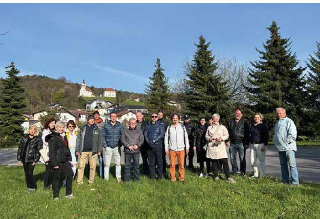
Razširjen svet ČS Rudnik s strokovnima sodelavkama

Kot je tudi ta, povezana s tokratno naslovnico. V kotu Botaničnega vrta namreč stoji deblo, ki nosi spomine na čase daleč pred našimi. Gre za ostanek lipe, ki jo je Napoleonov maršal Marmont, prvi in glavni guverner Ilirskih provinc, zasadil več kot 200 let nazaj. Drevo so morali zaradi okužbe posekati, na njenem mestu zdaj raste mladi odganjek, ostanek debela matičnega drevesa pa obiskovalcem omogoča, da se dotaknejo zgodovine.