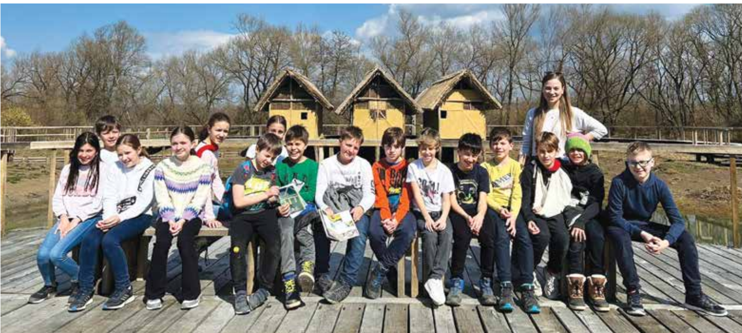
Obisk kolišč na Igu

Ob koncu bi rada poudarila, da okolje, tako družbeno kot naravno, ponuja še marsikaj več kot življenje in uživanje naravnih lepot Ljubljanskega barja in z njim povezane mostiščarske kulture. To je okolje, v katerem naši učenci PŠ Rudnik živijo in doživljajo čare raziskanih in neraziskanih poti Golovca, rastlinske in živalske pestrosti, raziskovanja kamnin in prsti, ki se pojavlja na našem področju. Mostiščarska kultura bo tako samo eden od projektov in prikaz izredno pomembnega medpredmetnega, medtridnega sodelovanja učenk, učencev, učiteljev in nenazadnje krajanov kot virov tradicije ter bogatega socialnega sobivanja v tem delu Ljubljane.