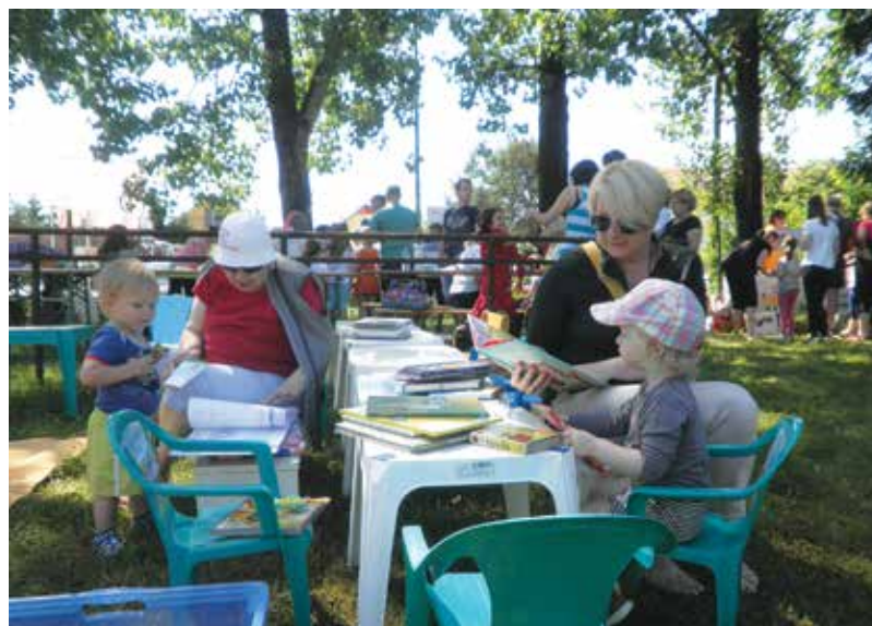
Otroške barjanske žabarije

Vsako leto je na Barju organiziran Pohod po Barju. Običajno je to tretjo soboto v maju. Udeleži se ga tudi do 170 pohodnikov. Na okoli 10-13 km dolgi poti pohodnike o znamenitostih in značilnostih Barja seznanijo odlični poznavalci Barja, tako strokovnjaki kot tudi domačini, barjani. Pohod je sproščujoč, poučen in kot tak varno druženje vseh ljudi, ki jih narava navdihuje. Nikomur ne bo žal udeležbe.