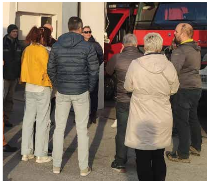
Člani razširjenega sveta ČS Rudnik na terenski seji, april 2023