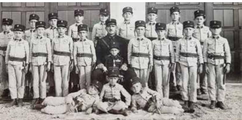
Prva naraščajniška desetina