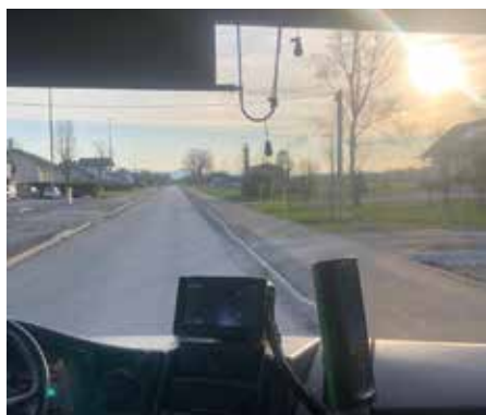
Črnovaška dobiva končno podobo