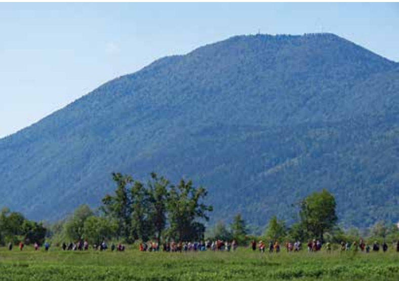
Pohodniki. V ozadju Krim

torov. S preišljenim in načrtnim delom smo dosegli, da so vsa društva dobila prostore tako rekoč čez cesto, v stari barjanski šoli.