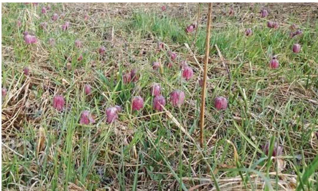
Žalostne glavice iz posušene trave v čakanju na toplo sonce.

Z veseljem pogledam lep pokošen travnik in vem, da bom v nekaj dneh zagledala moje lepe barjanske tulipane. Zahvala tem pridnim kmetom, ki s košnjo ohranjajo te travnike, da ne pozabimo, kako lepa je bila naša narava, posejana s pisano paleto vijoličastih cvetov.