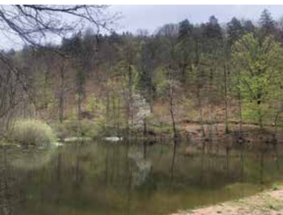
Med nalogami, pri katerih smo sodelovali, je tudi ureditev Bajerja.