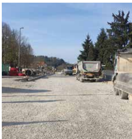
Obnova lžanske ceste

Poleg sveta v ČS Rudnik delujejo tudi različna delovna telesa, ki jih, glede na potrebe delovanja sveta ČS in same četrtne skupnosti, določi svet ČS na začetku mandata.