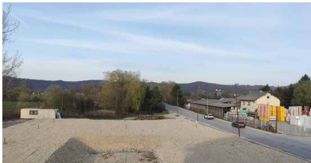
Pogled iz barjanske šole. Ob obnovi šole bo na tem delu ostal prostor za sejmišče oz. manjšo pokrito tržnico s spremljajočimi objekti in igrišči.