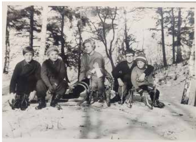
Na vrhu Zelenega hriba, leta 1968

Izredno velik obisk sta imeli obe naravni drsališči, eno na velikem Suhem bajerju, drugo pa malo višje, na Zgornjem