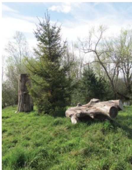
Protipoplavni gnezdilni habitat za kožekrilce

Druga skupina čmrljev pa je zajedavska, kjer se matica ugnezdi v družino pravih čmrljev, prevzame vlogo prave matice in začne odlagati jajčeca, iz katerih se razvijejo samčki in mlade matice. Zajedavska vrsta čmrljev nima delavk, zato je razvoj zaroda odvisen od delavk »gostiteljic« pravih čmrljev.