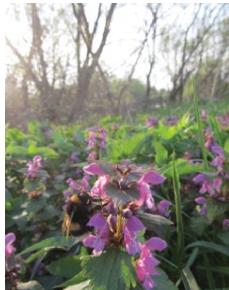
Matica čmrlja ( Bombus terrestris ) na mrtvi koprivi ( Lamium purpureum ).

Nekatere vrste pa si najdejo za svoj gnezdilni habitat v starih drevesnih duplih, skladovnicah drv, podstrešju, ali razpokah zidu. Ta vrsta čmrljev, med drugim B. pratorum , ima sicer boljše pogoje za obstoj zaroda oz. gnezdišč, vendar je njihovo preživetje, tako kot za večino drugih žuželk ali prostoživečih barjanskih živali, poleg klimatskih razmer, pogojeno predvsem od naravi prijaznega odnosa do okolja.