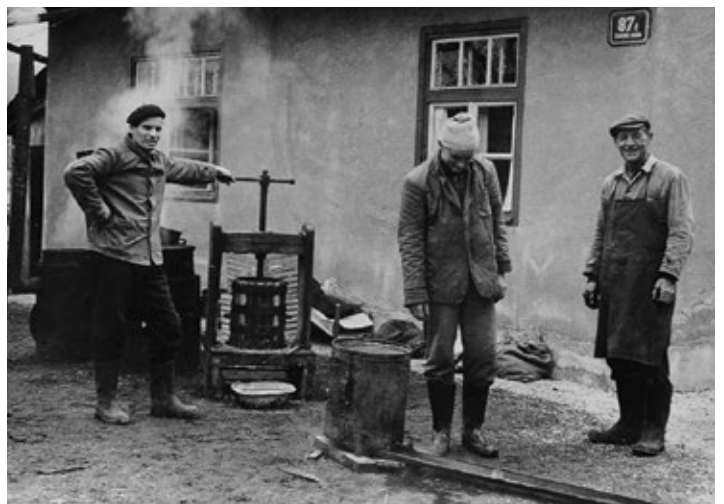
Kuhanje voska (1957)