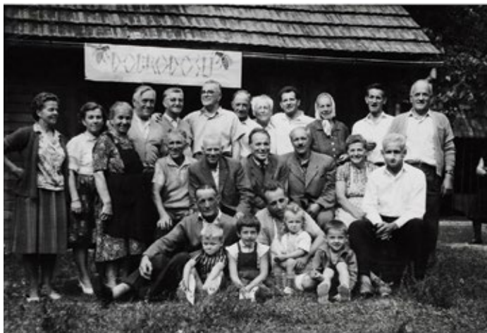
30. obletnica 1963

V zadnjih desetih letih se lahko društvo pohvali s številnimi uspehi. Članstvo se je po letu 2015 povzpelo na blizu 80. Glavnina so še vedno čebelarji s področja današnje ČS Rudnik, s katero društvo aktivno sodeluje.