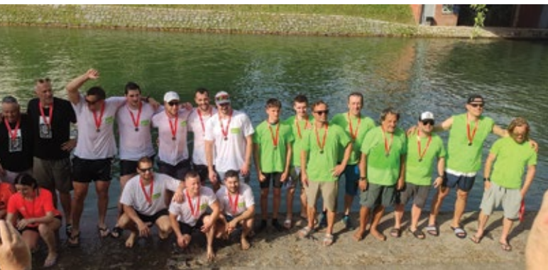
Tekmovanje v velikih kanujih

Letošnje poletje se je začelo pestro in družabno. Na 7. tekmovanju v velikih kanujih za četrtne skupnosti je naša prva ekipa, ekipa Krimovci, brez treninga osvojila visoko 2. mesto! Prehiteli so jih le močni veslači ekipe Šmarne gore. ČS Rudnik pa je imela še eno ekipo, ki je ravno tako veslala na vso moč, a večinoma ženska sestava ni bila kos močnim veslačem.