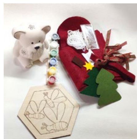
Darila dobrih mož

Želimo si, da bi bilo čim manj otrok in družin, ki si tega ne bi mogle privoščiti. A žal ni tako, zato se na tem mestu zahvaljujemo vsem, ki ste pomagali, da so se ob pogledu na sladke praznične dobrote, zasvetile tudi otroške oči v teh družinah.