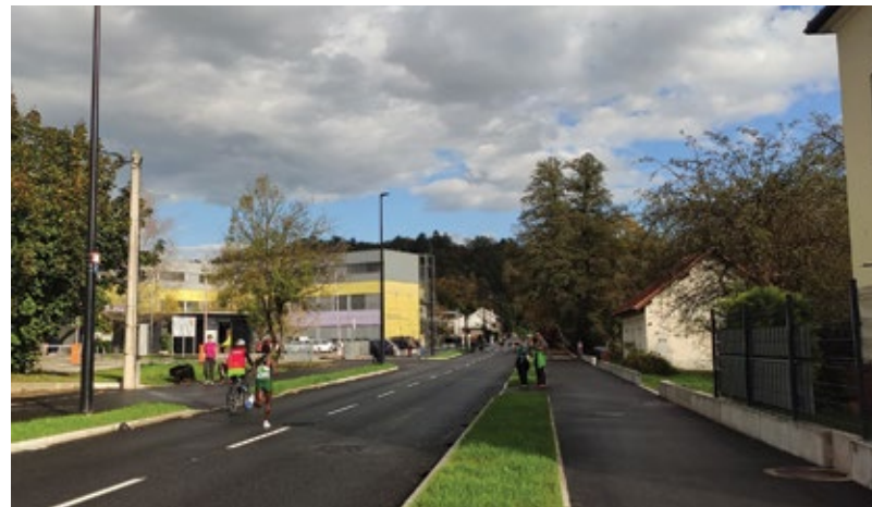
Ljubljanski maraton na prenovljeni lžanki

A morda letošnje poletje le ni bilo tako, kot se je nazkazovalo, saj visoke temperature na eni strani in obilno deževje nista prijetna. Predvsem ne deževje, ki je nemalo preglavic povzročilo tudi v naši četrtni skupnosti. Na srečo ni bilo velikih poplav, a vsako neurje je prineslo nove težave na že prej problematičnih krajih, za marsikoga netipičnih za poplavljanje. A kot smo letos ob velikih poplavah spoznali, neustrezna gradnja, včasih le na videz »nepomembno« zasutje grabna ali dvig robnika, da imamo lepše dvorišče, lahko sosedu naredi neizmerno škodo. Tako smo bili letos ob neurjih priča poplavljenim kletnim prostorom na Gornjem Rudniku in na stari Galjevici.