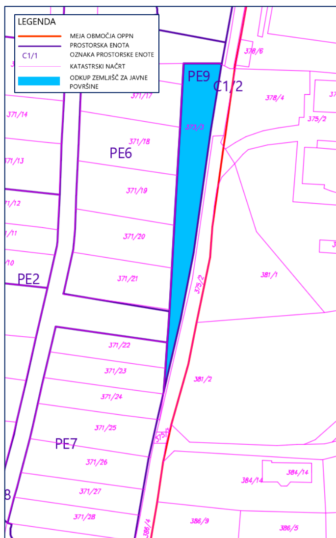
Slika: Zemljišča, ki jih mora MOL odkupiti za ureditev javnih površin v prostorski enoti PE9