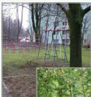
Otroško igrišče ob Majaronovi ulici nekoč in danes

Prenovljenega otroškega igrišča ob Majaronovi ulici so zagotovo vesele okoliške mlade družine. Zaradi gostih drevesnih krošenj je kotiček še posebej prijeten v poletni vročini.