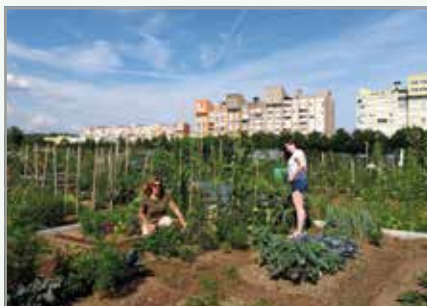
Zelenjavni učni vrt na Ježici

V letu 2020 bo na vrtačarskem območju ob Vojkovi na novo vzpostavljen Plantellin vzorčni bio vrt, kjer bodo agronomi iz Kluba Gaia redno izvajali predavanja in delavnice za vrtačarje in druge zainteresirane posameznike. Vsebina in delo na delavnicah bosta potekala vzporedno s časovnico dela na vrtačih. Tako bodo imeli vrtačarji strokovno vodstvo vso vrtačarsko sezono, predavatelji pa jim bodo omo-