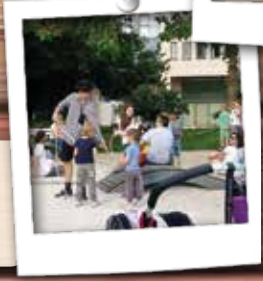
Cirkuško predstavo in delavnico