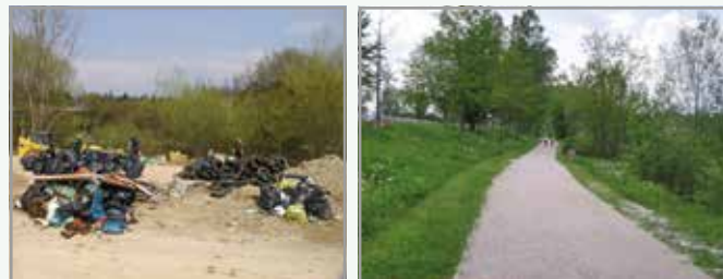
Tomačevo nekoč in danes

Območje ob Savi je v preteklih letih spremenilo svojo podobo in vabi k obisku z novimi zelenimi površinami in ureditvami.