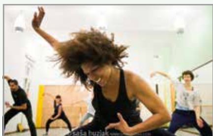
Afriški plesi

Studiu XXV zaradi neurejenih politik na tem koncu mesta ves čas grozi zaprtje. S tem bi skupnost izgubila pomemben prostor, kjer se ljubitelji in ljubitelji plesa in glasbe sproščajo in kjer se kalijo novi upi plesne scene. Kako pomemben del skupnosti je Studio XXV, je pokazal lanski mali festival, na katerem so zbirali prostovoljne