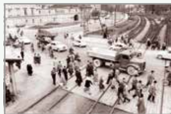
Križišče današnje Dunajske/Slovenske ceste z železniško progo leta 1960

Spremembe, ki so sestavni del razvoja, življenja in našega okolja, sprejemamo različno – odvisno od tega, v kakšni vlogi smo in kako spremembe vplivajo na naše življenje. Nekatere spremembe in nove ureditve nas motijo, drugih se razveselimo. Tako je tudi v naši četrti skupnosti, v našem neposrednem okolju. Gospodarska rast pomeni tudi več vlaganj, nove ureditve in s tem povezane spremembe.