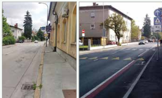
Parmova nekoč ...

Prenova Parmove ulice je zagotovo ena od zahtevnejših prenov, ki potekajo v naši četrti skupnosti.