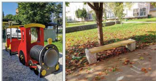
Postavitev igrala pri vrtcu Jelka in ureditev vrta ter postavitev klopi pri OŠ Savsko naselje

V tem času smo se sestali na sedmih rednih in dveh izrednih sejah ter odločitve sprejemali na štirih korespondenčnih sejah. Na sejah smo obravnavali različne problematike v naši četrti skupnosti, potrdili zaključni račun za leto 2018, sprejeli izvedbeni načrt za tekoče leto ter finančna načrta za leti 2020 in 2021. Izvedli smo nekaj brezplačnih aktivnosti in dogodkov za občane. Več o tem najdete na sredini glasila – v rubriki Utrinki s prireditve in dogodkov ČS Bežigrad. Do konca leta načrtujemo še dogodka za naše najmlajše in najstarejše občane ter nakup manjših paketov pomoči, ki jih prek osnovnih šol, Karitas, Rdečega križa in društev upokojencev razdelimo družinam in posameznikom v socialni stiski.