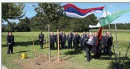
Saditev spominskega drevesa ob 75-letnici Partizanskega pevskega zbora v Parku prijateljstva 20. 9. 2019.