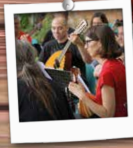
Koncert Orkestra Mandolina Ljubljana

Plesni večeri za občane Po poletnem premoru smo oktobra ponovno pričeli z brezplačnimi plesnimi tečaji za občane, ki potekajo vsak petek od 19.30 do 21. ure v dvorani MOL, Belokranjska 6. Plesni večeri bodo predvidoma potekali do konca decembra. Vabljeni.