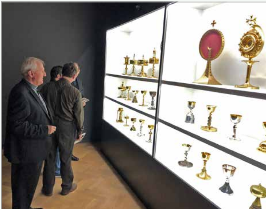
Odprtje razstave Plečnikovih kelihov

Junija so v Vatikanskih muzejih odprli razstavo Plečnikov in sveto, ki je nastala v sodelovanju Muzejev in galerij mesta Ljubljane (MGML), Veleposlaništva RS pri Svetem sedežu ter s podporo Ministrstva za kulturo RS in Nadškofije Ljubljana. Od 26. septembra si jo je mogoče ogledati tudi pri nas, in