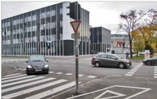
Preurejeno križišče Samove ul. in Vodovodne c. z novo Krkino poslovno stavbo

Prva faza je zaključena in s tem tudi težave v prometu, s katerimi smo se soočali krajanji v času del. Gre za veliko pridobitev za naš del mesta, saj je bila obnovljena vsa dotrajana infrastruktura.