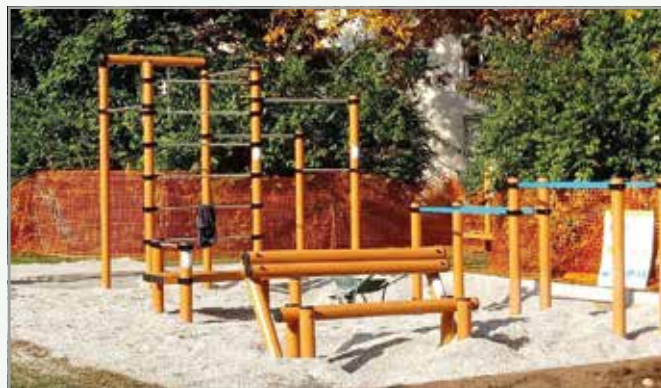
Orodja za vadbo ob ulici Pohorskega bataljona

Novih ureditev in pridobitev so bile deležni tudi osnovne šole in vrtci, dvorana Slovenskega mladinskega gledališča, delno pa so bile prenovljene vežice na Kerševanovih Žalah, novo rekreacijsko točko z orodji za vadbo pa smo pridobili med Šarhovo ulico in ul. Pohorskega bataljona.