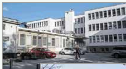
Enota Bežigrad Zdravstvenega doma Ljubljana – nekoč in danes

Med pridobitve, ki smo jih zagotovo veseli vsi Bežigrajčani in Bežigrajčanke, sodi prenova in razširitev Zdravstvenega doma Ljubljana – enote Bežigrad. V dobrem letu gradnje je na mestu nekdanjega pritličnega prizidka, v katerem je deloval pediatrični oddelek, zrasla sodobna trinadstropna zgradba, ki bo nudila več prostora za delo zdravstvenega osebja in več udobja za uporabnike zdravstvenih storitev.