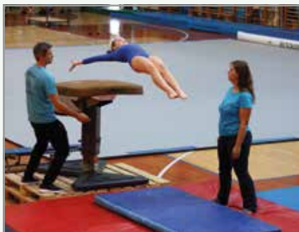
Sokol Bežigrad na državnem prvenstvu v TeamGymu, Portorož, 19. oktober 2019