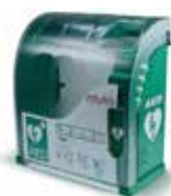
Omarica za defibrilator

Življenjsko pomembno je, če vemo kako, kaj in, kar je najpomembnejše, da ni strah pomagati človeku, ki bled, negiben in brez znakov življenja leži pred nami. Naša naloga je, da ljudem pomagamo premagati strah, vas poučimo, kako izvajamo zunanjo masažo srca, kje najdete avtomatski zunanji defibrilator in kako ga pravilno uporabljati.