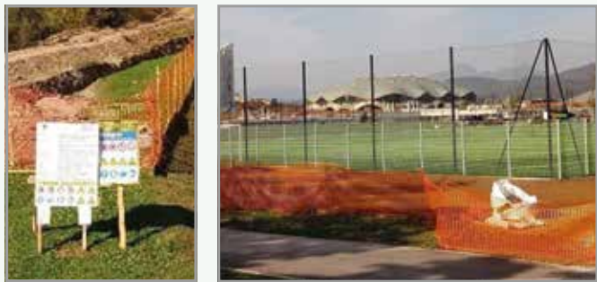
Območje med PST in ŠP Stožice nekoč in danes

V okviru Športnega parka Stožice, kjer je v lanskem letu potekala pokablitev daljnovođa, so danes že urejeni vadbeno (pomožno) nogometno igrišče in nove sprehajalne poti.