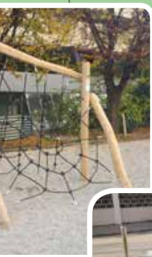
Mala dela ČS Bežigrad