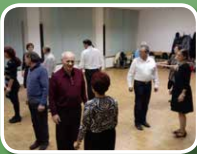
Plesni tečaji za občane – jesen 2017