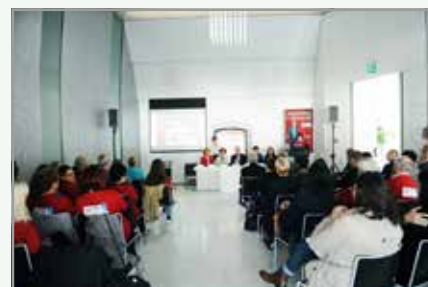
Pozdrav predsednice društva na novinarski konferenci

za določene starostne in specifične populacije. Priporočeno število korakov je: