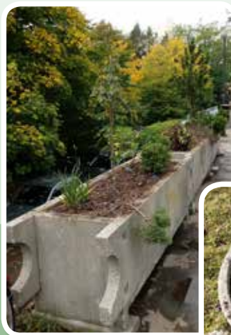
Ureditev korit na Kardeļjevi ploščadi in ob Kržičevi ulici