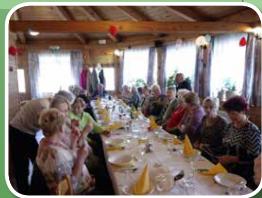
Srečanje prostovoljcev in upokojencev – 17. oktober 2017