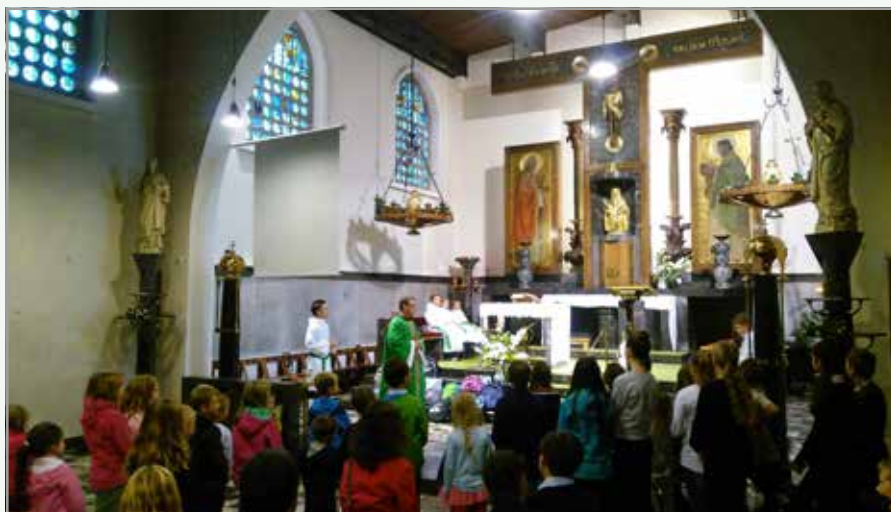
Blagoslov učencev in torb ob začetku šolskega leta

V župniji Bežigrad smo z mladimi sodelavci izpeljali naš največji poletni projekt za otroke – Oratorij, ki je potekal od 3. do 7. julija. Sicer pa smo v novo šolsko leto vstopili z blagoslovom učencev ter tudi šolskih torb in potrebščin. Konec septembra pa smo se poseselili skupaj z zakonci ob njihovih jubilejih – od 10 do rekordnih 60 let!