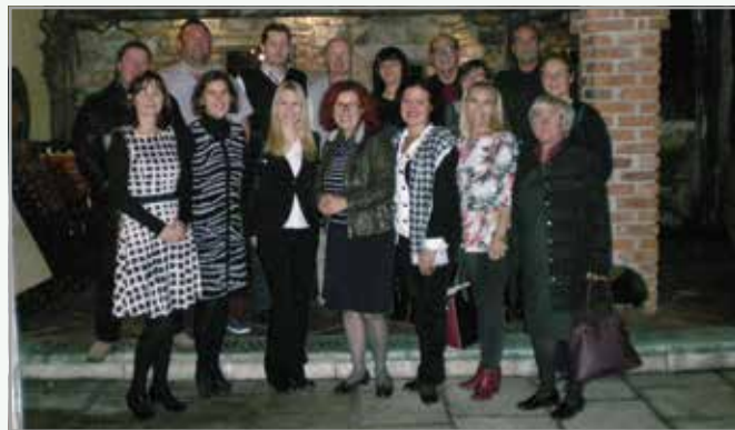
Članice in člani Sveta Četrtna skupnosti Bežigrad

Dejavna je bila tudi komisija za urbanizem, promet, komunalo in urejanje okolja pri Svetu ČS Bežigrad. Vrtnarstvo