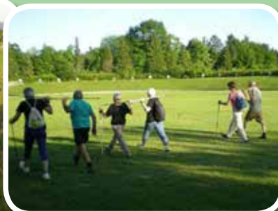
Tečaj nordijske hoje za občane – junij in september 2017