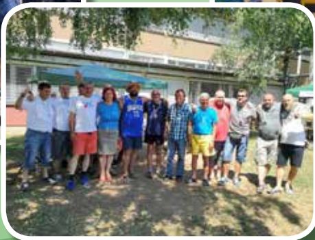
Spomladanski in jesenski turnir v prstometu Četrtnе skupnosti Bežigrad – 18. junij in 5. november 2017