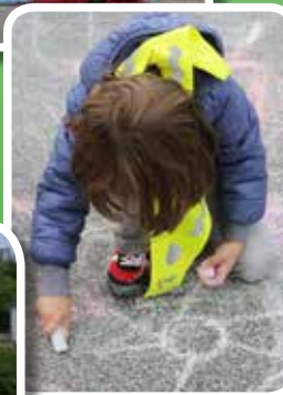
Zaključek Evropskega tedna mobilnosti – dan brez avtomobila in Dan Četrtn skupnosti Bežigrad 22. september 2017