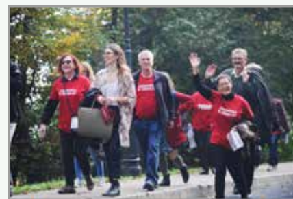
Pohod prostovoljcev društva na ljubljanski grad

Priznana raziskovalka hoje, profesorica Tudor-Locke in kolegi, priporočajo spremljanje stopnje sedenčega življenjskega sloga z uporabo števca korakov. V ta namen so sestavili priročna navodila o priporočenemu dnevnomu številu korakov