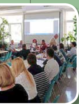
Bežigrad s predstavniku maj 2017