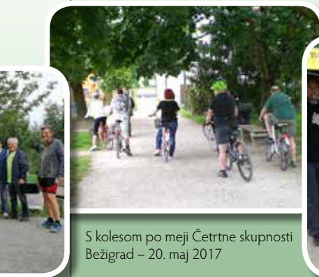
S kolesom po meji Četrtnе skupnosti Bežigrad – 20. maj 2017