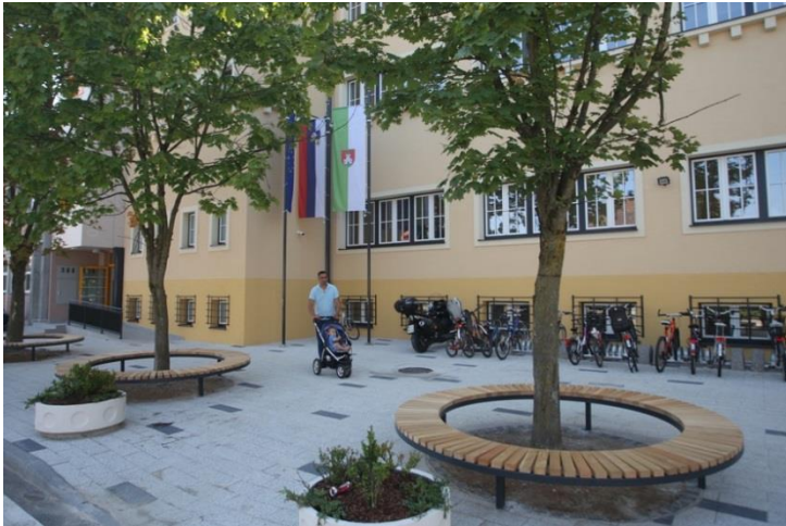
Slika 3: Okolica osnovne šole Vide Pregarc po prenovi

Novogradnja osem oddelčnega Vrta Pedenjped, enota Kašelj, z razvojnim oddelkom za otroke s posebnimi potrebami, je v fazi pridobivanja gradbenega dovoljenja, potekajo postopki, vezani na izvedbo javnega naročila za izbiro izvajalca del, na podlagi katerega se bo začela gradnja (predviden zaključek v 2018).