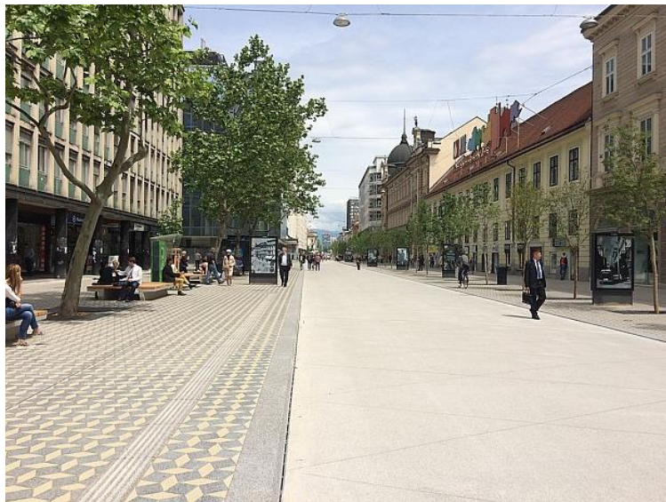
Slika 6: Taktilna pot na prenovljeni Slovenski cesti.

Jakopičevem sprehajališču do gozdne učilnice v Tivoliju. Taktilne oznake na Bregu in na Roški cesti so prvi poskus nameščanja tovrstnih oznak v Ljubljani in jih ni mogoče šteti v celovit in uporabnikom uporaben sistem vodenja.