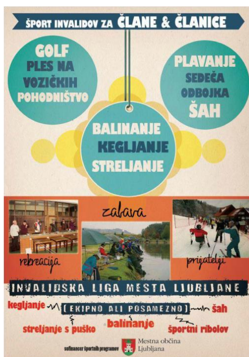
Slika 20: Promocija športno rekreativnih programov za osebe z oviranostmi, ki jih sofinancira MOL