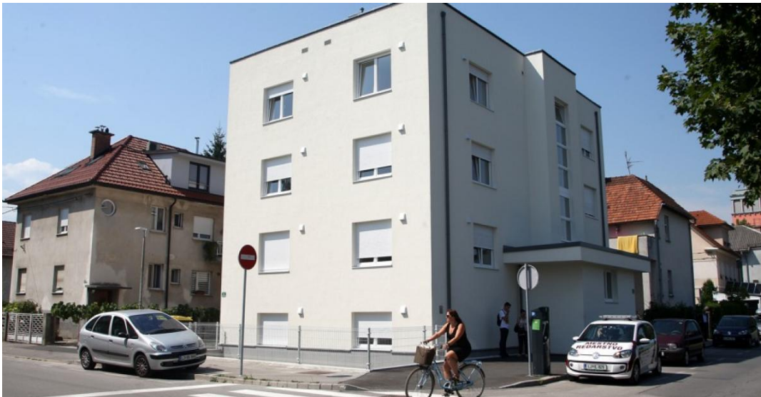
Slika 10: Nova neprofitna najemna stanovanja na naslovu Ob Ljubljani 42

Večstanovanjsko stavbo na naslovu Ob Ljubljani 42, z uporabnim dovoljenjem z dne 21. marec 2017, je investitor prevzel po opravljenem kvalitativnem pregledu v mesecu juliju 2017, ko je tudi začel z oddajo stanovanj upravičencem. Z izvedbo prenove in rekonstrukcije stavbe se obstoječa etažnost stavbe (K + P + 2N) ni spremenila. V stavbi, ki je bila v okviru prenove tudi energetsko sanirana, je JSS MOL pridobil skupno 10 neprofitnih stanovanjskih enot s pripadajočimi shrambami v kleti. Eno stanovanje je prilagojeno za uporabo gibalno ovirane osebe. Ob obstoječem stopnišču na severni strani stavbe je bilo vgrajeno osebno dvigalo. Glavni vhod v objekt je bil zaradi zagotavljanja neoviranega dostopa prestavljen na dvoriščno stran. Eno od dveh zunanjih parkirnih mest je namenjeno osebam z oviranostmi. Projekt je bil zaključen v letu 2017, v letu 2018 pa so stanovanja že v uporabi najemnikov.