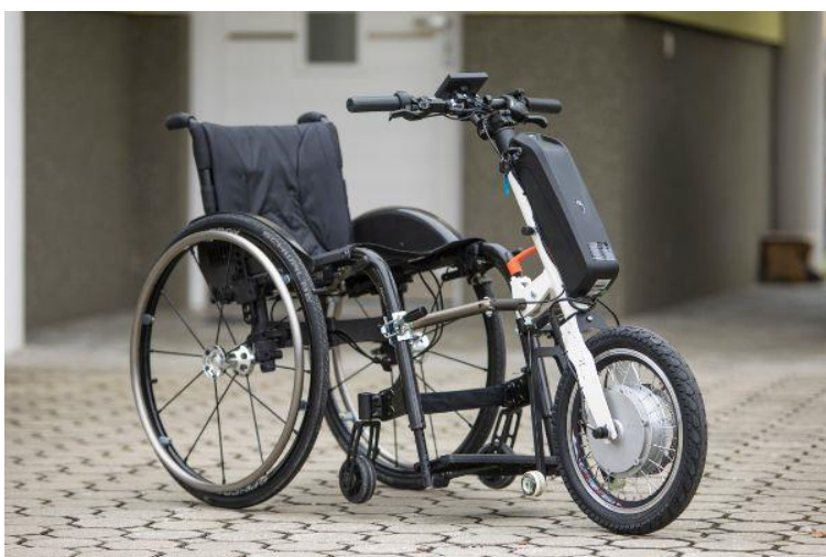
Slika 11: Električni priklop za invalidske vozičke, ki ga za izposajo zagotavlja JZ Turizem Ljubljana.

Za lažje premagovanje daljših poti po mestu JZ Turizem Ljubljana zagotavlja možnost brezplačne izposoje električnega priklopa za invalidske vozičke. V Slovenskem turistično informacijskem centru, Krekov trg 10, sta na voljo dva priklopa, za dan izposoje je potrebno predložiti kopijo osebne izkaznice ali potnega lista ter vplačati kavcijo v višini 300 eurov, ki se ob vračilu nepoškodovanega priklopa v celoti vrne. Gre za inovativen produkt, razvit v Sloveniji, ki presega kakovost in enostavnost vseh podobnih izdelkov v Evropi in svetu. Priklop se enostavno pripne na voziček, ki ga oseba sicer uporablja in je primeren za vožnjo tudi do 40 km z enim polnjenjem baterije.