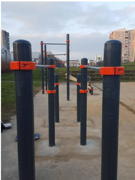
Slika 14: Naprave za ulično vadbo

V skladu z Odlokom o posebni rabi javnih površin v lasti Mestne občine Ljubljana (Ur. l. RS, št. 105/15) ter skladno s pooblastili iz naslova Zakona o cestah (Uradni list RS, št. 109/10, 48/12, 36/14 – odl. US, 46/15 in 10/18) je Inšpektorat MU MOL zagotavljal redni in izredni nadzor nad neovirano in varno uporabo javnih površin (predvsem nadzor nad postavljanjem gostinskih vrtov, »A« panojev in drugih predmetov na javno površino brez dovoljenja oziroma v nasprotju z izdanim dovoljenjem ter nadzor nad postavljanjem ovir na cesti in odrejanje ukrepov za odpravo nepravilnosti skladno z zakonom ter v okviru pooblastil s tega področja). V 2017 in 2018 je Inšpektorat MU MOL uvedel skupno 788 prekrškovnih postopkov in 1058 upravnih inšpekcijskih postopkov iz naslova predmetnega zakona in odloka.