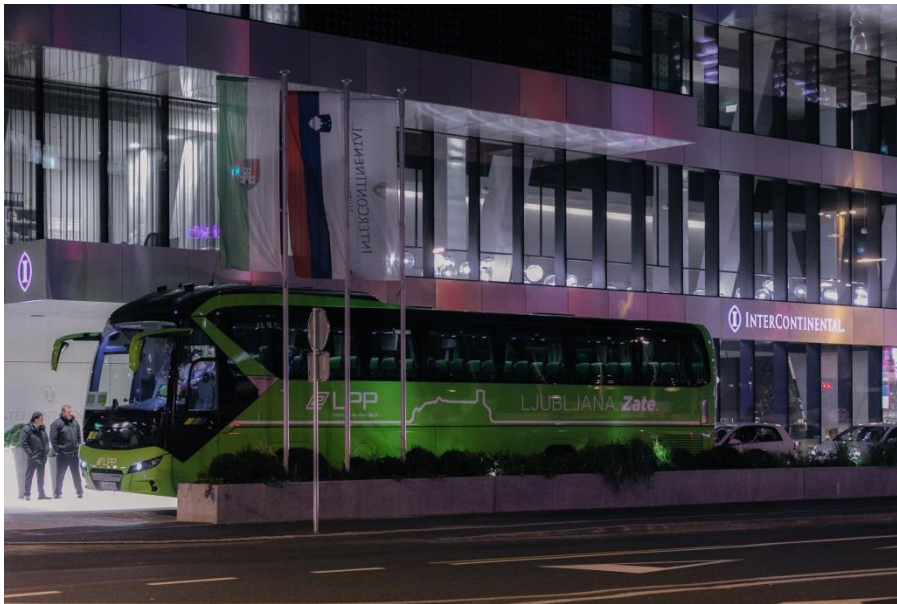
Slika 18: Nov turistični avtobus LPP d.o.o., dostopen tudi osebam na invalidskih vozičkih

Po več letih prizadevanj je LPP d.o.o. v 2017 izvedel nakup dveh turističnih avtobusov za občasne prevoze. Avtobusa podjetja MAN se ponašata s prostornostjo in udobjem in sta prva tovrstna v Sloveniji s posebnim dvigalom, ki zagotavlja udoben vstop na avtobus potniku na invalidskem vozičku. Na enem avtobusu lahko hkrati potujeta dve osebi na invalidskih vozičkih.