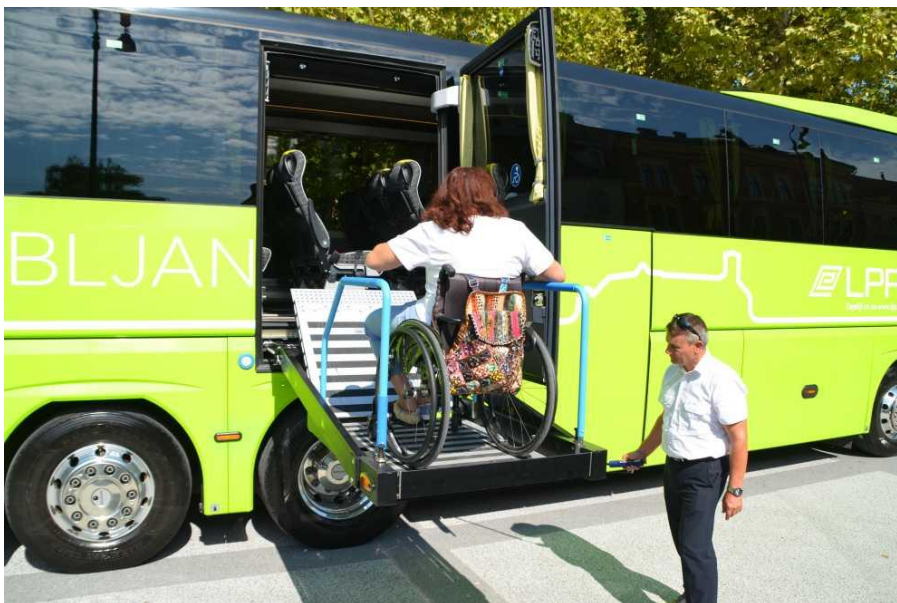
Slika 19: Nov turistični avtobus LPP d.o.o. z dvigalom, ki zagotavlja udoben vstop na invalidskem vozičku.

Po več letih prizadevanj je LPP d.o.o. v 2017 izvedel nakup dveh turističnih avtobusov za občasne prevoze. Avtobusa podjetja MAN se ponašata s prostornostjo in udobjem in sta prva tovrstna v Sloveniji s posebnim dvigalom, ki zagotavlja udoben vstop na avtobus potniku na invalidskem vozičku. Na enem avtobusu lahko hkrati potujeta dve osebi na invalidskih vozičkih.