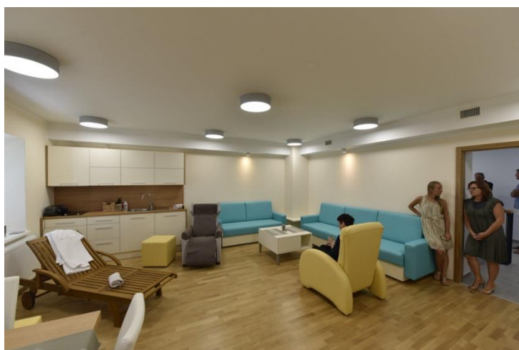
Sliki 8 in 9: Zunanost in notranji prostori prenovljene stavbe na Vodnikovi ulici 5, ki je v uporabi Centra za usposabljanje, delo in varstvo Dolfke Boštjančič, Draga