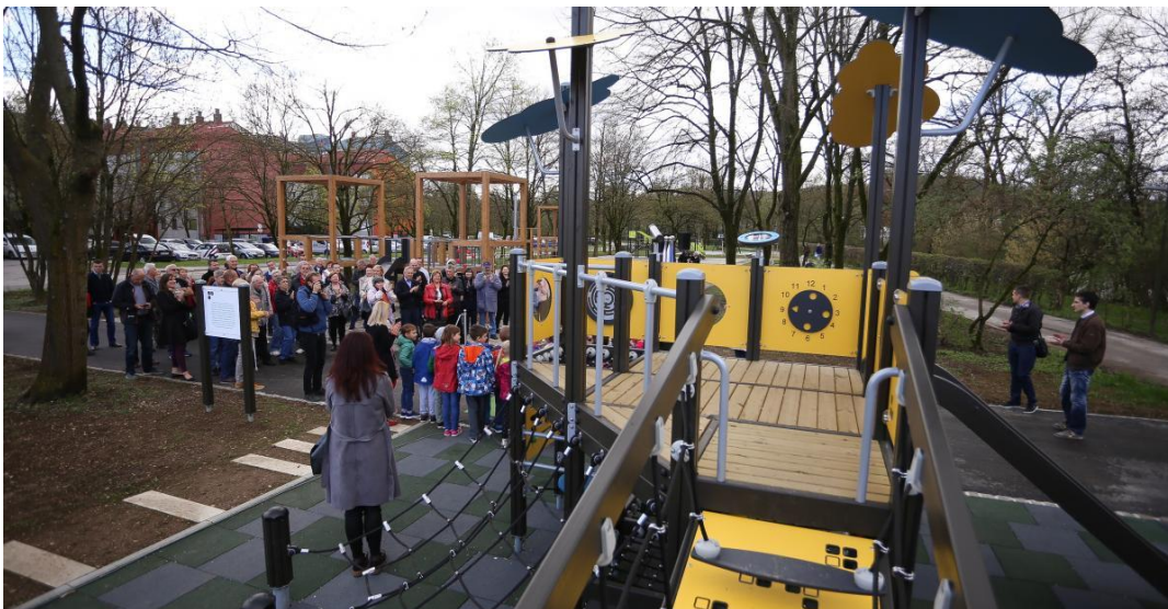
Slika 13: Otvoritev parka Muste

MOL (Oddelek za varstvo okolja MU MOL) je v 2017 začel ter v 2018 končal z gradnjo družinskega parka Muste. Nov park povezuje Nove Fužine in Štepanjsko naselje na nasprotnih nabrežjih Ljubljane, oba dela pa povezuje nov doživljajski most. V parku se nahajajo tudi igrala in naprave za gibalno ovirane otroke in starejše. Na severni strani je park zaključen z urbanim sadovnjakom (že četrtim v MOL) s 64 sadnimi drevesi, ob sadovnjaku je še 14 parkovnih dreves, kot drevored ob Poti na Fužine. Na tem delu je tudi novo vzdolžno parkirišče za potrebe gibalno oviranih, ki je s potko povezano z družinskim parkom oziroma z igriščem.