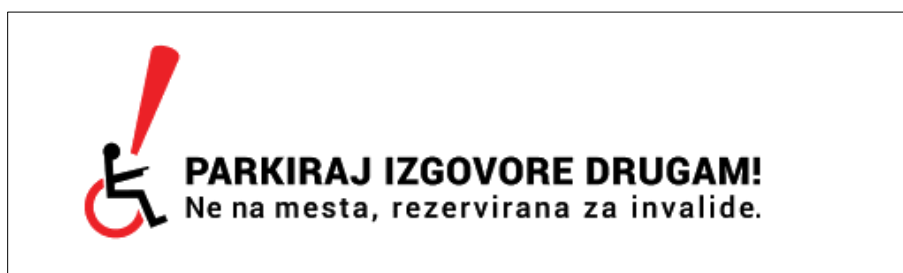
Slika 15: Logotip kampanje Parkiraj izgovore drugam! Ne na mesta, rezervirana za invalide.

aktivnostim. Kampanja je vključevala tako aktivnosti za ozaveščanje širše javnosti o problematiki (izdelan je bil odmeven TV spot, spletna stran projekta, objave na spletni strani MOL...), strokovne posvete oziroma predstavitve in poostren nadzor na terenu. Slednji je potekal od 4. do 17. decembra 2017 in 3. decembra 2018; mestni redarji so v omenjenih terminih nadzor nad uporabo parkirnih mest, rezerviranih za osebe z oviranostmi, izvajali na celotnem območju MOL, s poudarkom na bolj frekventnih lokacijah v mestnem središču in v okolici nakupovalnih središč, kjer najpogosteje prihaja do tovrstnih kršitev. Glavni partner in koordinator projekta oziroma kampanje je bila Javna agencija RS za varnost prometa, ostali partnerji pa MOL, Fakulteta za varnostne vede Univerze v Mariboru in Taktik, agencija za komunikacijski management d.o.o.