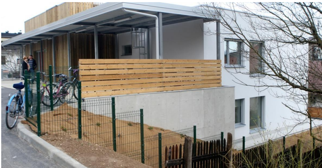
Slika 7: Hiša Sonček

V okviru redne naloge oddajanja neprofitnih najemnih stanovanj v najem različnim neprofitnim organizacijam za izvajanje podpornih oblik bivanja so bile v uporabo dodeljene 4 stanovanjske enote oziroma stavbe. YHD – Društvo za teorijo in kulturo hendikepa je bilo dodeljeno stanovanje, prilagojeno uporabnikom invalidskih vozičkov, ustrezno prilagojeno večsobno stanovanje je bilo dodeljeno Zavodu za gluhe in naglušne Ljubljana. Sredi leta 2017 je bila dokončana izgradnja Hiše Sonček in bila oddana Sončku – Zvezi društev za cerebralno paralizo Slovenije, so.p. (v njej prebiva 12 uporabnikov). Prenova stavbe na naslovu Vodnikova 5, v kateri biva 12 varovancev Centra za usposabljanje, delo in varstvo Dolfke Boštjančič, Draga je bila zaključena in predana v uporabo avgusta 2018. V času priprave tega poročila ima 8 invalidskih organizacij v najemu skupno 25 stanovanjskih enot, od tega 3 hiše, v katerih bivajo njihove članice in člani.