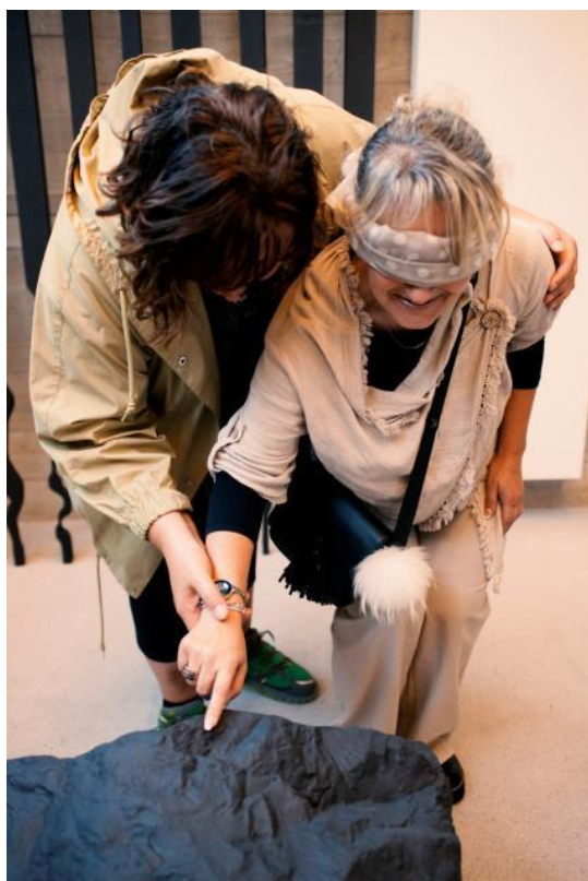
Slika 21: Utrinek iz delavnice MGLC