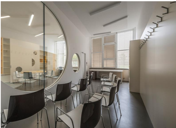
Sliki 26 in 27: Sodobno opremljeni prostori Izobraževalnega centra Pika, na naslovu Zemljemerska ulica 7