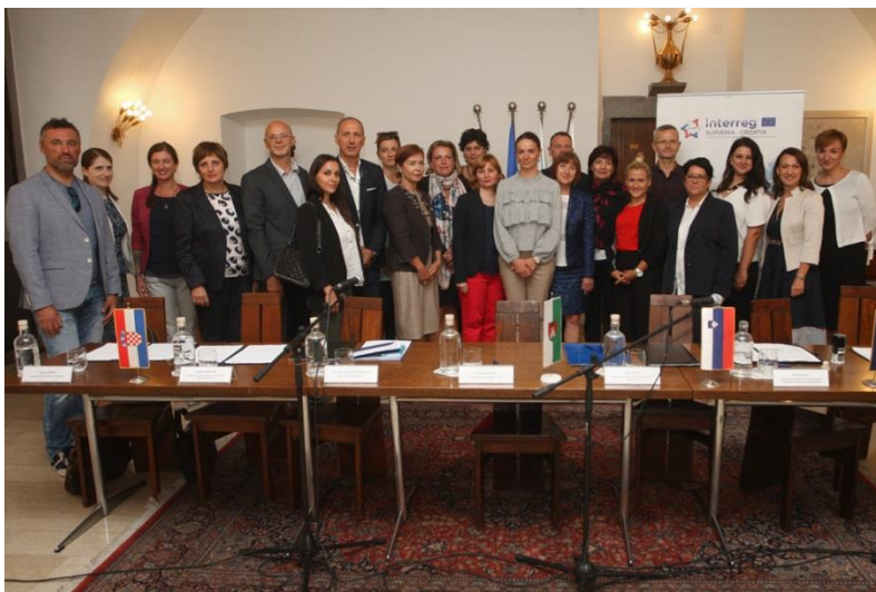
Slika 29: Podpis partnerskega sporazuma za projekt CrossCare

ZOD je nosilec mednarodnega projekta CrossCare (sofinancira ga Evropski sklad za regionalni razvoj v okviru programa sodelovanja Interrrg SL – HR), v okviru katerega izvaja brezplačne storitve fizioterapije, delovne terapije, zdravstvene nege in dietetike na domovih uporabnic in uporabnikov. Partnerski sporazum za projekt CrossCare je bil podpisan septembra 2018 v Mestni hiši MOL.