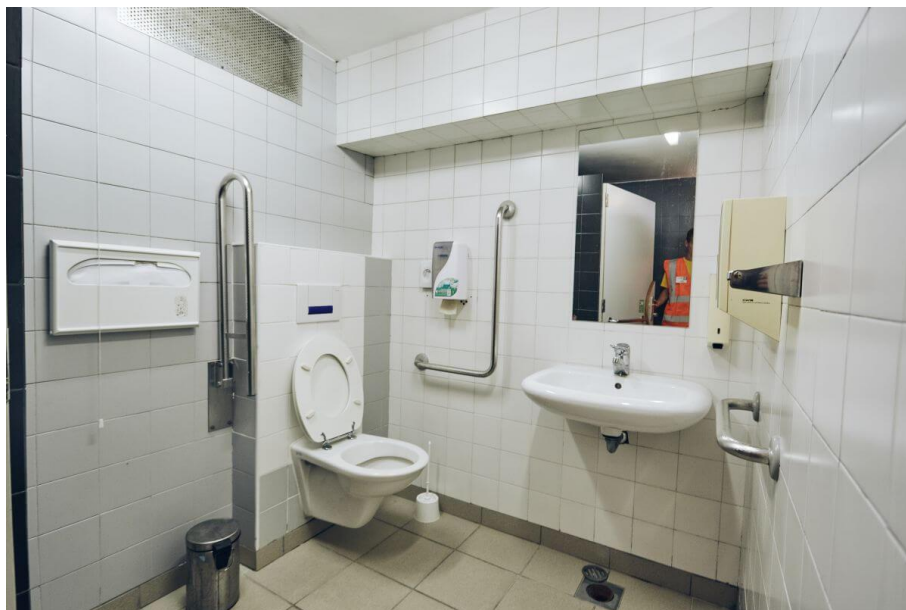
Slika 6: Osebam z oviranostmi prilagojene javne sanitarije