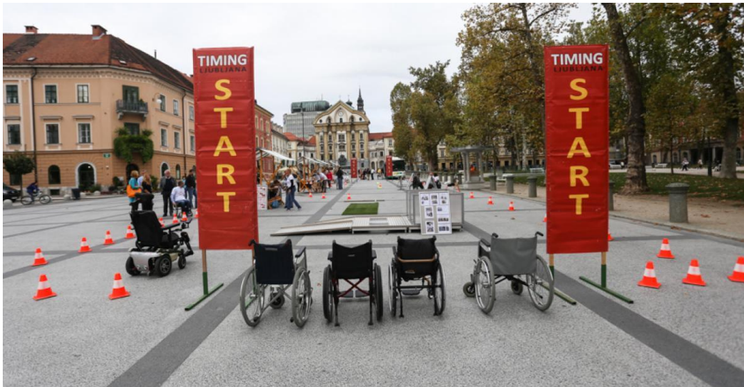
Slika 1: Štartno mesto za preizkus ovir na OVIRANTlonu leta 2017

Za prejem pobud in vprašanj, s katerimi se občanke in občani obračajo na MOL, je vzpostavljena enotna vstopna točka, spletni portal Servis pobude meščanov , ki je dostopen na spletni povezavi https://pobude.ljubljana.si/ . Spletni portal od avgusta 2018 deluje v prenovljeni različici, optimiziran proces obravnave pobud je zdaj standardiziran, enak postopek obravnave velja za vse oddelke in službe MOL, pri čemer so tudi jasno opredeljene odgovornosti, naloge in vloge posameznikov v procesu. Tako prenovljen proces in zaledni portal omogočata hitrejšo, učinkovitejšo in prijaznejšo komunikacijo z občani. Občanke in občani MOL se za pobude in vprašanja lahko obrnejo na MOL tudi osebno – na Odsek za pobude meščanov in na župana MOL, ob organiziranih dnevih odprtih vrat, vsak prvi torek v mesecu ter preko telefona, faksa in elektronskega naslova pobude@ljubljana.si .