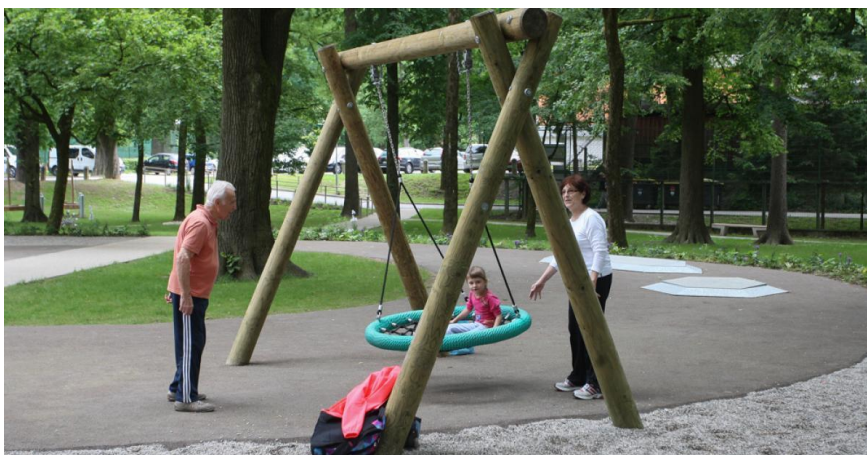
Slika 12: V Parku Kodeljevo je od maja 2018 prenovljeno otroško igrišče s kakovostnimi igrali, dostopnimi tudi otrokom z oviranostmi.

MOL pri urejanju javnih površin in parkov zagotavlja brezplačno dostopna zunanja igrala/ naprave, ki jih lahko uporabljajo tudi otroci s posebnimi potrebami. Vsako leto je obnovljenih (okoli 15) ali na novo urejenih več javnih igrišč, za vzdrževanje katerih skrbi JP Snaga, d.o.o. Še posebej dostopna in otrokom s posebnimi potrebami prijazna so otroška igrišča v Severnem mestnem parku, v Šmartinskem parku, v parku Tivoli ter v dveh novo urejenih, v Parku Kodeljevo in v Družinskem parku Muste.