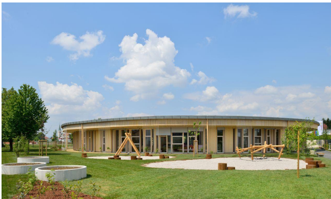
Slika 5: Novozgrajena enota vrta Pedenjped v Kašlju

Dostopnost predšolskega in osnovnošolskega izobraževanja v MOL je bila v obdobju, na katerega se nanaša poročilo, dodatno obogatena z izvedbo vgradnje dvigala v Osnovni šoli Dragomelj ter z zaključkom izgradnje in začetkom delovanja Pedenjcarstva, nove enote vrta Pedenjped, na naslovu Kašeljaska cesta 125, kjer se poleg rednega programa izvaja tudi specializiran program za predšolske otroke z motnjami avtističnega spektra.