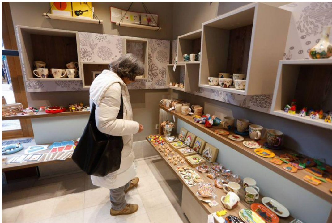
Slika 2: Skrbovin'ca, kjer so na prodaj izdelki oseb s posebnimi potrebami, ima prostore v Informacijski točki MOL za starejše 65+ in za osebe z oviranostmi.

Ljubljana (Dnevni centri aktivnosti za starejše Ljubljana), Združenje gluhoslepih Slovenije Dlan, Društvo paraplegikov ljubljanske pokrajine, Društvo Projekt Človek, Društvo SOS telefon za ženske in otroke – žrtve nasilja, Društvo invalidov Ljubljana – Center, Društvo Altra – Odbor za novosti v duševnem zdravju, Društvo distrofikov Slovenije, slikarska skupina upokojencev Union 04 in Center Iris – Center za izobraževanje, rehabilitacijo, inkluzijo in svetovanje za slepe in slabovidne. Redno tedensko so bile zainteresiranim na voljo brezplačne preventivne meritve krvnega tlaka, srčnega utripa, glukoze, trigliceridov in holesterola (izvajalec Društvo za zdravje srca in ožilja).