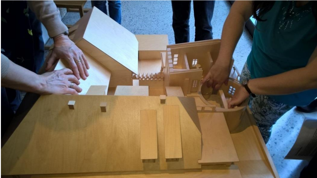
Slika 24: Spoznavanje s Plečnikovim domovanjem na več-čutnem vodenju v Plečnikovi hiši

dostopno. V razstavnih prostorih je na voljo posebna tipna maketa Plečnikove hiše za lažjo orientacijo slepih in slabovidnih po prostoru, razstavljenih eksponatov se ni dovoljeno dotikati. Maketa je v uporabi pri vseh ogledih in programih, prilagojenih slepim in slabovidnim. V 2018 so v Plečnikovi hiši izvedli 5 več-čutnih vodstev, s čimer bodo zaradi izjemno pozitivnih odzivov nadaljevali tudi v 2019. Prav tako bo v 2019 pripravljen in v Plečnikovi hiši na voljo tipni zemljevid.