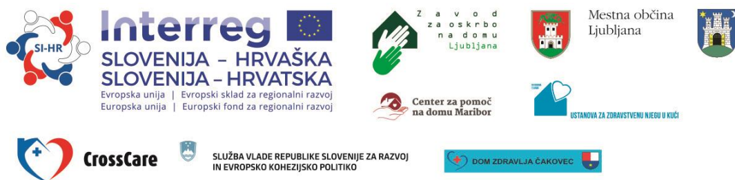
Slika 30: Logotip projekta CrossCare in partnerji v projektu

Kot rezultat sodelovanja ZOD s projektnimi partnerji je bil v okviru projekta CrossCare pripravljen obsežen pisni dokument Integriran pristop oskrbe starejših ljudi na domu/ Integriran pristop skrbi za starije osebe u kući , ki določa način in postopke izvajanja storitev za starejše na domu. Program integriranega pristopa oskrbe na domu združuje socialne in zdravstvene storitve v zaključeno celoto. Je pripomoček za konkretno izvajanje storitev delovne terapije, fizioterapije, zdravstvene nege in dietetike na terenu, in hkrati strokovna podlaga, priročnik za sistemsko ureditev področja, saj določa tudi način in postopke povezovanja storitev socialnega in zdravstvenega varstva.