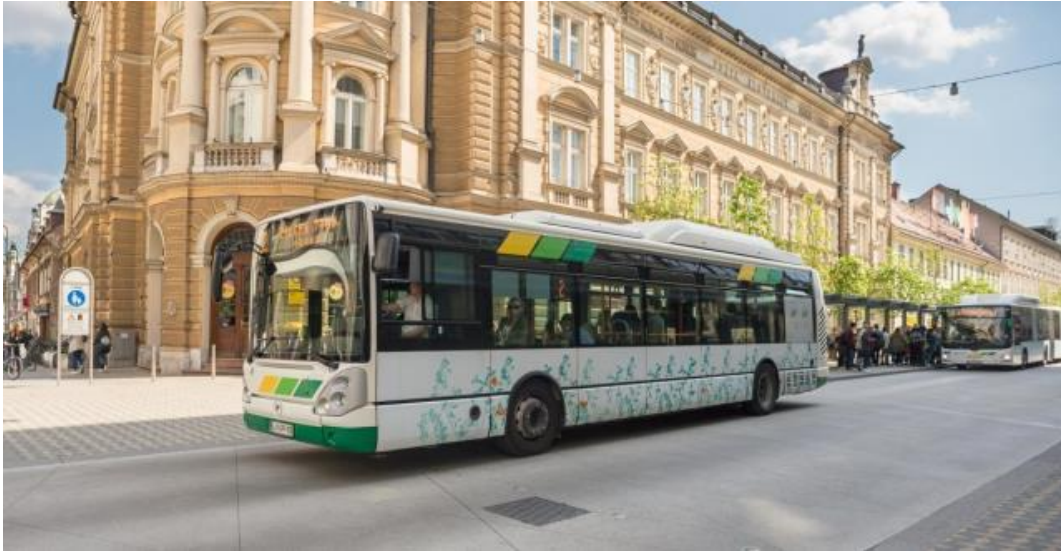
Slika 17: Nizekpodni mestni avtobus na prenovljeni Slovenski cesti, kjer velja omejen prometni režim

Od maja 2016, ko je izvajalec javne službe mestnega linijskega prevoza potnikov v MOL, JP Ljubljanski potniški promet d.o.o. (v nadaljnjem besedilu: LPP d.o.o.), izvedel nakup 30 novih avtobusov, so vsi avtobusi, vključeni v linijski mestni prevoz potnikov, nizekpodni, z nagibno tehniko.