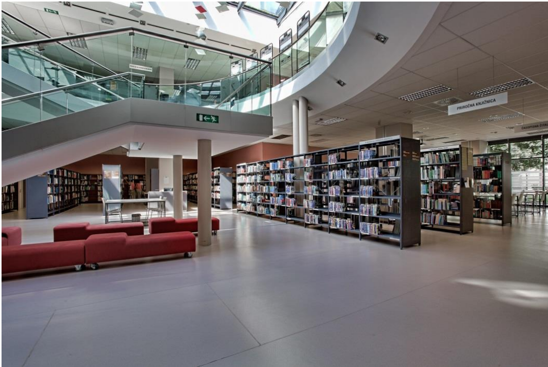
Slika 4: Knjižnica Šiška obratuje v sodobno opremljenih in brez arhitekturnih ovir dostopnih prostorih, na Trgu komandanta Staneta 8, neposredno ob Celovski cesti

JZ Mladi zmagi zagotavlja dostopnost prostorov treh od štirih četrtnih mladinskih centrov (ČMC): za dostop do prostorov ČMC Črnuče, Dunajska cesta 367, je v uporabi dvigalo, ČMC Bežigrad in ČMC Šiška sta dostopna brez arhitekturnih ovir.