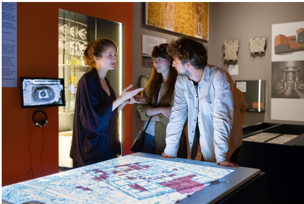
Slika 23: Utrinek iz nove stalne postavitve Ljubljana.Zgodovina.Mesto. v Mestnem muzeju

Po vsem dostopni stalni razstavi Obrazi Ljubljane je v Mestnem muzeju Ljubljana, Gosposka ulica 15, od 8. maja 2018 na voljo nova stalna razstava o zgodovini Ljubljane z naslovom Ljubljana.Zgodovina.Mesto. , ki prinaša pregleden kronološki razvoj prostora ljubljanske kotline od prazgodovine do danes. Za slepe in slabovidne so na voljo tipni zemljevid in tehnični opis stalne razstave, zvočni vodnik bo pripravljen v 2019. Pri pripravi nove stalne razstave je Mestni muzej Ljubljana sodeloval s Kulturno izobraževalnim zavodom Ustvarjalna Pisarna Sodelujem, s katerim pripravljajo tipne zemljevide, zvočni vodnik, tehnične opise in več-čutna vodstva.