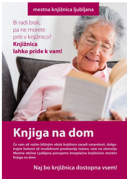
Slika 22: Letak MKL za promocijo storitve Knjiga na dom