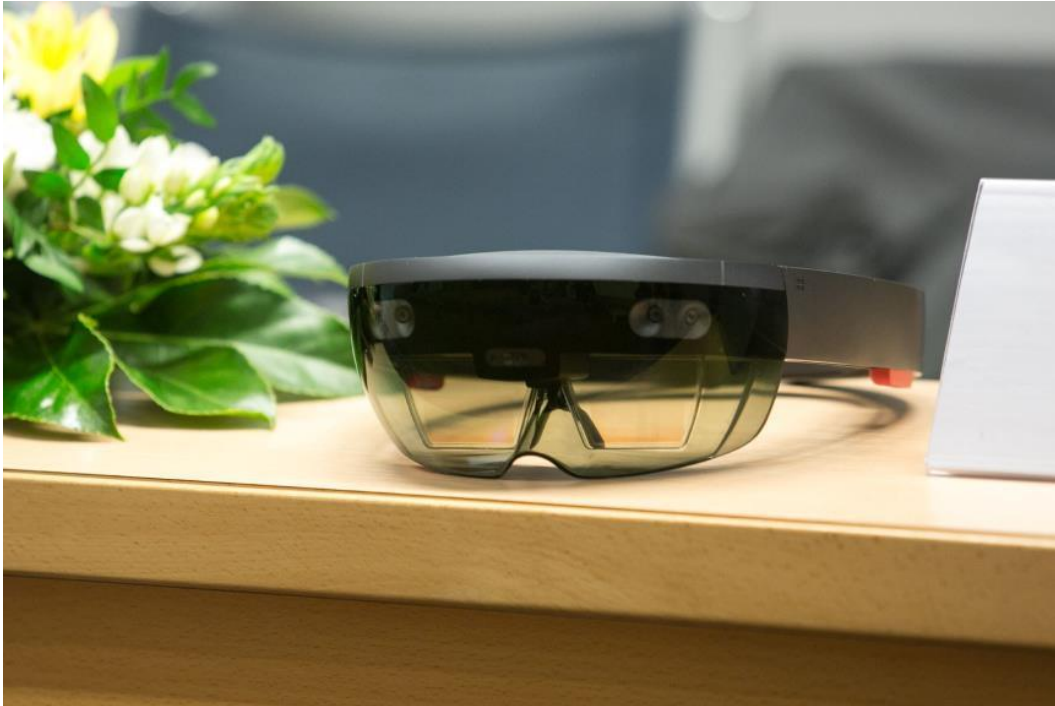
Slika 31: Očala za prikazovanje obogatene resničnosti – nova pridobitev Simulacijskega centra JZ Zdravstveni dom Ljubljana

pomočjo očal lahko izkusimo, kako se nujna stanja izražajo, kako jih prepoznamo in kako je potrebno ravnati, saj očala omogočajo scenarije, ki jih učeči sicer v vsakdanjem okolju morda nikoli ne bi videli ali prepoznali. Posameznik tako s svojim znanjem, ki ga je pridobil skozi simulacijo s pomočjo tovrstnih očal, lahko reši življenja. (iz Sporočila za javnost z novinarske konference 13. marca 2019, na kateri je JZ Zdravstveni dom Ljubljana skupaj s partnerji predstavil nadgradnjo učenja s simulacijami s pomočjo očal za prikazovanje obogatene resničnosti).