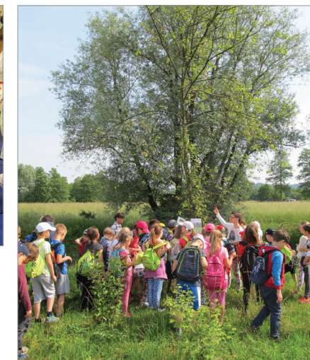
Sponavanje Ljubljanskega barja