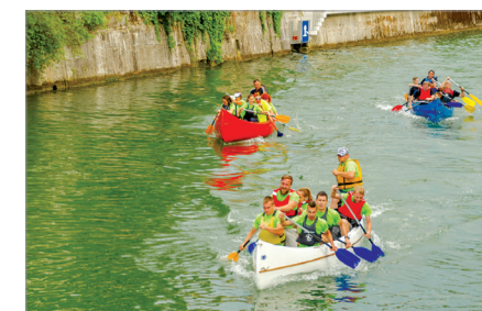
Razgibajmo Ljubljano, tekmovanje ČS