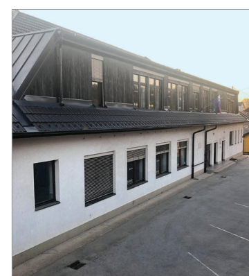
80-letnica podružnične šole ob 11. maja.