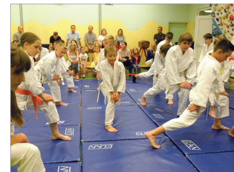
Vadba za otroke in odrasle

* preverite trajanje dejavnosti, datum in/ali uro pri izvajalcu