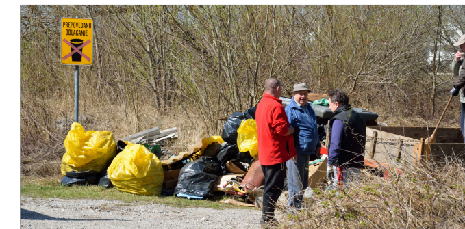
Smeti kar ne zmanjka