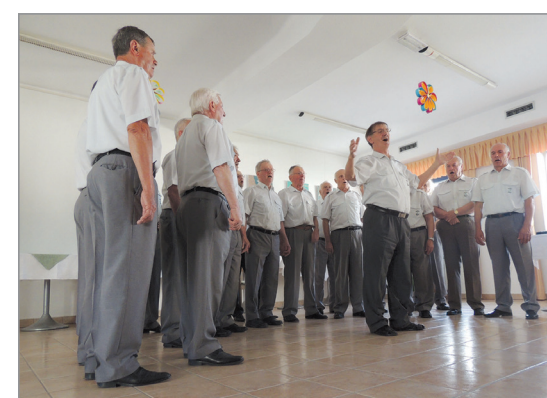
Vaje moškega pevskega zbora.