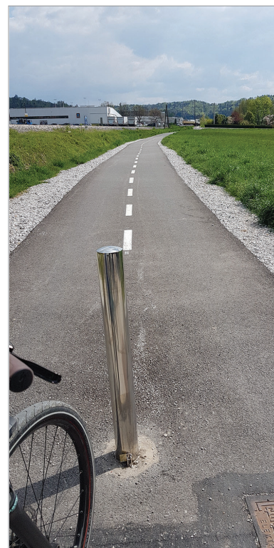
Ureditev kolesarskih poti

Projekt Družbeni center Barje je končno postal projekt, ki je v izvajanju. Za Center Barje, kakor se bo imenoval obnovljen objekt z spremljajočimi zunanji površinami, se pridobivajo dovoljenja in projekti. V začetni fazi pa je projekt Pešpot ob Galjevcu, ureditev pešpoti od Ižanske ceste do NS Rudnik . S to potjo bomo pridobili prijetno pot čez našo četrtno skupnost na mirni lokaciji ter zares varno pot v šolo. Pobude za četrtno skupnost, kot tudi za posamezne svetnike lahko pošljete na mol.rudnik@ljubljana.si.