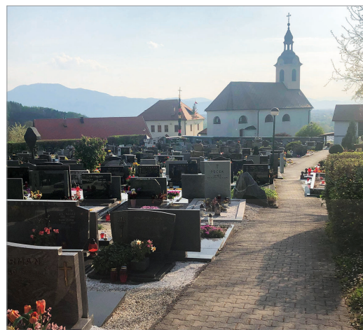
Pokopališče na Rudniku