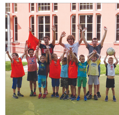
Oratorij v SMC Rakovnik