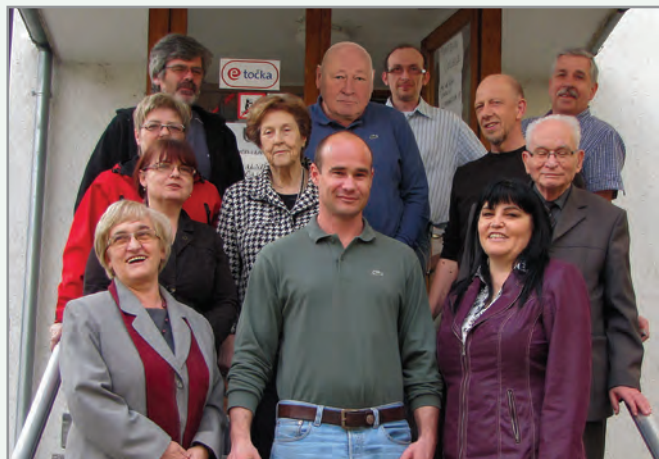
Del članov Sveta Četrtna skupnosti Bežigrad

http://www.ljubljana.si/si/mol/cetrtna-skupnosti/bezigrad/