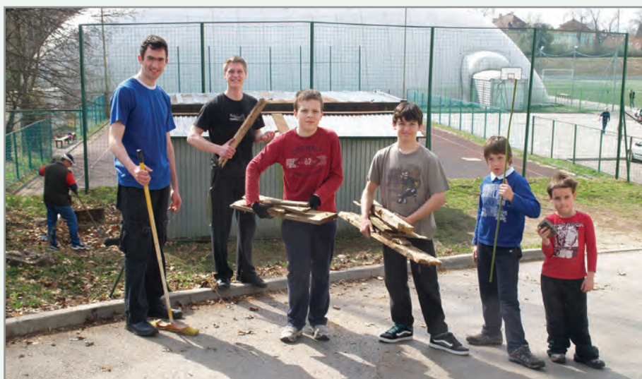
Mladi udeleženci prostovoljne delovne akcije "Očistimo slovenijo"

V lepem sobotnem dopoldnevu smo se zbrali pred telovadnico OŠ dr. Vita Kraigherja, kjer imamo svoje domovanje. Oboroženi z grabljami, žago in škarjami za obrezovanje drevja smo se lotili čiščenja žive meje ob ograji ob Vodovodni cesti in brega pod njo. Obrezali smo podivjano grmičje, pobrali odvrženo embalažo, pločevinke, vejice in veje ter druge smeti in vse pospravili v vreče različnih barv, ktere so nam priskrbeli organizatorji akcije iz Četrtna skupnosti. Z njimi smo se domenili tudi za odvoz kupa lesenih gradbenih odpadkov izza kontejnerja pod bregom. Ves kup smo morali znositi gor na cesto, kamor so ga pozneje prišli pobrat s tovornjakom.