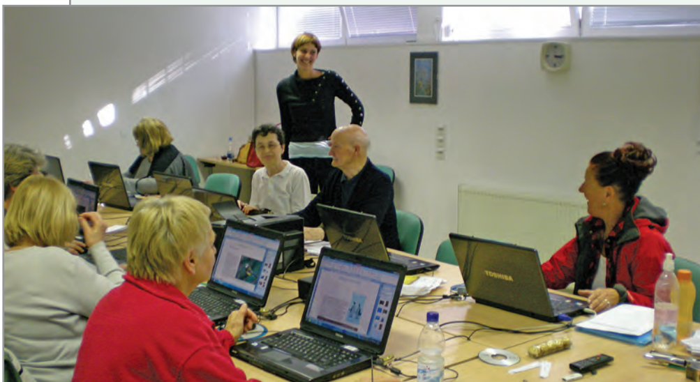
Utrinki z računalniškega tečaja v ČS Bežigrad, januar 2012