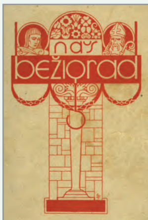
Naslovnica knjige Naš Bežigrad iz leta 1940

Naš Bežigrad je ležal ob severnem delu taborišča, pot pa je rimski legiji in ostalim služila za pohode in trgovanja,