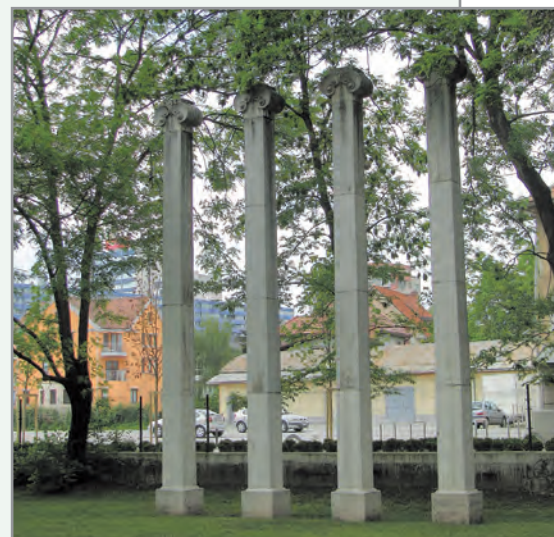
Navje - oaza miru v bližini centra