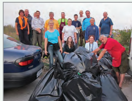
Utrinki iz akcije odstranjevanja alergene rastline – pelinolistne ambrozije