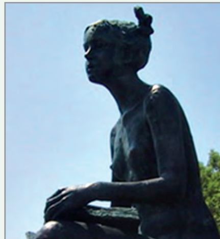
Deklica z rastočo knjigo

Na lanskem dnevu naše četrtne skupnosti smo k srečanju ob Deklici povabili predstavnike odborov političnih strank, ki delujejo na območju naše četrtne skupnosti. Želeli smo si, da bi spoštljivo prisluhnil predstavitvi po ene pomembne vrednote vsake od strank. Lansko leto je to naredil le predsednik ČO ene od strank. Zelo