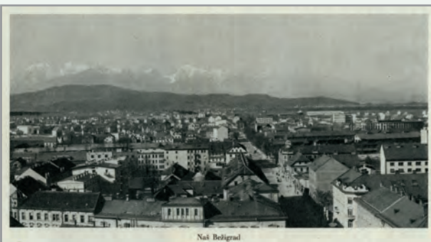
Fotografija Bežigrada okoli leta 1940

morala biti zelo prometna, mogoče celo preobremenjena, saj je potekala preko Celja tudi do Ptuja in naprej ob Podonavju do Osijeka in Beograda. Pot je vodila, kot rečeno na sever, do lesenega mostu čez Savo med Ježico in Črnučami. Sledovi mostu so bili pred drugo svetovno vojno še vidni. Most je bil dolg približno 300 m in širok 8 m. Počival je na 26 nosilcih.