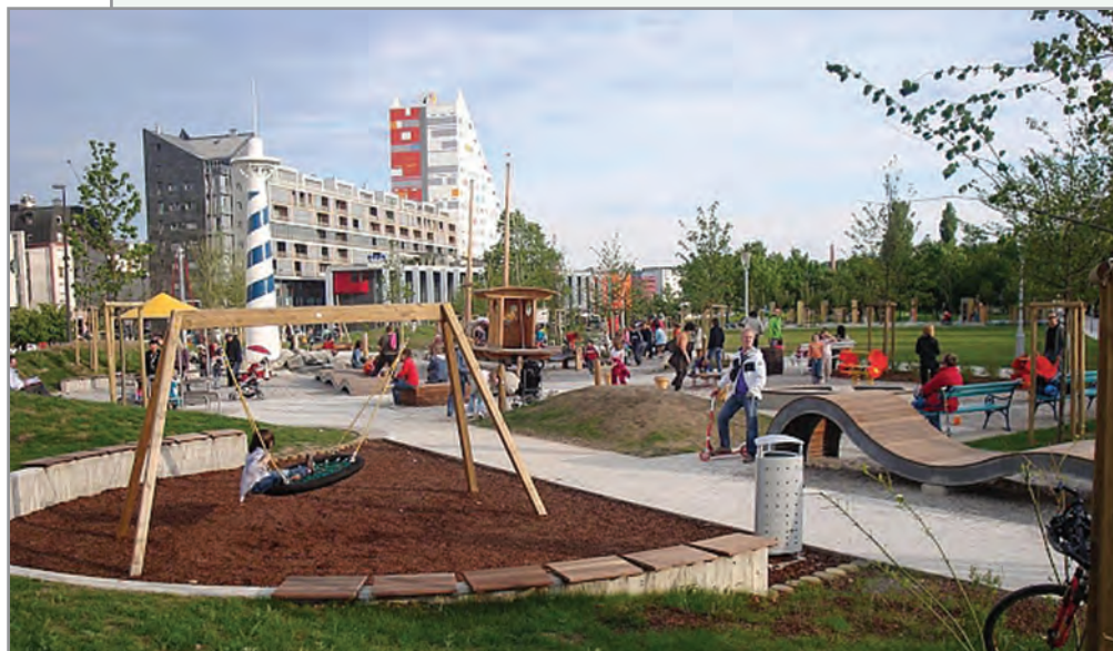
Bežigradski Severni mestni park

našemu vsakdanu - dobro. Verjetno od mladih in za mlade objavljena je ponudba samoorganizirane skupine Prevoz, za prevoze mladih, ki se začenjajo ali končujejo za Bežigradom (npr.: Koper – Ljubljana ob 20h30 za 5 EUR). Splet tu pomaga do cenejšega in učinkovitejšega prevoza mladih. Zeleno, dobro. Tu so objave tekmovanj ekip izza Bežigrada v malem nogometu in še nekaj drugih objav o športnih dogodkih, pri katerih sodelujejo bežigradski športniki. Tu so elektronske storitve javne uprave Ljubljana – izpostava Bežigrad za podaljšanje veljavnosti prometnega dovoljenja in za plačilo uporabe cest. Super. Bilo bi zanimivo vedeti, koliko krajanov že uporablja to možnost. Center za socialno delo Ljubljana – Bežigrad pojasnjuje prakso skupnega starševstva v primerih, ko ločena starša sporazumno še vedno skupaj skrbita za svoje otroke. Vsekakor zelo dragoceno. Predčasni parlamentarni volitev smo se v primerjavi s preostankom Slovenije udeležili nadpovprečno. Kar je dobro. Ljudje verjamejo, da je sodelovanje smiselno. So voljni sodelovati. Povprečna udeležba v Sloveniji je bila 64,65 %, za Bežigrad I. 74 % in Bežigrad II 69 %.