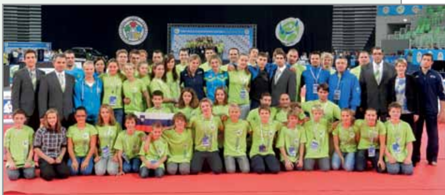
Mladinsko svetovno prvenstvo