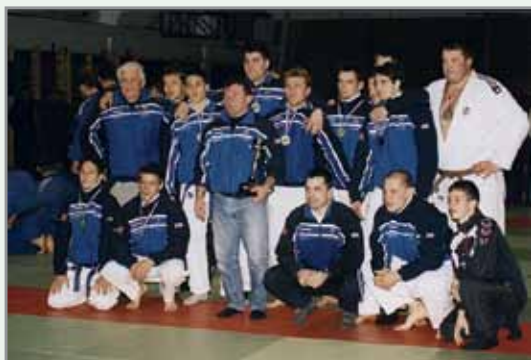
Prvaki 1. lige 2001