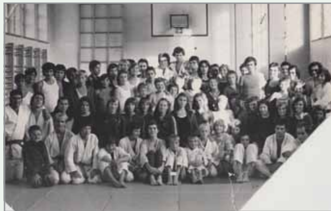
Prva leta judo kluba