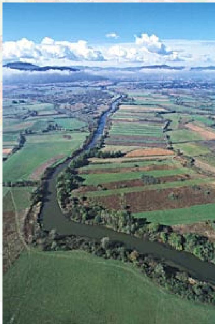
Pogled na Barje z Ljubljano iz zraka, oktober 1997. Ciril Mlinar ( http://www2.pms-lj.si/razstave/barje/barje.html )

Bralkam in bralcem želimo obilo zdravja in sreče v letu, ki prihaja.