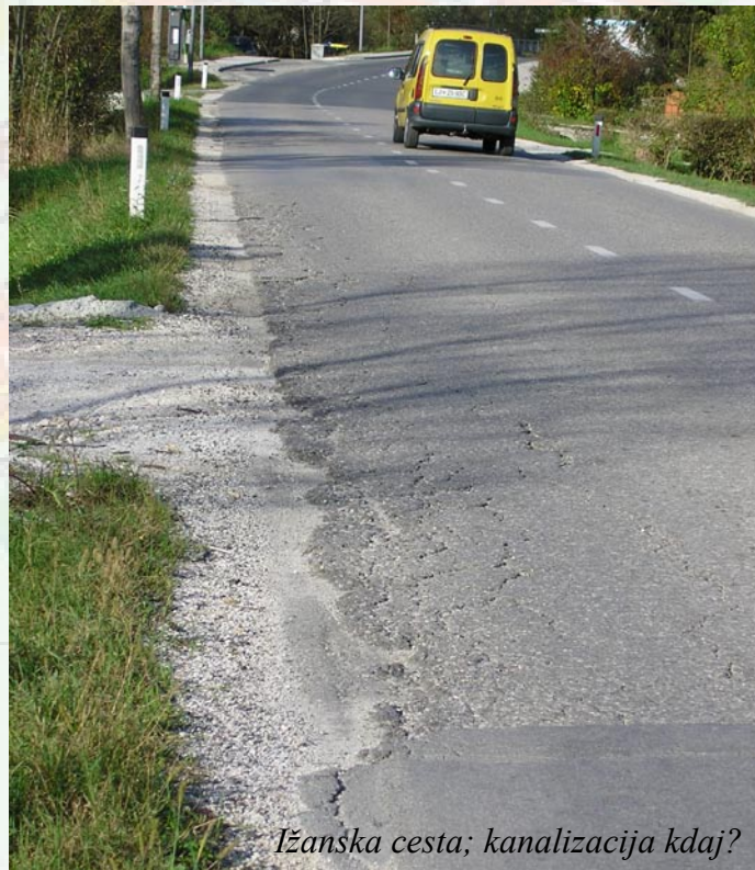
Ižanska cesta; kanalizacija kdaj?

V času pred pričetkom šole smo pridobili nov montažni šolski objekt, ki dopolnjuje prostorske zmogljivosti Osnovne šole Oskar Kovačič. Štirje novi razredi na lokaciji bivše krajevne skupnosti Galjevica omogočajo primerno izvajanje pouka devetletke. Okoli izgradnje montažnega objekta je bilo kar nekaj nestrinjanja s strani predstavnikov Sveta staršev šole, ki so predlagali prenos sredstev namenjenih za montažni objekt v izgradnjo prizidka na lokaciji šole Ob dolnjski železnici 48. Po preučitvi situacije se je Svet Četrtna skupnosti odločil, da z enotnim mnenjem vseh članov sveta podpre predlog mestne uprave, ki je predlagala izgradnjo novega začasnega montažnega objekta na Galjevici, ki bo po izgradnji prizidka k šoli namenjen vtrcu. Predvidena sredstva v višini 150 mio SIT so zadoščala le za izvedbo tega objekta, ne pa tudi prizidka. V nasprotnem primeru bi četrtna skupnost ostala brez teh sredstev, kakor tudi objekta. Finančna sredstva bi se prenesla drugam. V nadaljnih prizadevanjih po novemu prizidku pa Svet četrtna skupnosti podpira prizavevanja Sveta staršev in vseh krajanov, da se ta projekt v prihodnjih letih tudi uresniči.