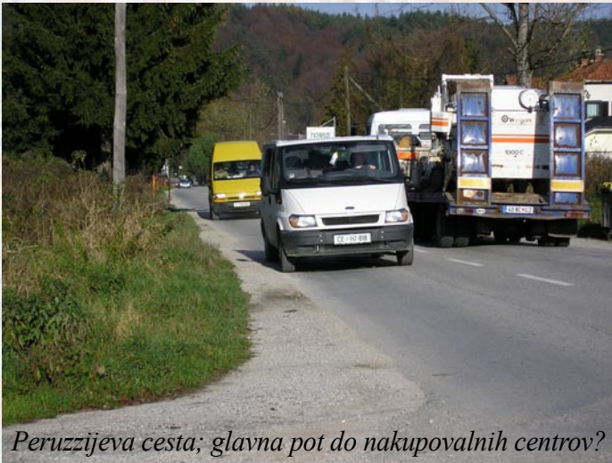
Peruzzijska cesta; glavna pot do nakupovalnih centrov?