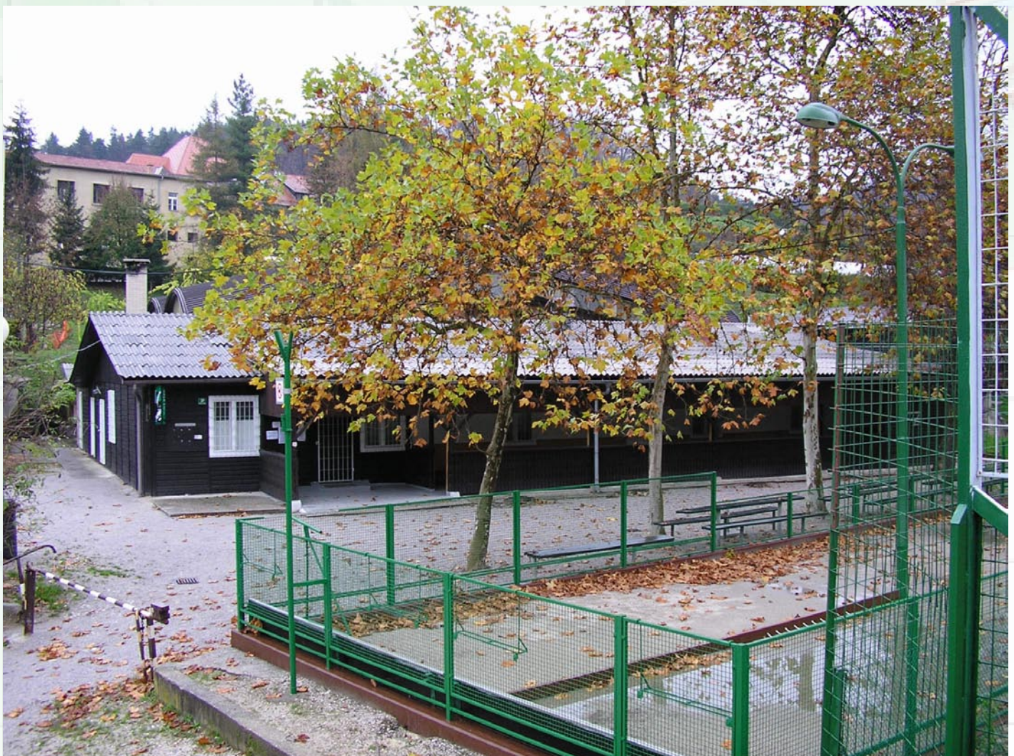
Objekt društva upokojencev, Pot k ribniku 3/a, Ljubljana