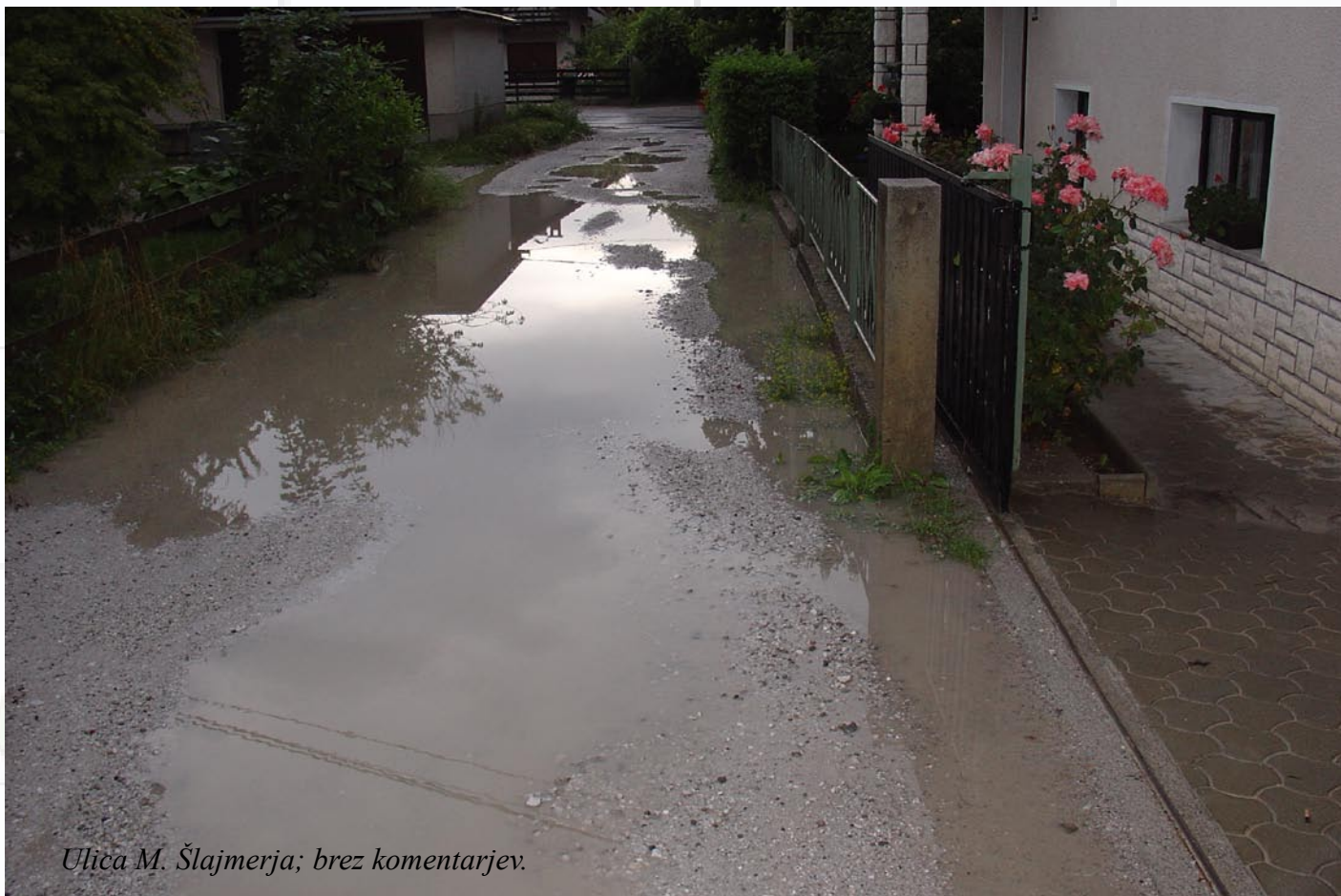
Ulica M. Šlajmerja; brez komentarjev.