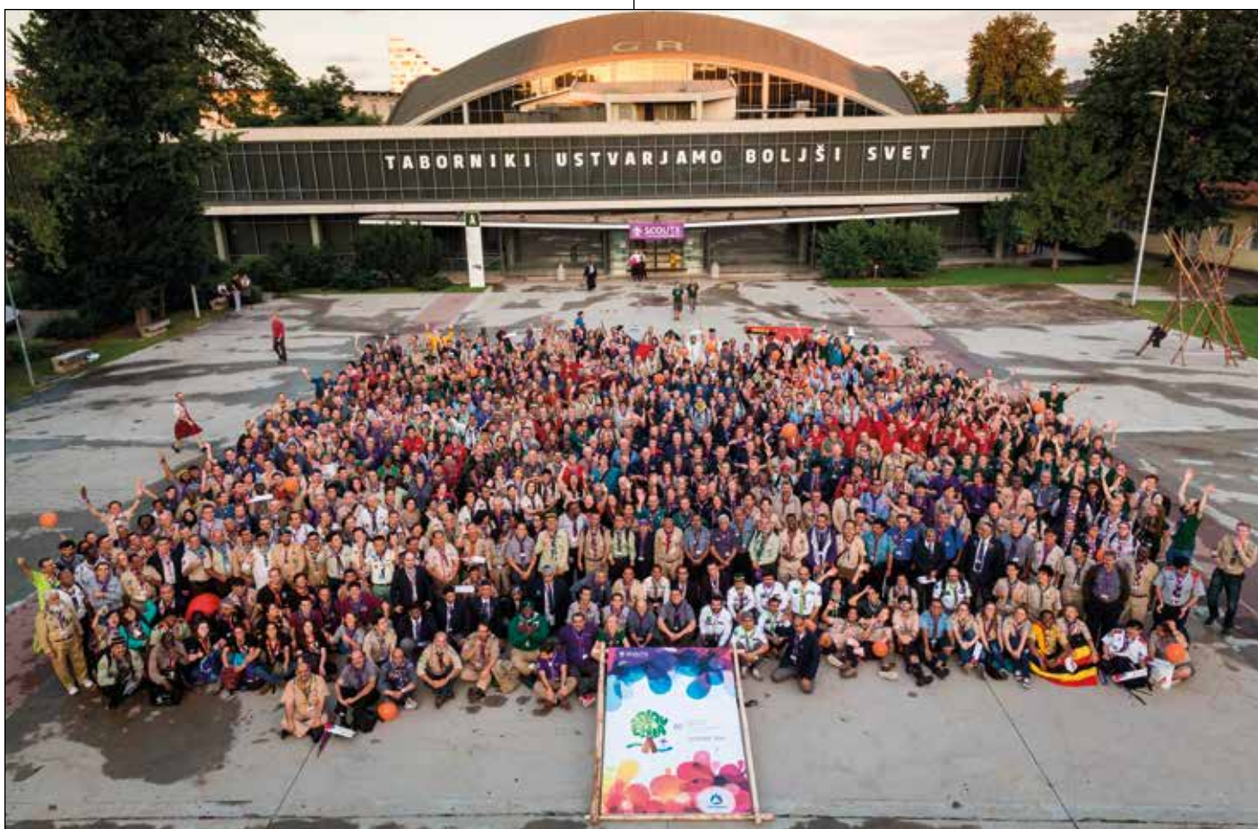
Svetovna skavtska konferenca

T aborniški rod Podkovani krap, katerega ime izhaja iz več pripovedk, v katerem delamo mladi za mlade in kjer si v čast štejeemo, ko nas pohvalijo. Ja, to je naš rod in v letošnjem letu praznujemo 40. obletnico delovanja.