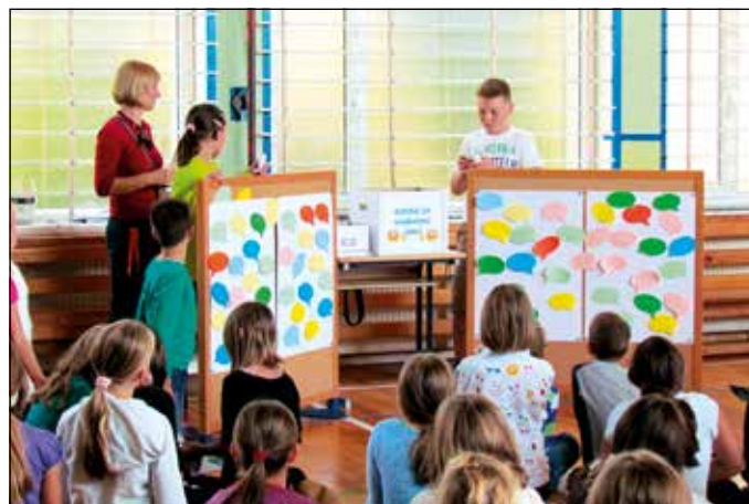
Nestrpno pričakovanje med nagradnim žrebanjem

»Da če pridemo v tujino, da znamo tisti jezik.« (Domen, 5.a)