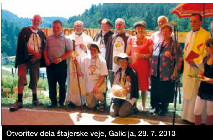
Otvoritev dela štajerske veje, Galicija, 28. 7. 2013