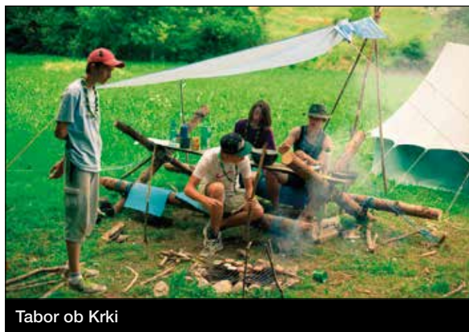
Tabor ob Krki