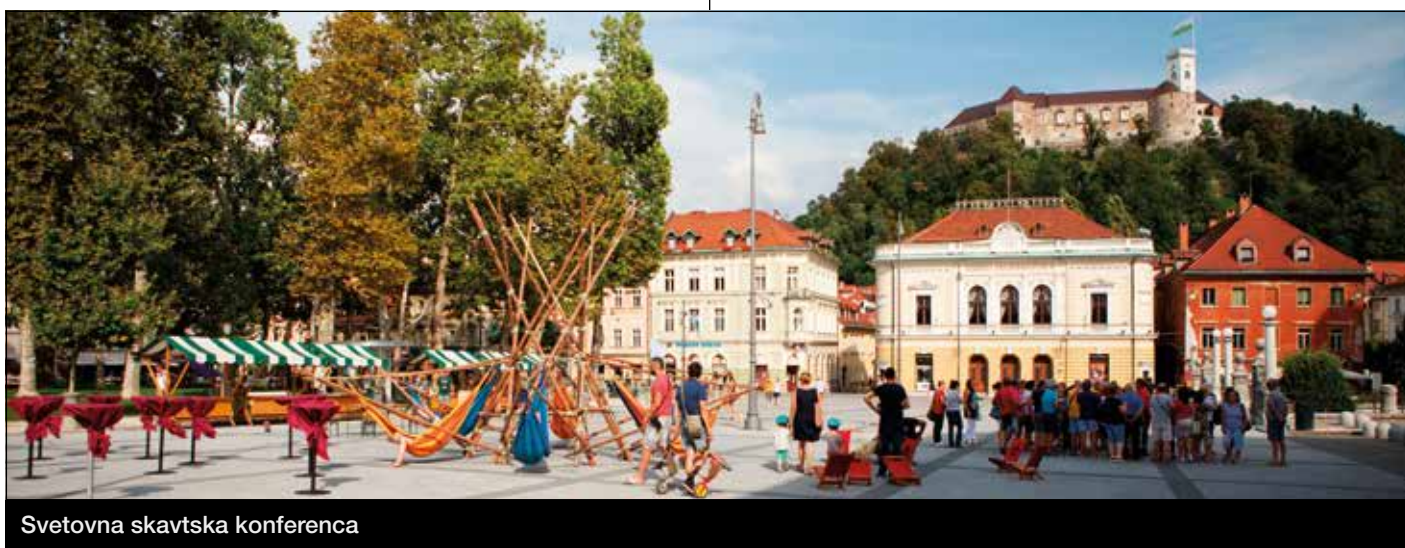
Svetovna skavtska konferenca

tabornikov Slovenije je na Gospodarskem razstavišču pet dni gostila Svetovno skavtsko konferenco, ki je najvišji organ odločanja v Svetovni organizaciji skavtskega gibanja (WOSM), katere člani smo tudi slovenski taborniki.