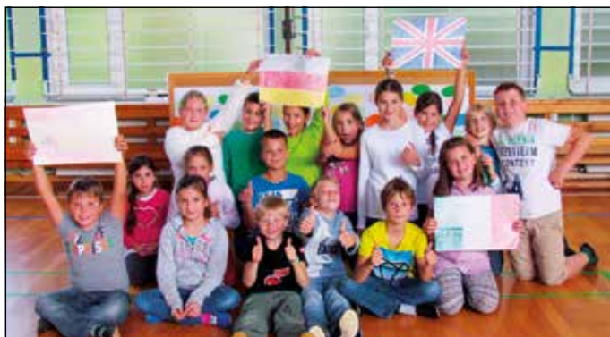
Učitelji tujih jezikov za en dan

Že večkrat smo slišali, da je učenje tujih jezikov izredno pomembno. Poleg tega ni dovolj, da znamo le angleško, dobro je, da znamo tudi nemško in tako naprej. Zato smo se na razredni stopnji OŠ Oskarja Kovačiča ob Evropskem dnevu jezikov odločili, da razširimo svoje jezikovno znanje.