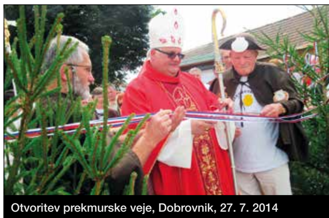
Otvoritev prekmurske veje, Dobrovnik, 27. 7. 2014