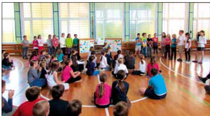
Mojster Jaka v 5-ih jezikih