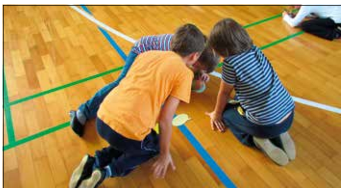
Komentarji mladih mislecev

Učenci 10. skupine podaljšanega bivanja, ki jo sestavljajo učenci 4.a in 5.a razreda, so se naučili tujih besed v angleščini, nemščini, italijanščini in španščini. Poleg besede »Živijo!« so se naučili še štiri živali, ki živijo na nam bližnjem Ljubljanskem barju – ptič, vidra, želva in žaba. Na dan prireditve pa so se učenci prelevili v učitelje in so ostale učence 4. in 5. razredov naučili besed, ki so se jih predhodno naučili sami. Povabljenici so se premikali od jezikovne postaje do naslednje jezikovne postaje in spoznavali nove besede v tujih jezikih.