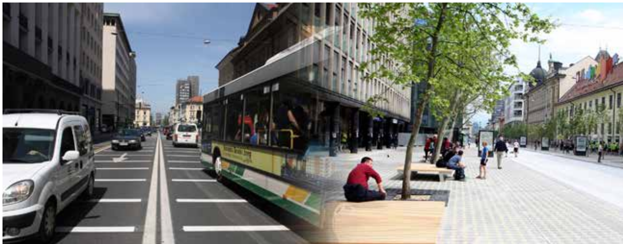
Slovenska cesta nekoč in danes.