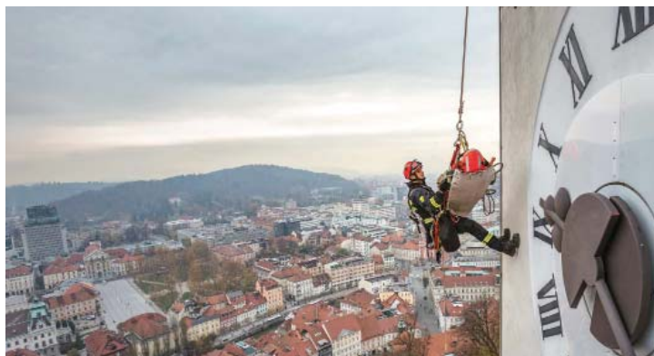
Reševanje z višin

Pristojnosti gasilske službe že dlje časa niso omejene zgolj na gašenje požarov, ampak tudi na reševanje iz ruševin, zemeljskih in snežnih plazov, reševanje ob poplavah in drugih vremenskih ujmah ter ekoloških in drugih nesrečah na rekah in jezerih, reševanje ob prometnih nesrečah, reševanje na vodi in iz vode, izvajanje radiološke,