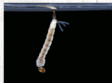
Ličinka tigrastega komarja v vodi.