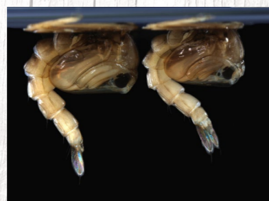
Bubi tigrastega komarja v vodi.