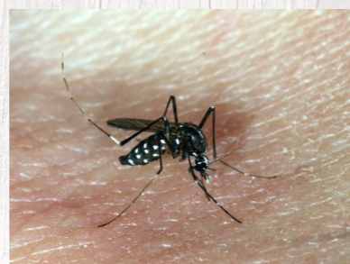
Tigrasti komar je žuželka s popolno preobrazbo (jajčece, ličinka, buba, odrasli), ki za svoj razvoj potrebuje vodo.