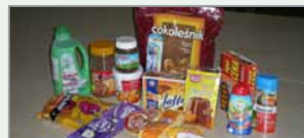
Paket pomoči za otroke

• Ob koncu leta smo za pripravili 30 paketov pomoči za socialno ogrožene učence in 36 manjših paketov pomoči za upokojence. Razdelili smo jih v sodelovanju z osnovnimi šolami in društvi upokojencev z območja naše četrtne skupnosti.