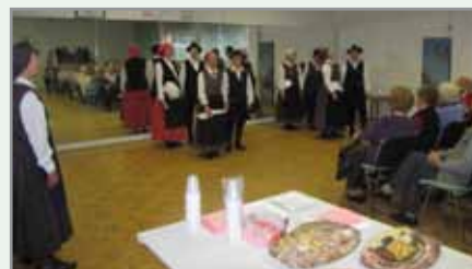
S prireditve za upokojence (26. november 2012)

• Ob koncu leta smo za pripravili 30 paketov pomoči za socialno ogrožene učence in 36 manjših paketov pomoči za upokojence. Razdelili smo jih v sodelovanju z osnovnimi šolami in društvi upokojencev z območja naše četrtne skupnosti.