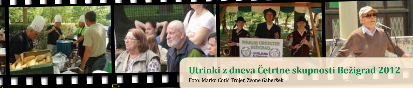
Utrinki z dneva Četrtna skupnosti Bežigrad 2012