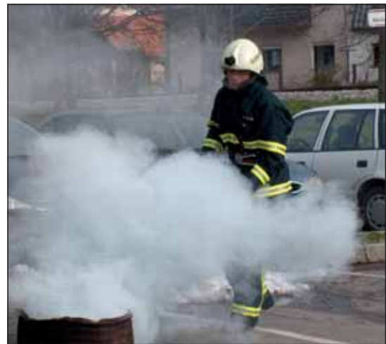
Kako se kadi!!!

V skladu z Zakonom o varstvu pred naravnimi in drugimi nesrečami (Ur. l. RS št. 51/2006) smo v vrtcu Galjevica izvedli vajo »umik iz vrtca v primeru potresa«. Vajo smo izvedli v mesecu marcu v enoti Orlova in na lokaciji Pot k Ribniku 20 ter aprilu v enoti Galjevica in na lokaciji Dolenjska cesta 52.