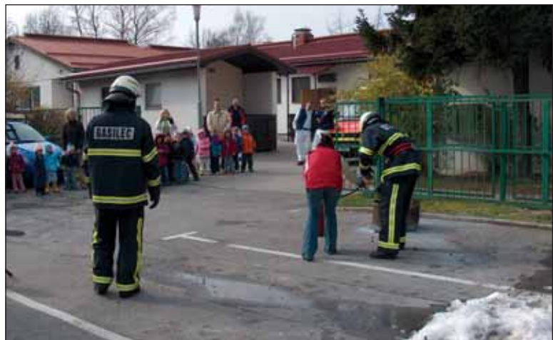
Vzgojiteljica na gasilskem testu.

Bistvo vaje je pripraviti in usposobiti vse zaposlene za pravilno ravnanje v primeru naravne ali druge nesreče, ker le tako lahko zaščitimo otroke, ki so nam zaupani. Umik iz objekta smo popestrili z bogatim spremljevalnim programom, ki smo ga pripravili v sodelovanju z Upravo za zaščito in reševanje RS – Izpostava Ljubljana, Oddelkom za zaščito, reševanje in civilno obrambo MOL, Enoto reševalnih psov MOL, Policijsko postajo Vič s konjenico in psom, Reševalno postajo KC ter Prostovoljnim gasilskim društvom Ljubljana-Barje.