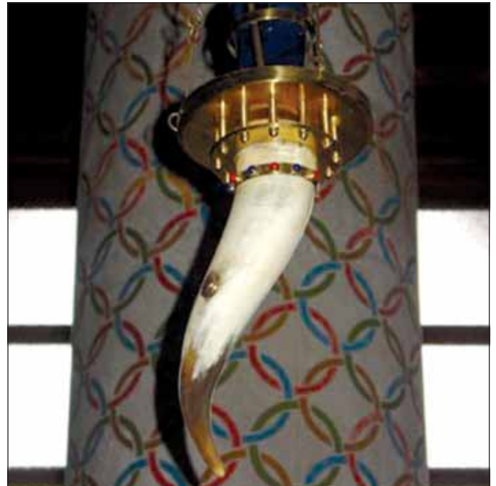
Detajl iz notranjosti cerkve Sv. Mihaela.

trga in cerkve svetega Jakoba. Plečnikovo delo je park pred cerkvi-jo s spomenikom in stopnišče pri cerkvi svetega Florjana. Za peš romarje se je spodobilo, da smo se povzpeli še na grad in se na Šancah tudi srečali s Plečnikovo mojstrovino.