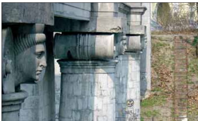
Detajl z zapornic na Ambroževem trgu.