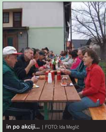
in po akciji...

Uredništvo portala www.barje.net je dne 31. marca 2007 prevzelo vlogo povezovalca vseh čistilnih akcij organiziranih na območju Ljubljanskega barja (oz. v občinah: MOL, Borovnica, Brezovica, Vrhnika, Škofljica, Ig, Log-Dragomer), z atraktivnim zaključkom akcije v obliki brezplačnega rock koncerta.