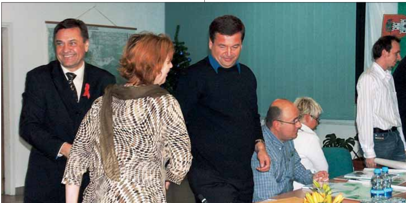
Župan na 1. seji Sveta ČS Rudnik v decembru 2006.

Ustanovitev Krajinskega parka Ljubljansko barje vsekakor podpiram, pred kratkim je bil sporazum o ustanovitvi končno podpisan. Del Krajinskega parka Ljubljansko barje, ki leži na območju MOL, bomo zavarovali že z ustrežno ureditvijo v novem prostorskem redu MOL, ki je v pripravi. Vse črne gradnje pa bo potrebno porušiti.