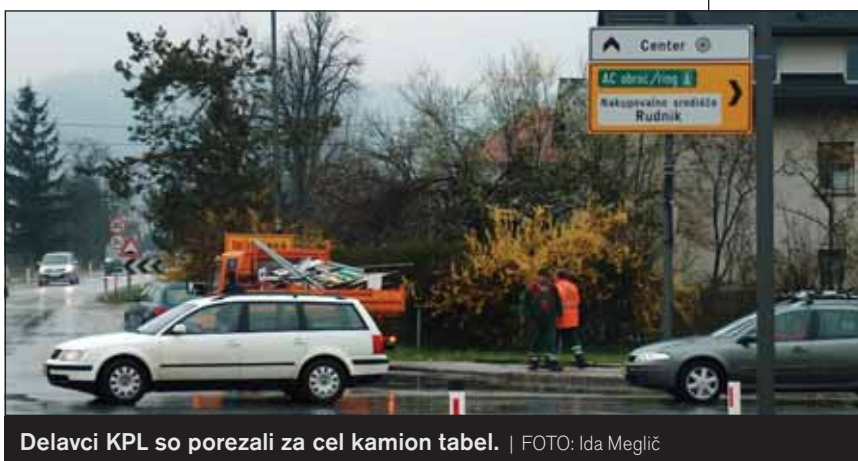
Delavci KPL so porezali za cel kamion tabel.

V petek 30. marca smo lahko bili priča »spomladanskemu čiščenju« množice oglasovalnih tabel v okolici izvoza iz AC na Rudniku.