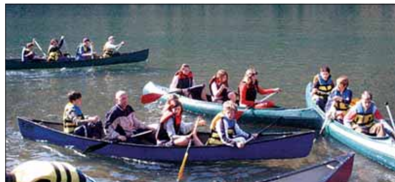
Aktivnosti na vodi.

Zbudili so nas že zgodaj zjutraj in nas napotili na jutranjo telovadbo. Po zajtrku smo se razdelili v skupine in začeli z dejavnostmi. Pri plezanju, lokostrelstvu in orientaciji smo se zelo zabavali. Popoldan smo šli kolesarit. Pot nas je vodila čez hribe in doline, vse do slovensko-hrvaške meje. Bolele so nas noge in roke, zato smo z veseljem izkoristili prosti čas za počitek. Zvečer smo se igrali različne miselne igre in spoznali Newtona, črno-belo kraljevo kačo. Bil je star šele dve leti in dolg komaj dobrih 40 cm. Prav vsi smo ga držali v rokah, nekateri pa tudi za vratom. Polni vtisov smo šli spat.