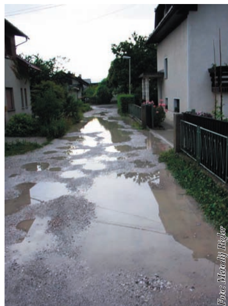
Na sliki: ul. Marka Šlajmerja

Predlagamo podaljšanje proge LPP oz. v dogovoru z Občino Brezovica najti primerno rešitev, saj je Črnovaška cesta povezovalna cesta med obema občinama in je močno obremenjena z vozili t.i. dnevnih migrantov. Predvidevamo, da bi število vozil z uvedbo proge skozi Črno vas zmanjšalo, poleg tega bi taka rešitev razbremenila tudi parkirišča v centru Ljubljane.