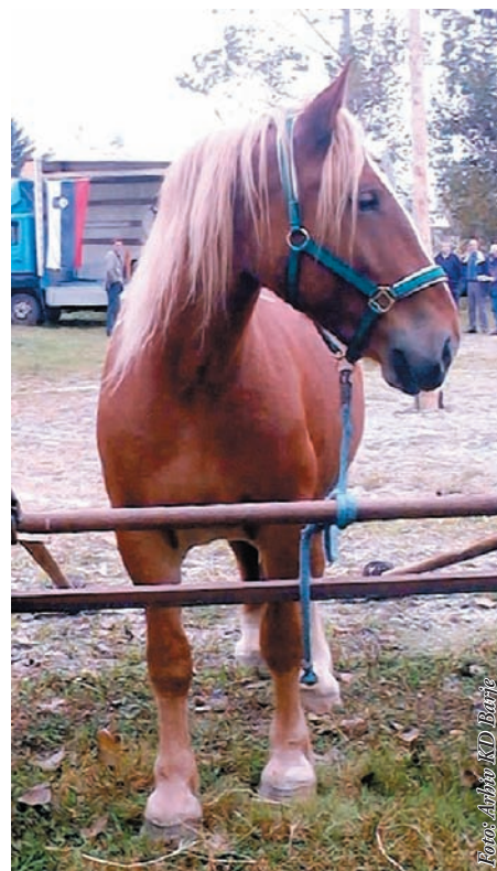
Na sliki z razstave 2004: Plemenska kobila SHL pasme

Tudi v letošnjem letu pripravljamo večjo razstavo konj. Tokrat bomo prireditev pripravili v Podpeči in sicer v nedeljo 14. maja 2006 . Poleg