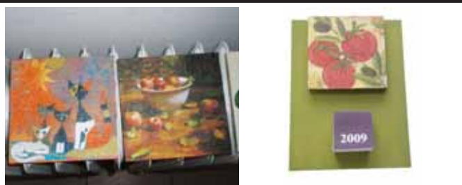
Slike in koledarji