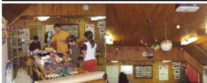
V PGD Barje