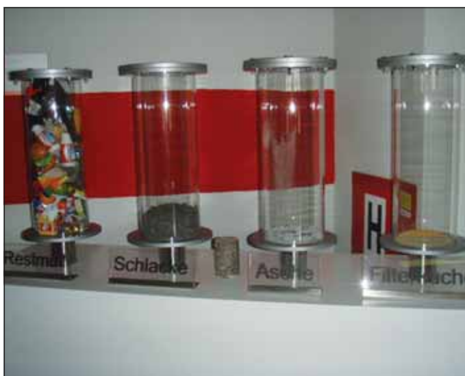
Najprej imajo smeti, nato dobijo žlindro, pepel in filtrirno pogačo

Dnevno v sežigalnico pripelje 250 tovornjakov, ki poberejo smeti po mestu. Vsak tovornjak pripelje 1 tono odpadkov (treba je poudariti, da z ozaveščanjem ločevanja odpadkov pričenjajo že pri otrocih in sicer že precej let, zato je ozaveščenost ločevanja odpadkov pri Dunajčanih velika), kar pomeni, da v eni uri pripeljejo do 18 ton odpadkov, kotel za sežiganje pa