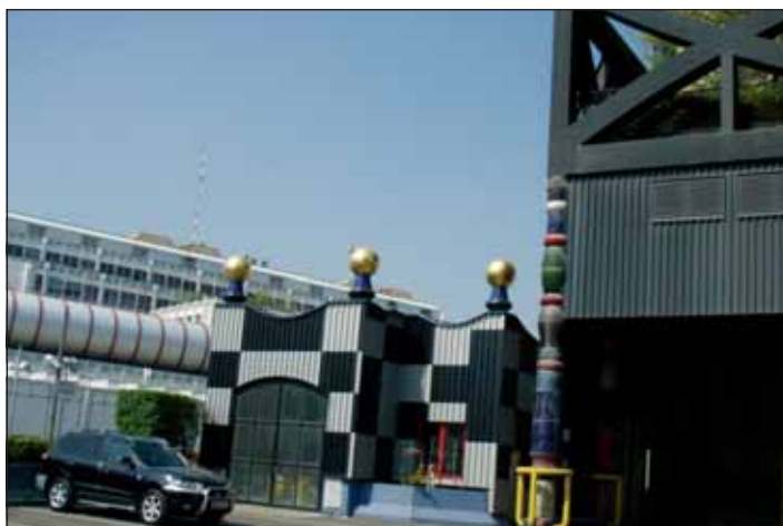
Ob vhodu, kjer kamioni vozijo smeti