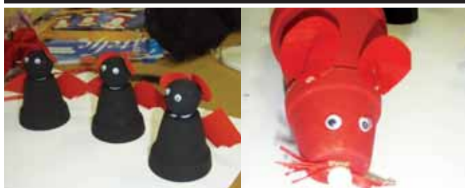
Keramični lončki dobijo novo podobo