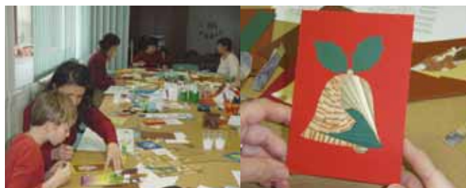
Ob izdelavi čestitke je vedno nered na mizi