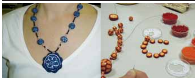
Delavnica izdelave nakita

Od jeseni do pomladi so v Četrtni skupnost Rudnik zopet potekale brezplačne ustvarjalne delavnice. Ob sobotah dopoldne smo izvedli sedem delavnic. Izdelovali smo adventne koledarje, čestitke, okraske, škatlice, obdelovali smo keramične lončke, izdelali slike iz lesa in končali z velikonočno delavnico. Pred novim letom smo imeli tudi drugo »gostujočo« delavnico in sicer smo le-to organizirali v PGD Ljubljana-Barje. Dekleta in fantje (slednji so bili zelo zagnani) so izdelali lastne okraske in nato okrasili svoj prostor. S tistimi dekletki, ki so imele čas nekaj popoldnevov med tednom, pa smo se naučili