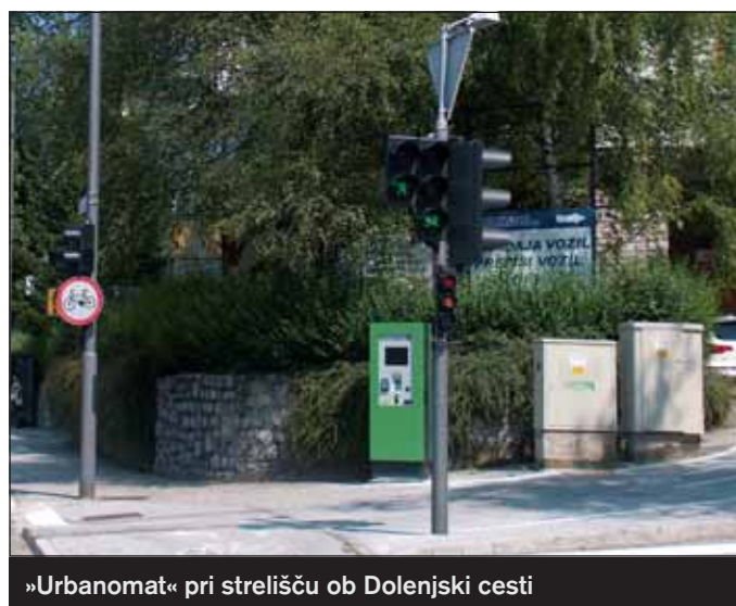
»Urbanomat« pri strelišču ob Dolenjski cesti