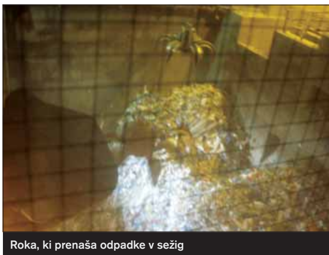
Roka, ki prenaša odpadke v sežig

gori neprekinjeno, 24 ur. Temperatura pri sežiganju je 850 – 1000°C. Zaradi visoke temperature nastaja malo strupenih snovi. Samo odpadki imajo kalorično vrednost med lesom in rjavim premogom.