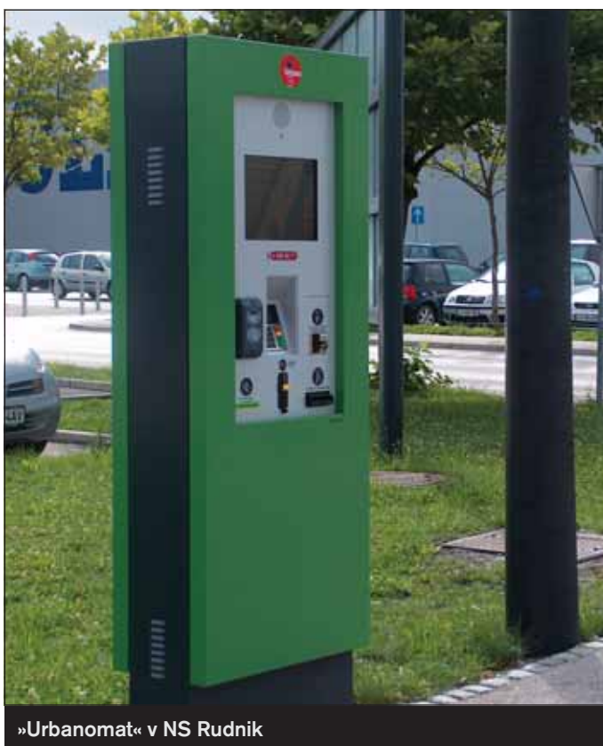
»Urbanomat« v NS Rudnik

Imetnik terminske vozovnice bo prav tako lahko na terminsko kartico naložil določeno vrednost in jo uporabljal tudi za plačevanje drugih storitev, ki so vključene v enotno mestno kartico Urbana.