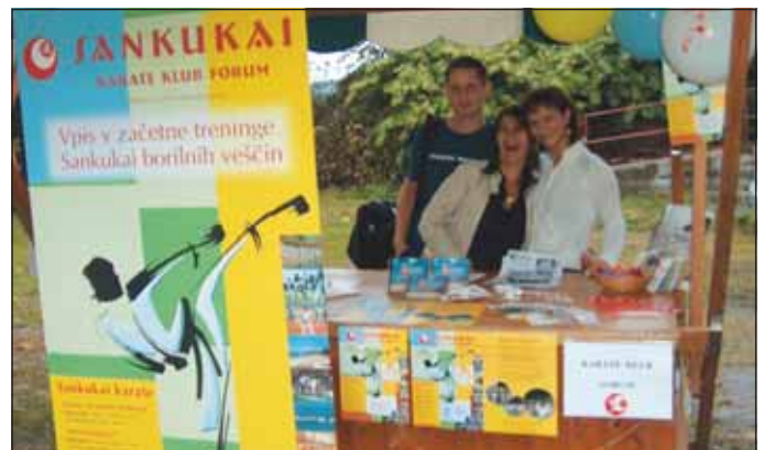
Karate klub Forum