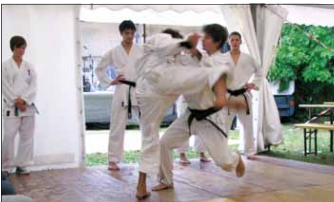
Karate klub Forum je navdušil udeležence s svojim nastopom