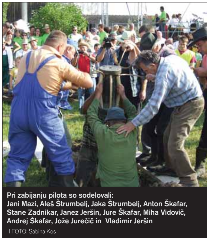
Pri zabijanju pilota so sodelovali: