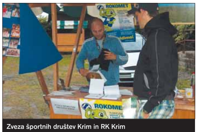
Zveza športnih društev Krim in RK Krim