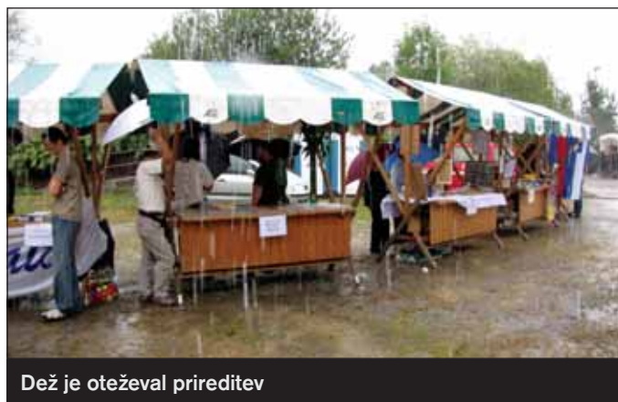
Dež je oteževal prireditve