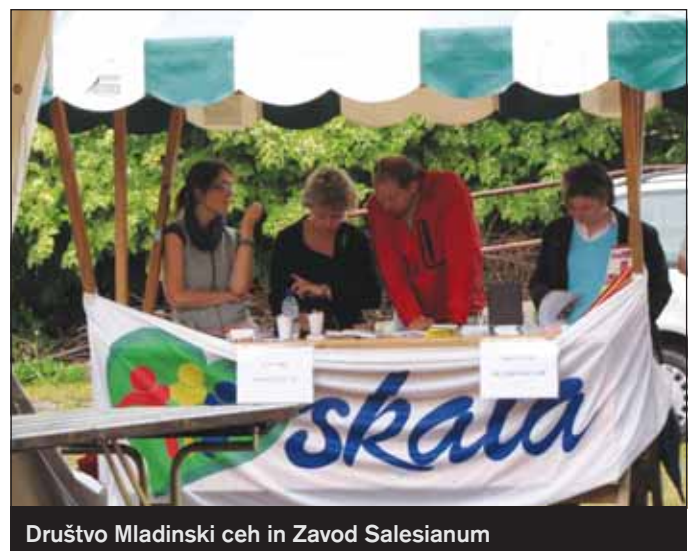
Društvo Mladinski ceh in Zavod Salesianum