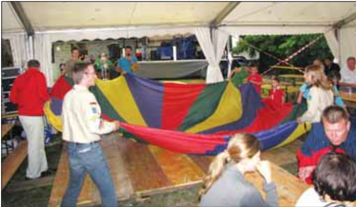
Igra Mladinski ceh