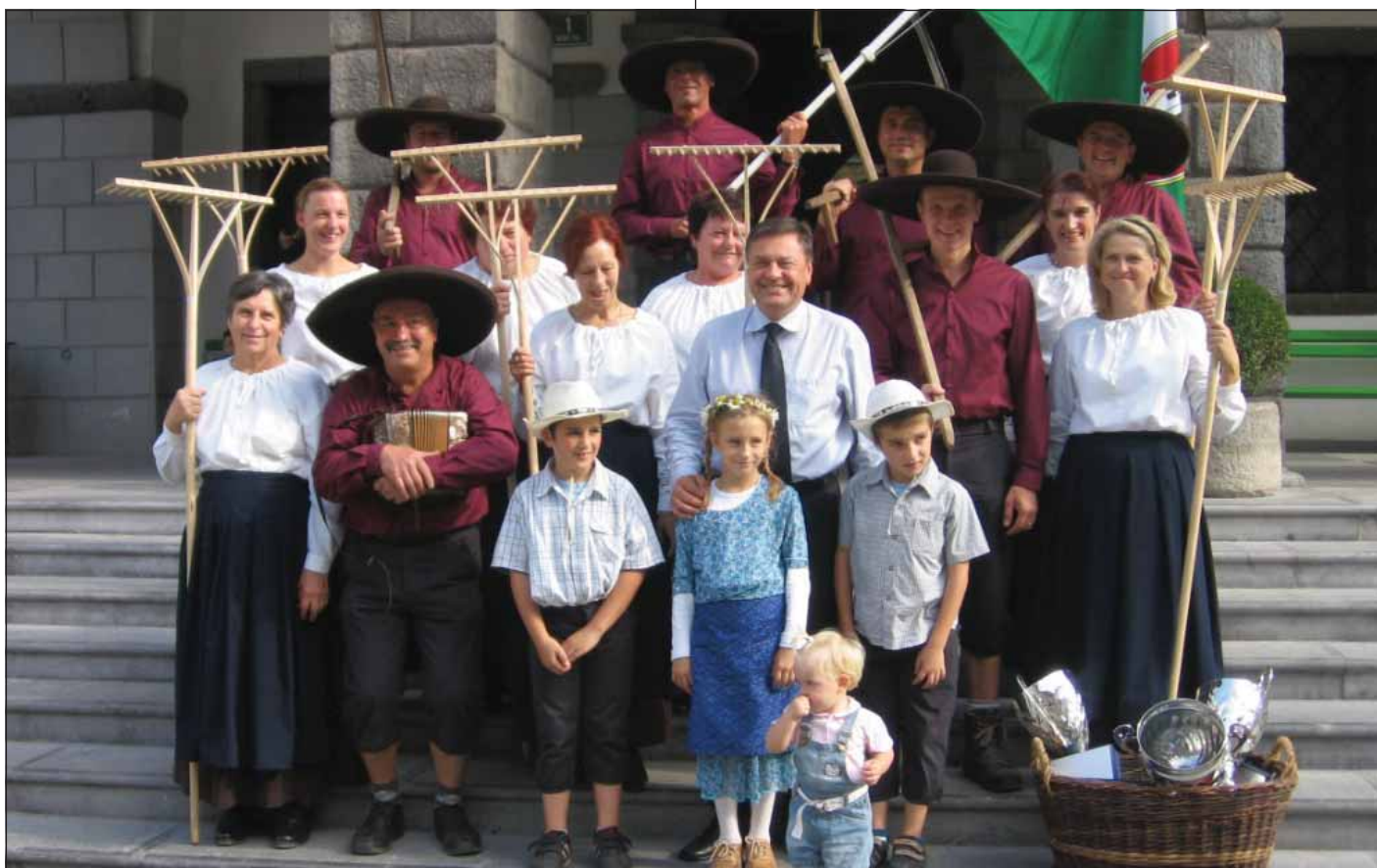
EKIPA KOSCEV IN GRABLJIC MOL 2009 - sprejem pri županu dne 25.9.2009

MESTNA OBČINA LJUBLJANA IN ZAVOD ZA OHRANJANJE NARAVNE IN KULTURNE DEDIŠČINE LJUBLJANSKEGA BARJA STA DNE 12.09.2009 ORGANIZIRALA KULTURNO-ETNOLOŠKO PRIREDITEV »BARJE 2009«, NA KATERI JE SODELOVALO SEDEM »BARJANSKIH« OBČIN S 380. AKTIVNIMI UDELEŽENCI.