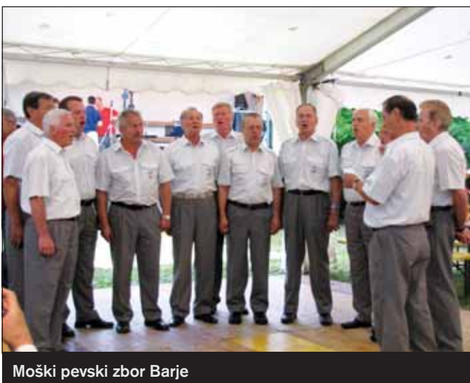
Moški pevski zbor Barje

V pričakovanju, da nas bo drugo leto pričakalo lepše vreme – Nasvidenje na Srečanju krajanov 2010!