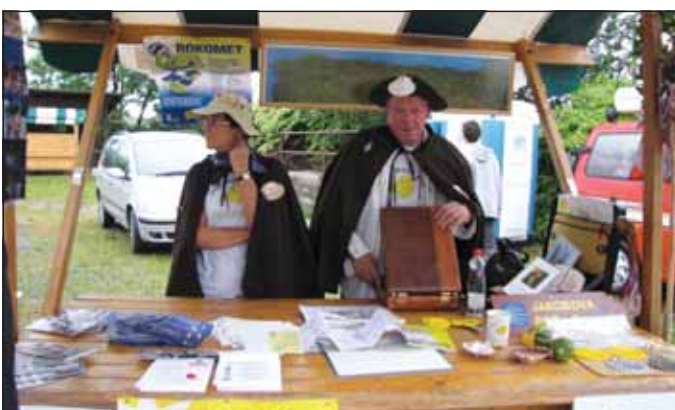
Društvo prijateljev poti sv. Jakoba