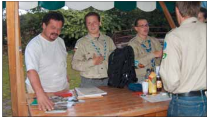
Konjeniško društvo Santos in Društvo tabornikov Rod podkovani krap