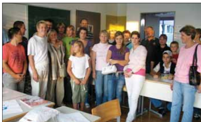
In še vsi skupaj ob zaključku