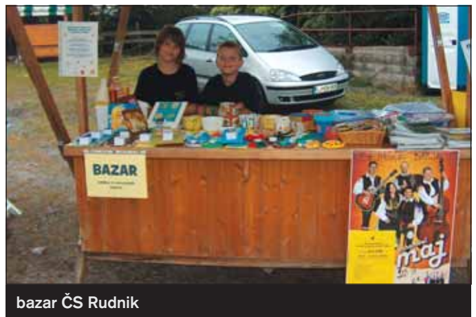
bazar ČS Rudnik