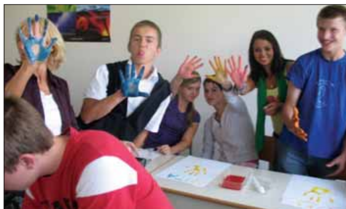
Ustvarili smo zanimive plakate in se povezali med seboj