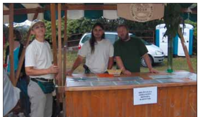
Društvo za ohranitev biotopa Rakovnik