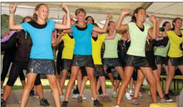
Plesni klub Mojca