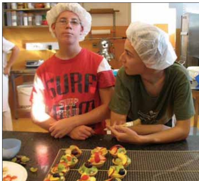
Ponosni na svoje izdelke

Z delavnico »Ko roke ustvarjajo« smo skupaj in vsak posebej nekaj pridobili. Dijaki novinci so bolje spoznali šolo in profesorje ter ustvarili nova prijateljstva. Dijaki »učenci« in dijaki »učiteljci« so imeli priložnost, da se izkažejo drug pred drugim, pred profesorji in starši. In profesorji smo zgradili trdnější odnos z dijaki, ki so zdaj bolj motivirani na šolsko delo in pri pouku z veseljem sodelujejo. Ni bilo pomembno ali se šolaš za pomočnika, veterinarskega tehnika ali pa gimnazijca.