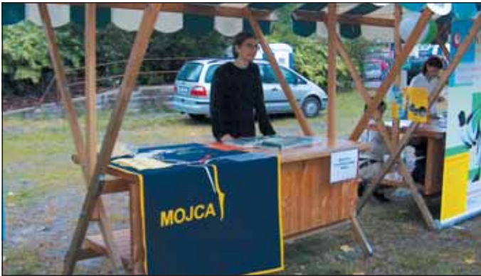
Društvo za Ljubljansko barje