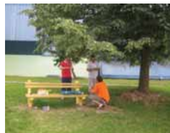
... in po ureditvi.

D vorišče soseske ob Dolenjski cesti na Rakovniku je poleti dobilo povsem novo podobo: stara, dotrajana in deloma že nevarna igrala so zamenjala nova, ki so močno navdušila okoliške malčke, iz sosesčine pa privabljajo tudi druge otroke, da se ustavijo in poigrajo na dvorišču.