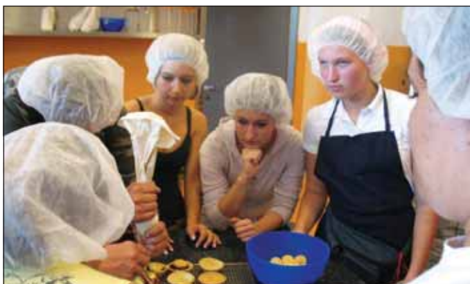
Dijaki so zbrano sledili navodilom, ki so jih posredovale starejše dijakinje

Z MAVRICO V ROKI – PROJEKT NAMENJEN VKLJUČEVANJU DIJAKOV S POSEBNIMI POTREBAMI NA BIOTEHNIŠKEM IZOBRAŽEVALNEM CENTRU LJUBLJANA