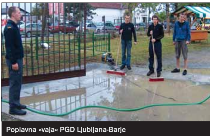
Poplavna »vaja« PGD Ljubljana-Barje