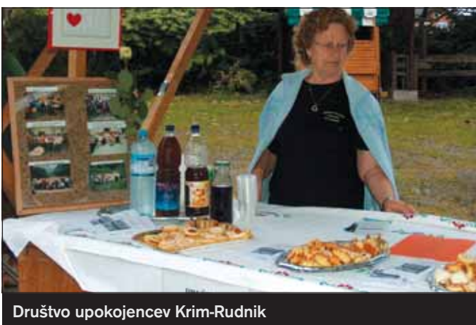
Društvo upokojencev Krim-Rudnik