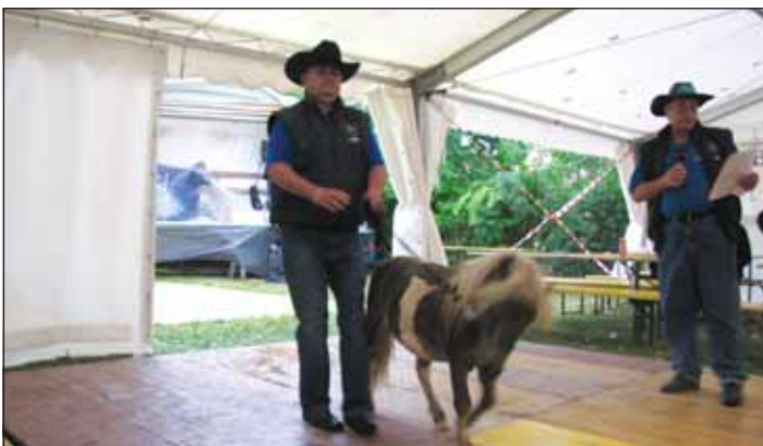
Konjerejsko društvo Barje