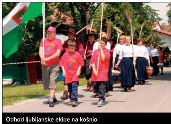
Odhod ljubljanske ekipe na košnjo

Prireditev je potekala skoraj skozi celi dan tako, da so organizirane skupine in posamezniki (mnogi so v nadaljevanju, v organizaciji TD Krim, spremljali še nastop harmonikarjev) zapuščali prizorišče šele v poznih večernih urah.