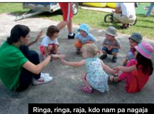
Ringa, ringa, raja, kdo nam pa nagaja