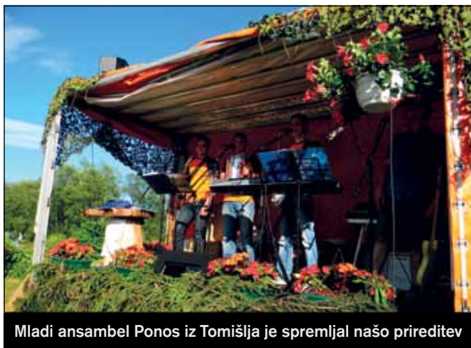
Mladi ansambel Ponos iz Tomišlja je spremljal našo prireditev

Prav tako pa se zahvaljujem tudi vsem ostalim, ki ste nas moralno podpirali.