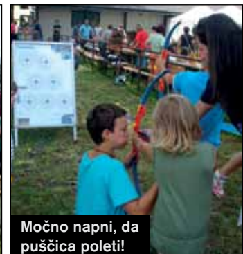
Močno napni, da puščica poleti!