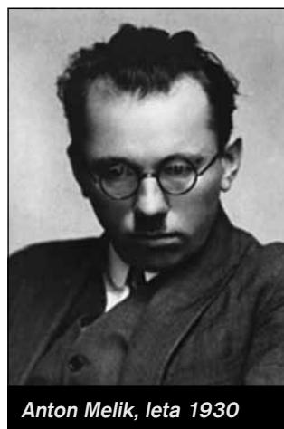
Anton Melik, leta 1930

Kolonizacija Ljubljanskega barja velja za pomembno znanstveno dediščino , saj podaja rezultate antropogenega osuševanja Ljubljanskega barja, potek njegove poselitve ter stanje prebivalstva iz takratnega obdobja. Delo je pomemben prispevek k fizični, družbeni in regionalni geografiji, raziskal pa je tudi izvor prebivalcev Barja ter njihovo življenje. Podrobneje se je ukvarjal z razvojem kmečkega doma na poplavnih in nestabilnih barjanskih tleh. Delo odlikuje nazoren slog pisanja ter fotografsko gradivo, ki izjemno dobro ponazarja takratne razmere. Leta 1927 je bil A. Melik imenovan za docenta na Filozofski fakulteti, leta 1932 je napredoval v izrednega profesorja in leta 1938 v rednega profesorja. Leta 1940 je postal dopisni in leta 1946 redni član Slovenske akademije znanosti in umetnosti, leta 1963 pa ga je Srbska akademija znanosti in umetnosti proglasila za svojega dopisnega člana.