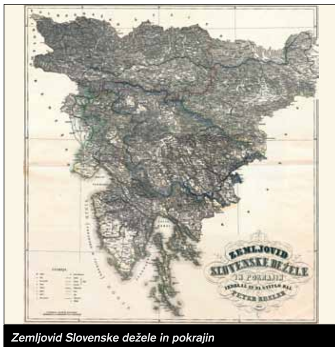
Zemljevid Slovenske dežele in pokrajin