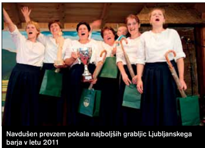
Navdušen prevzem pokala najboljših grabljic Ljubljanskega barja v letu 2011