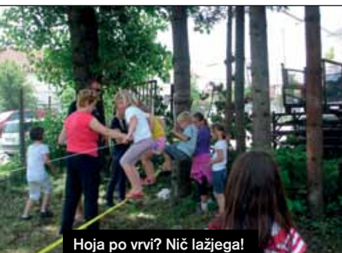
Hoja po vrvi? Nič lažjega!