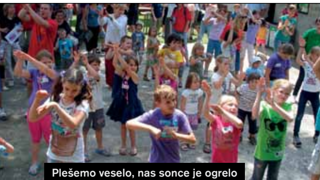
Plešemo veselo, nas sonce je ogrelo

TRADICIONALNA PRIREDITEV ZA OTROKE, KI JO TURISTIČNO DRUŠTVO BARJE PRIPRAVI VSAKO LETO NA SEJMIŠČU NASPROTI ZADRUŽNEGA DOMA, JE BILA LETOS V SOBOTO, 18. JUNIJA. PRIREDITVE SO SE UDELEŽILI ŠTEVILNI OTROCI S STARŠI Z VSEH KONCEV LJUBLJANE IN DRUGIH BARJANSKIH OBČIN. NA PRIREDITEV SO SE LAHKO OBISKOVALCI, OB PREDLOŽITVI VABILA, PRIPELJALI BREZPLAČNO Z AVTOBUSI MESTNEGA PROMETA.