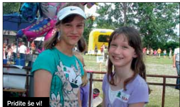
Pridite še vi!

Žabarije so ta dan poskrbele za male in velike žabice. Najmlajši otroci so se družili v pravljичni deželi, kjer so se igrali, risali in poslušali pesmice in pravljice. Večji otroci so se pomerili v spretnostnih igrah, merili na tarče s vodnimi curki skozi prave gasilske cevi, igrali baseball, hodili po vrvi, preskačkali kolebnico, streljali z loki, iskali varno pot v minskem polju, streljali na gol, se pomerili v teku v žakljih, vlekli vrvi, vsi skupaj pa so veselo skakali na trampolinih. Po končanih športnih aktivnostih so nastopili dekleta in fantje iz Plesne šole Brillantina, ki so v ritmu rock'n'rolla dodobra pospešili tako svoj kot tudi naš srčni utrip. Ob koncu druženja so otroci skupaj s starši in animatorji zaplesali na koreografijo, ki je bila pripravljena posebej za ta veseli dan. Ves čas prireditve nas je spremljalo toplo sonce, veselja in zabave je bilo obilo. Da nam ne bi bilo prevroče, smo se lahko sladkali s sladoledi,