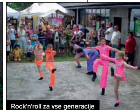
Rock'n'roll za vse generacije