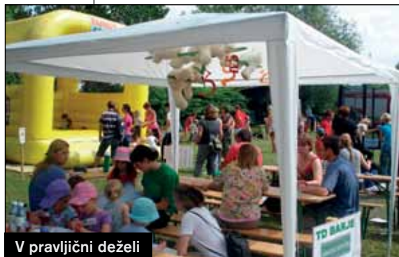
V pravljичni deželi