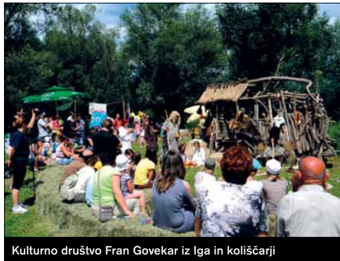
Kulturno društvo Fran Govekar iz Iga in koliščarji

Lani smo se samo zabavali. Letos smo se na učnih delavnicah tudi učili. Videli smo dramsko predstavitev koliščarjev iz Jalnovih Bobrov v izvedbi Kulturnega društva Fran Govekar z Iga, člani Društva za opazovanje ptic Ljubljana so nas podučili o pravilni košnji trave, nas seznanili z redkimi, zaščitnimi pticami na barju, izvedeli smo veliko o Krajinskem parku Barje, si ogledali delo z velikimi in malimi konji, se ustavili v pravcatem taborniškem naselju rodu Podkovani krap in pri njih poizkusili odlično pečen krompir iz žerjavice. Pri prijaznih mentorih smo izdelovali konjiče iz starih nogavic, risali in barvali slovenske zastavice