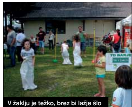
V žaklju je težko, brez bi lažje šlo