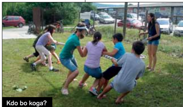
Kdo bo koga?