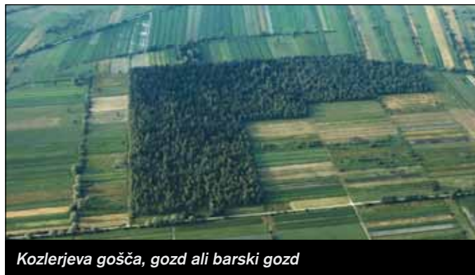
Kozlerjeva gošča, gozd ali barski gozd

Preučil je razširjenost Slovencev v Istri, na Goriškem, Koroškem in Ogrskem ter nato izdal Zemljevid Slovenske dežele in pokrajin (1853). Na njem je vrisal slovensko etnično mejo in jo utemeljil v spremni knjižici Kratek slovenski zemljopis in