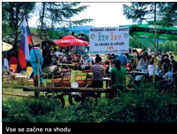
Vse se začne na vhodu

Žal pa so bili med nami tudi posameznik-i, ki so poizkusili vse, tudi »hojo preko otroških teles«, da bi nam prireditev onemogočili. V veselje nas vseh jim to ni uspelo.