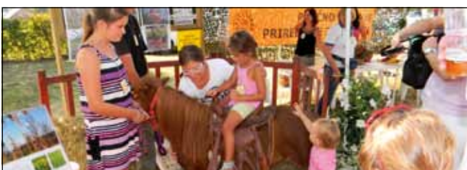
Po slovesu so bili ponovno glavni otroci in njihova zabava.