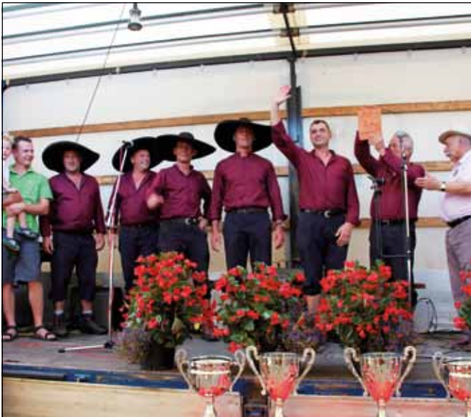
Letošnji podprvaki Ljubljanskega barja v košnji skupinsko.

Trije sodniki so opazovali in ocenjevali kvaliteto in etnološki vtis, medtem ko je sedem merilcev časa s stoparicami merilo porabljen čas. Kombinacija obeh ocen, po Pravilih ocenjevanja, pomeni tudi rezultat uvrstitve na tekmovanju. Vendar rezultata ni možno takoj napovedati, ker je potreben vnos vseh podatkov v računalniški sistem, ki na koncu po posebnem programu določi rezultate tekmovanja.