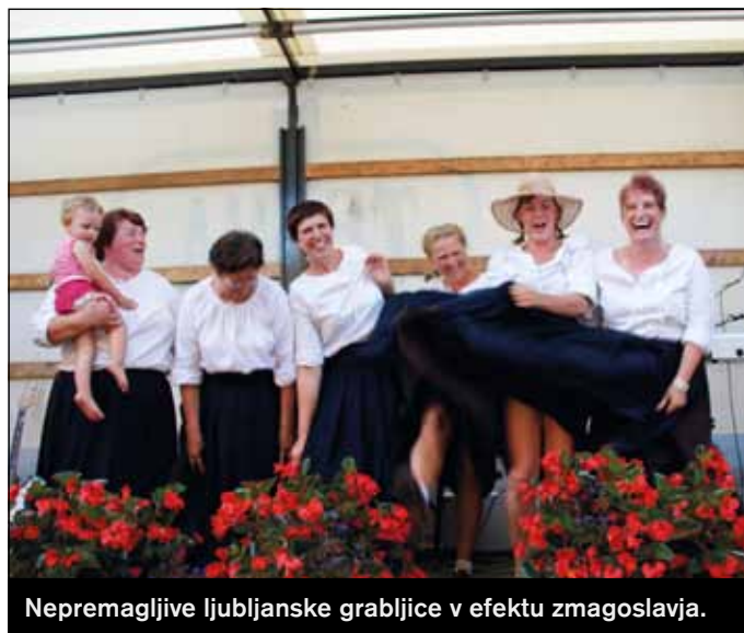
Nepremagljive ljubljanske grabljice v efektu zmagoslavja.

Najprej so nastopili kosci ekipno na parcelah 50x9m 1 ., sledile so grabljice ekipno, ki so morale na pokošenih travniških površinah izdelati 12 ličnih kopij.