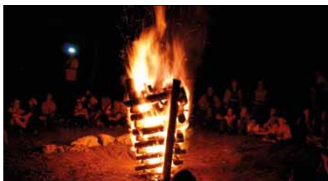
Zaključni ogenj. | FOTO: Rok Pandel