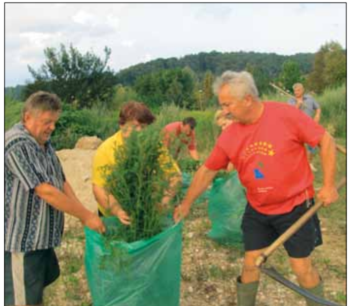
Kosci in grabljice MOL – ČS Rudnik na deponiji ob Galjevcu.

Zavod za ohranjanje naravne in kulturne dediščine Ljubljanskega