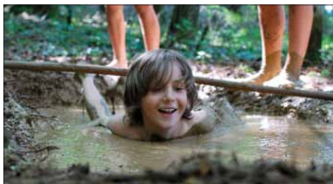
Blatna kopel.