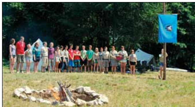
Predhodnica dviguje zastavo.