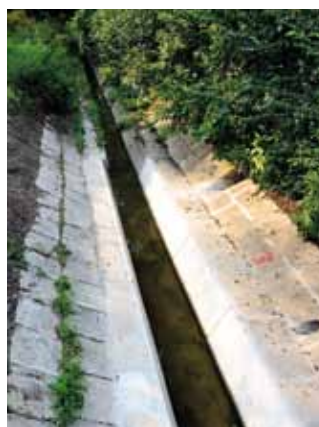
Obnovljen kanal v Galjevcu.