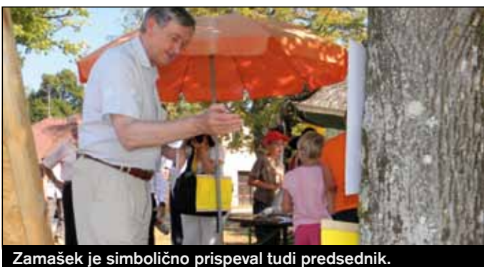
Zamašek je simbolično prispeval tudi predsednik.