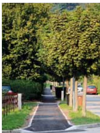
Obnovitev pločnika na Melikovi ulici.