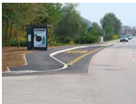
Nova postaja št. 27 na Jurčkovi cesti.