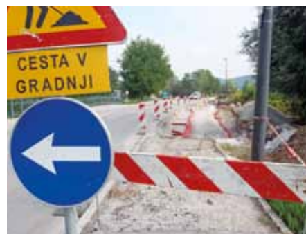
Novo postajališče na Jurčkovi cesti.