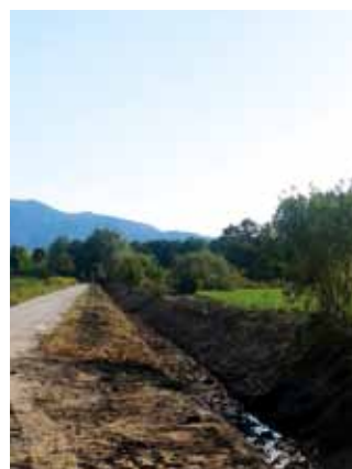
Čiščenje vodotokov - Črna pot.