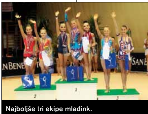
Najboljše tri ekipe mladink.

Odlično so se slovenske ritmičarke odrezale v mlajših kategorijah, kjer so po tradiciji osvajale stopničke. Med mladinkami, ki so letos nastopile v ekipnem tekmovalstvu, je zmagala ekipa