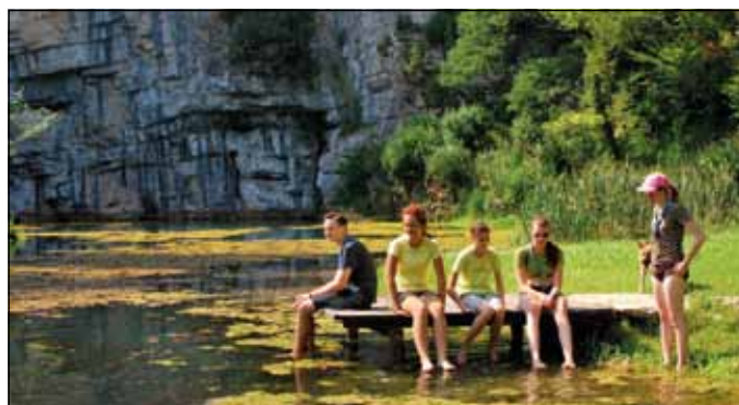
Izvir Krupe.