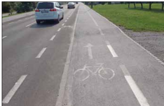
Dvojna kolesarska steza na Peruzzijevi.

Na Župana MOL je bila naslovljena pobuda za postavitve hitrostnih ovir na Peruzzijevi cesti. Pristojni oddelek (OGDG) je odgovoril, da v predvidenih prometnih ureditvah nima načrtovanih ureditev grbin.