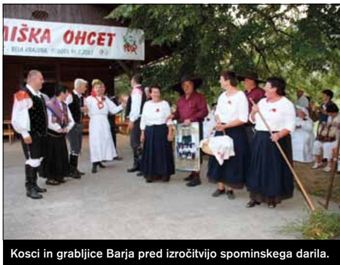
Kosci in grabljice Barja pred izročitvijo spominskega darila.

Pričela se je dolgotrajna priprava na poroko, pa ne z izbiro oblačil, pripravo gostije itd., vse to so organizirali Belokranjci, ampak z osvajanjem pravičnega naglasa v govoru, učenjem novih besed in sprejemanjem belokranjske etnološke kulturne dediščine.