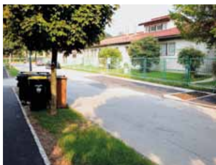
Melikova ulica - urejena parkirna mesta.