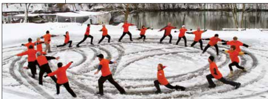
Nekaj utrinkov z letošnje zime po sneženju.