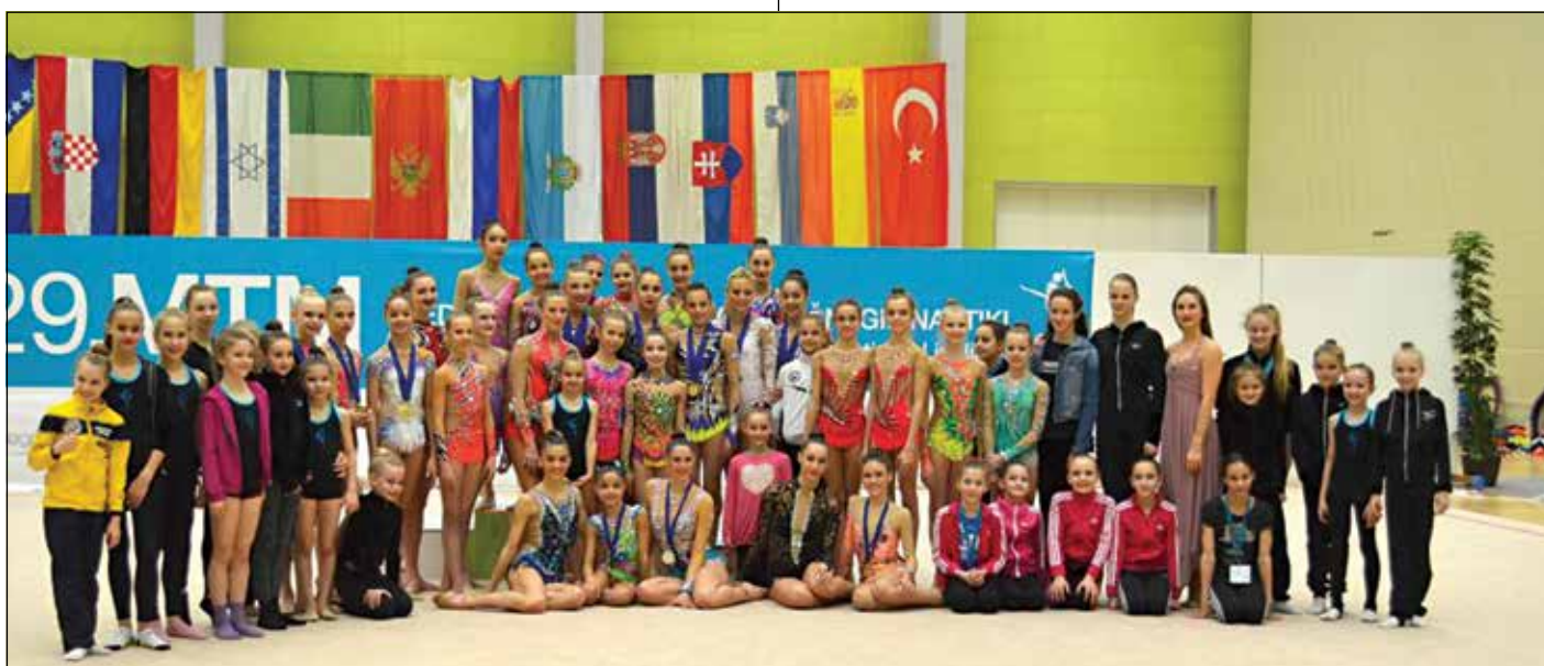
Pozdrav iz 29. MTM

MTM vsako leto gosti najboljše tekmovalke sveta - olimpijske in evropske prvakinje, svetovne prvakinje in podprvakinje. V letu 2016 smo gostili kar šest najboljših ritmičark sveta, udeleženk Olimpijskih iger v Riu, med njimi tudi zmagovalko Olimpijskih iger, Margarito Mamun.