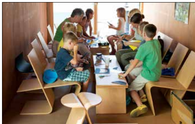
Delavnica na Info točki, ZPE2016.

Občasno organiziramo tudi delavnice, namenjene izključno otrokom. Zagotovo vsako leto na dnevu četrtne skupnosti, letos smo čebelarsko delavnico izpeljali v okviru dogodkov Zelena prestolnica Ljubljana na Info točki pred Magistratom, otroke pa povabimo tudi na tematske delavnice med počitnicami.