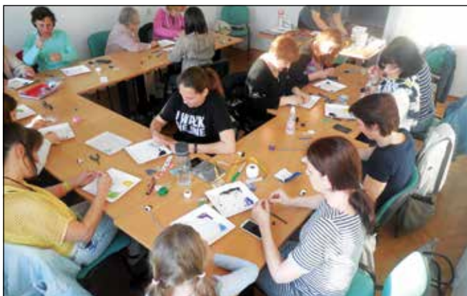
Na delavnici ČS Rudnik. (arhiv društva)