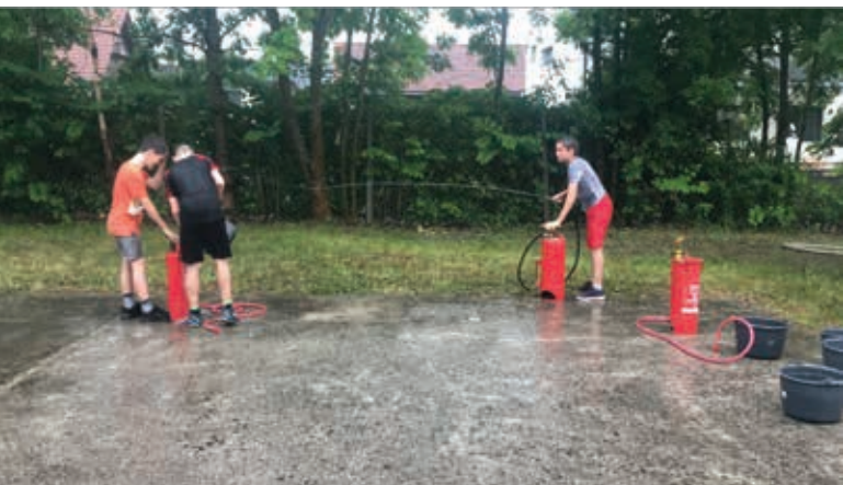
Barjanske žabarije so uspešnica. Pa tudi, če lije dež.

Aktivnosti ČS Rudnik v povezovanju z društvi in zavodi: