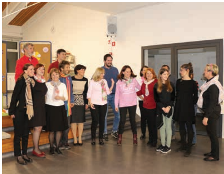
Večer poezije je privabil številne ljubitelje lepe besede.