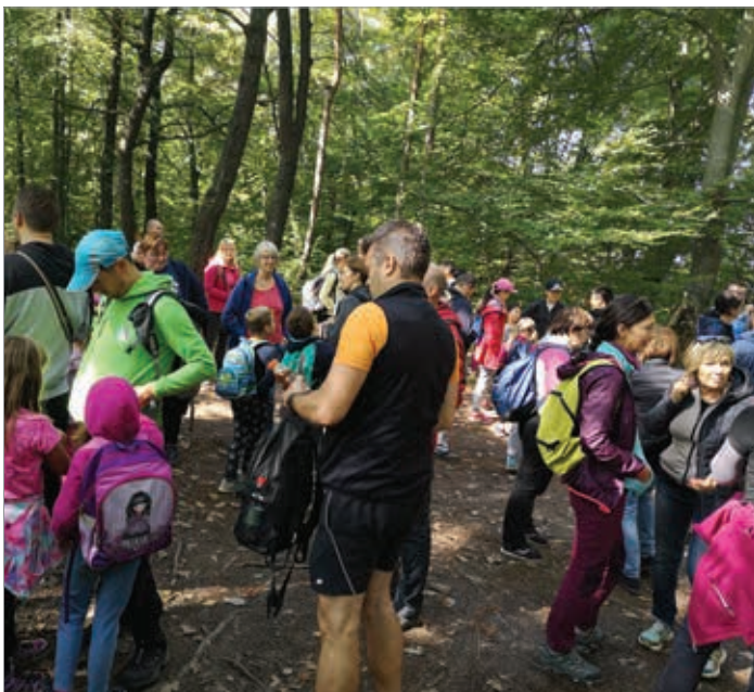
Oskarjev pohod je bil letos izveden drugič. In po poteh Golovca se je letos sprehodilo še več pohodnikov kot lani.

sta že stalnica sodelovanja obeh zavodov in ČS Rudnik. Šola je letos poskrbela za novost, učitelji so nam vsem pripravili Večer poezije , že drugo leto so izvedli Oskarjev pohod , nekaj let pa že organizirajo tudi Smučarski sejem. Ker imamo vsi veliko idej za družabne prireditve obljublamo še kakšno novost.