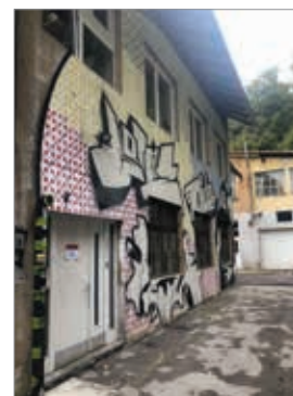
Na teh prostorih ni doma čarovnija. Tu domuje domišljija.

Prostori, ki so jih nekoč zasedali obrati znotraj tovarne, so v večini kar nekaj časa sameva. Le livarna je delovala tam neprekinjeno. Potem pa so celotnem kvartu novo življenje vdahnili talenti z Akademije za likovno umetnost, ki so se naselili glavno poslopije tovarne. Življenje pa se je prebudilo tudi v objektih v okolici, fundus, stortivene dejavnosti, podjetniški duh ... živijo v sožitju v prostorih tovarne, ki je z njihovo energijo vzniknila v novo življenje.