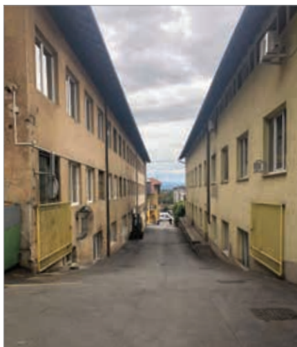
Za portalom se skriva pravi kvart, z več poslopiji, ki jih zdaj naseljujejo različne dejavnosti. Nekoč pa je bilo vse podrejeno enemu naročniku – tekstilni industriji.

Kdo se recimo še spomni, čemu je pripadal tisti opečnati dimnik od Dolenjski cesti, ki se dviga izpod Golovca? Nove generacije namreč ne vedo, da je pripadal tovarni Utenisla, dolgo časa je to ime nosila postaja mestnega potniškega prometa v bližini. V Utensiliji so oskrbovali z izdelki nekoč našo nadvse uspešno tekstilno industrijo. Simbol delavske moči pa je ob spremembi sistema bil med prvimi, ki je zaradi stečaja zaprla svoja vrata.