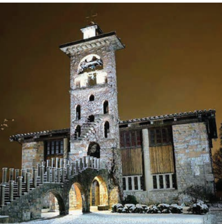
Plečnikova mojstrovina, cerkev sv. Mihaela na Barju

Maruša Penzeš glavna in odgovorna urednica