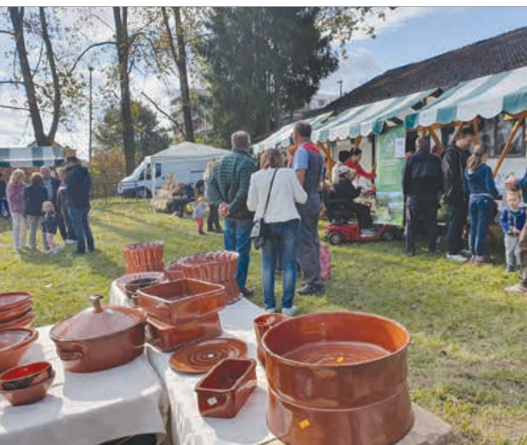
Na Barju, tam, kjer se stikata vas in meso, je gostovala Jesenska tržnica.