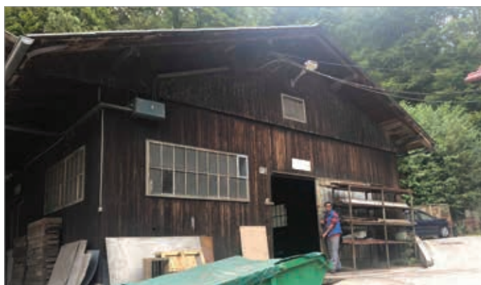
Delo v livarni ni nikoli presahnilo.

Kdo se recimo še spomni, čemu je pripadal tisti opečnati dimnik od Dolenjski cesti, ki se dviga izpod Golovca? Nove generacije namreč ne vedo, da je pripadal tovarni Utenisla, dolgo časa je to ime nosila postaja mestnega potniškega prometa v bližini. V Utensiliji so oskrbovali z izdelki nekoč našo nadvse uspešno tekstilno industrijo. Simbol delavske moči pa je ob spremembi sistema bil med prvimi, ki je zaradi stečaja zaprla svoja vrata.