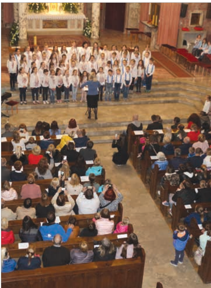
Pojoči otroci iz vrtca, nižje in višje stopnje osnovne šole, pa tudi učitelji, napolnijo cerkev do zadnjega kotička.

sta že stalnica sodelovanja obeh zavodov in ČS Rudnik. Šola je letos poskrbela za novost, učitelji so nam vsem pripravili Večer poezije , že drugo leto so izvedli Oskarjev pohod , nekaj let pa že organizirajo tudi Smučarski sejem. Ker imamo vsi veliko idej za družabne prireditve obljublamo še kakšno novost.