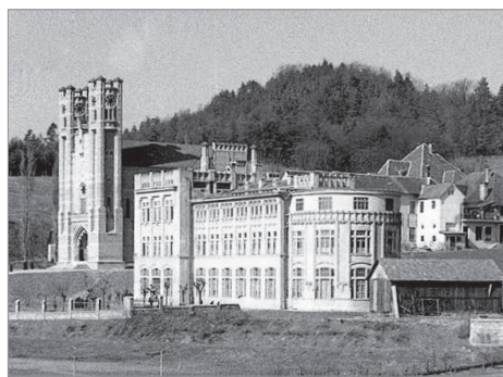
Cerkev Merije Pomočnice, v ozadju viden dvorec Rakovnik, kjer je bila šola. Fotografija posneta leta 1934

Za zgodovino šolstva v naši četrti so pomembna tudi poslopja današnjega Župnijskega urada Rakovnik, kjer deluje tudi Seližianski zavod Rakovnik. Društvo je bilo ustanovljeno leta 1893 in se je konec 19. stoletja povežalo z redovno skupnostjo seleziancev v Italiji. Konec leta 1900 je kupilo graščino Rakovnik, leta 1902 pa so v njej pričeli s poukom. V zavodu je ljudska šola, imeli so tudi gledališko dvorano in se ukvarjali z glasbo. Kasneje je bila v zavodu tudi obrtna šola, z učilnicami in delavnicami. Od leta 1920 so tu delovale mojstrska šola za krojaštvo, strokovna šola za čevljarstvo in šola z mizarje. Ljudska šola je prenehala z delom leta 1924, obrtna pa 1936. V kasnejšem obdobju so bili v tem poslopiju študenti filozofije, in internat. V stavbi je med