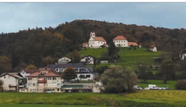
PŠ Rudnik je šola, ki živi v sožitju z Golovcem.

Podružnična šola Rudnik je leta 2018 res praznovala 80 let, a prva oblika pouka na območju Rudnika je potekala že od leta 1868 dalje, v različnih poslopih. Državna mešana osnovna šola Rudnik, današnja podružnična osnovna šola Rudnik je bila odprta jeseni 1938. Poleg pouka in številnih dejavnosti je na šoli potekalo organizirano delo na vrtu in pogozdovanje. Vsak razred je posadil svoje rastline, za njih skrbel in se ob urejanju vrta tudi učil. Šola postane s šolskim letom 1951/52 podružnica matične šole Oskarja Kovačiča. Vse do danes je šola na Rudniku nekaj posebnega, prijazen in prijeten kraj, kamor otroci radi hodijo, saj se v njej počutijo domače.