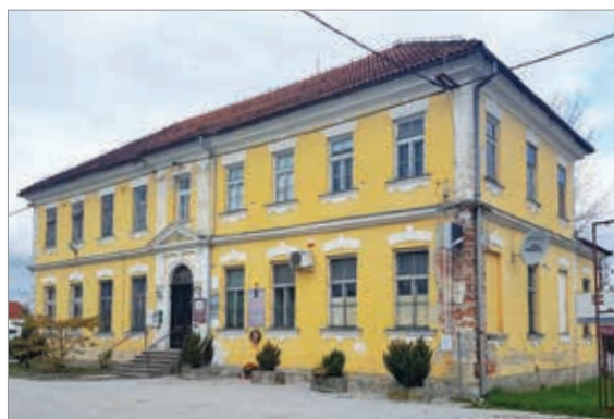
Nekadanja PŠ Barje bo postala nov četrtni center, Center Barje.