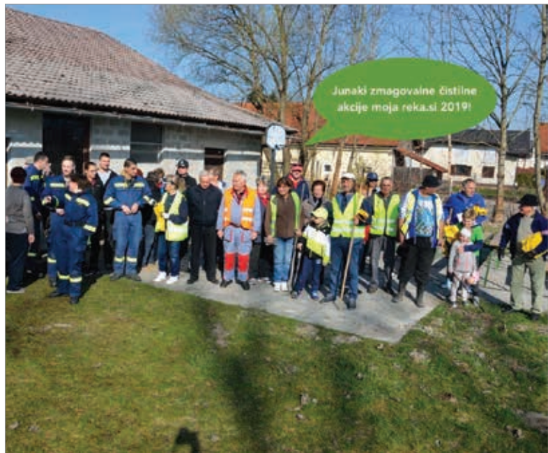
Zmagovalci natečaja mojareka.si.

Med najaktivnejšimi društvi so, že po svoji dejavnosti, športna društva, večino jih lahko najdete v Parku Rudnik (Športna dvorana Krim, Kajak kanu center Livada, Igrišča Krim Rudnik, Strelišče) in drugih športnih objektih in manjših dvoranah in na šoli. Športna društva izvajajo tudi brezplačne programe in delavnice za sodelujoče, več o tem lahko preberete na naši spletni strani. V letu 2019 smo še posebej sodelovali s Turističnim društvom Barje, ki letos obeležuje 30 let delovanja. V društvu vsako leto organizirajo spomladansko Čistilno akcijo in Pohod po barju, junijske Otroške barjanske žabarije , Jesensko tržnico in de-