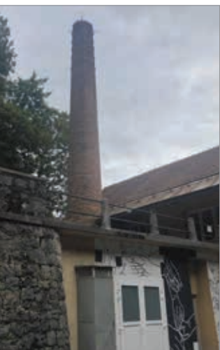
Spomenik starim časom pa še stoji.

Ljudje radi uživamo v obiskih drugih krajev. V njih iščemo navdih, sprostitve, izzive, zamisli. A pogosto se s prahom zastrti biseri skrivajo prav v naši neposredni bližini, le čas si je treba vzeti pa dvigniti pogled iznad mobilnika, ko se pelješ z ljubljanskim zelencem. Pa odkriješ prostor, ki govori zgodbo o razvoju, spremembah, kulturi in življenju prav tu v našem kraju. Pred domačim pragom.