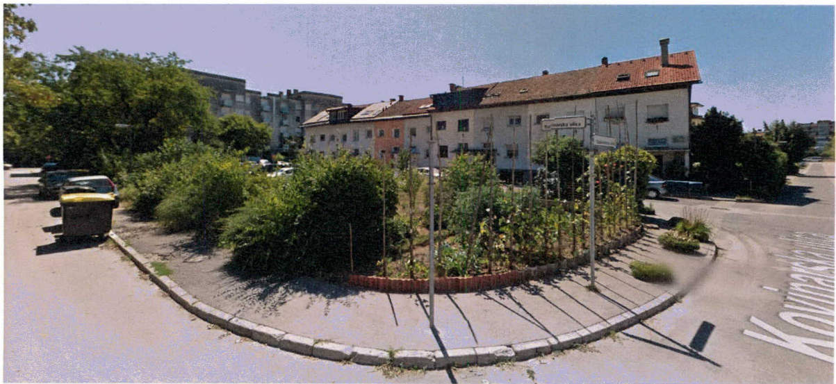
Pogled na območje s severozahoda