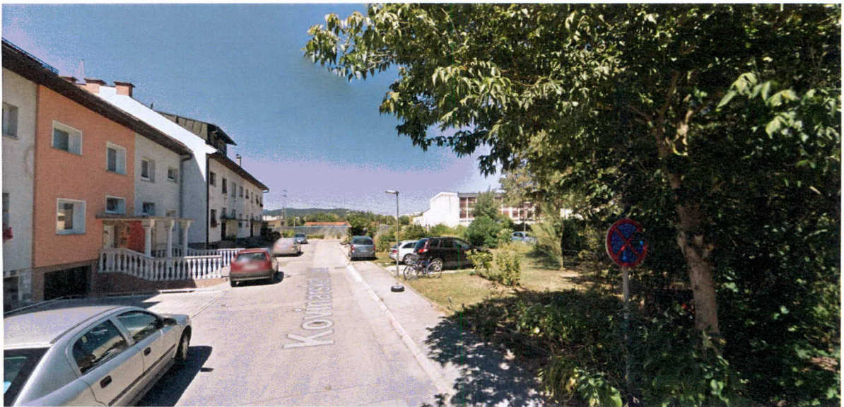
Pogled na območje z jugovzhoda