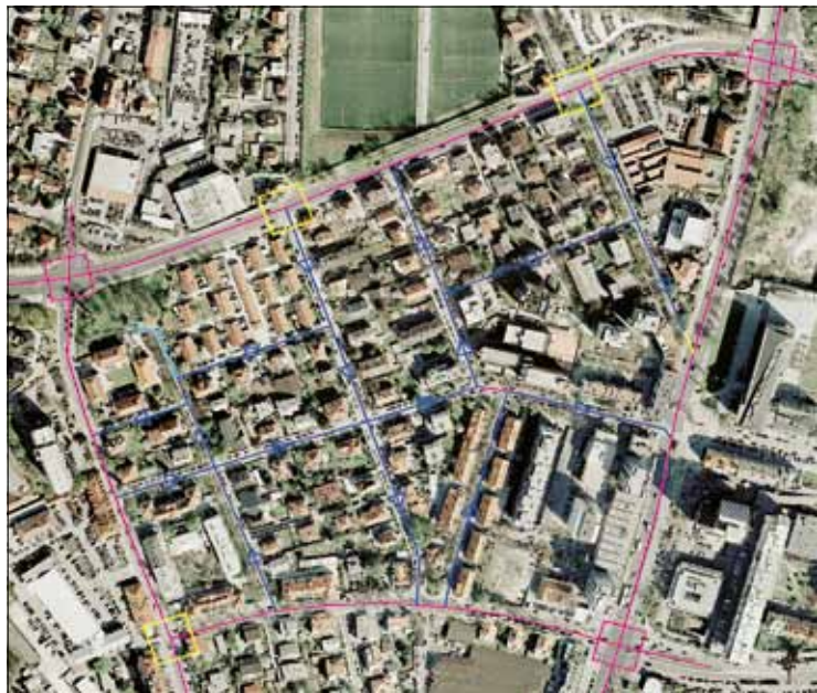
— Dvosmerna cesta — Enosmerna cesta — Območje umirjenega prometa ▶ Smer vožnje ◻ Semaforizi, križišče (obstoječe) ◻ Semaforiz. križišče (predlagano)