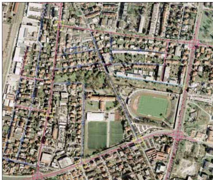
— Dvosmerna cesta — Enosmerna cesta — Območje umirjenega prometa ▶ Smer vožnje ◻ Semaforizi, križišče (obstoječe) ◻ Semaforiz. križišče (predlagano)