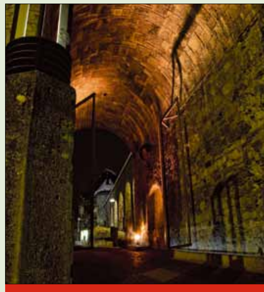
Nagrarena fotografija Žiga Dolharja.

Avtor vsakokratnega izbranega posnetka motiva Ljubljane prejme 125 evrov. Fotografije za objavo v marčni številki pošljite najpozneje do 5. marca na naslov: Mestna občina Ljubljana, glasilo Ljubljana, 1000 Ljubljana na CD-ju ali v fizični obliki ali na e- naslov: glasilo.ljubljana@ljubljana.si .