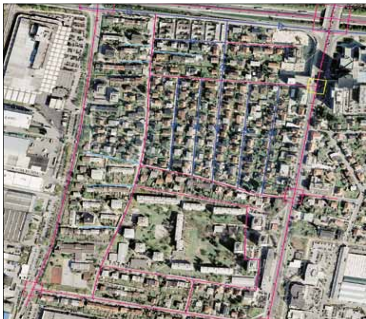
— Dvosmerna cesta — Enosmerna cesta — Območje umirjenega prometa ▶ Smer vožnje ◻ Semaforizi, križišče (obstoječe) ◻ Semaforiz. križišče (predlagano)