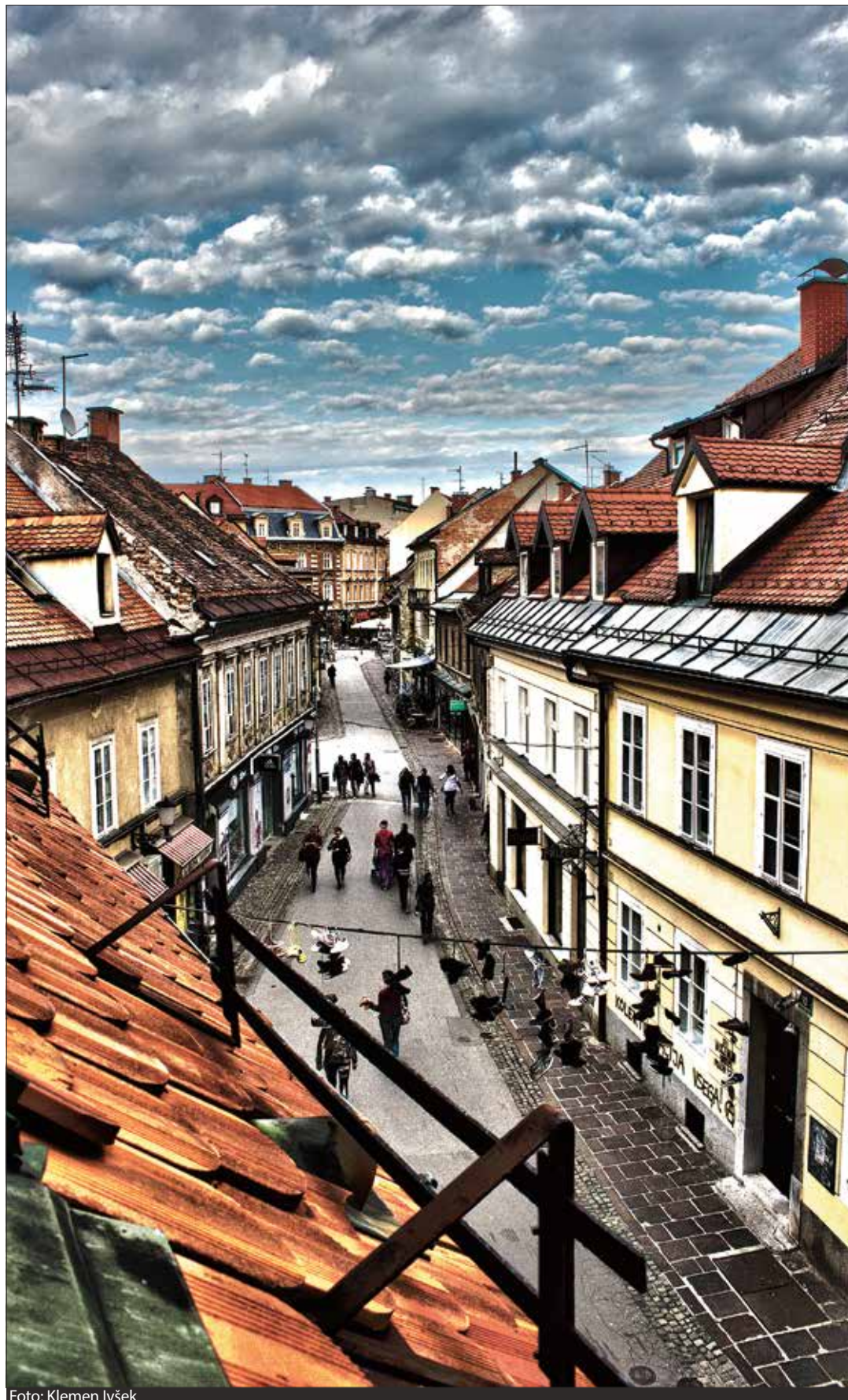
Nagrajena fotografija.