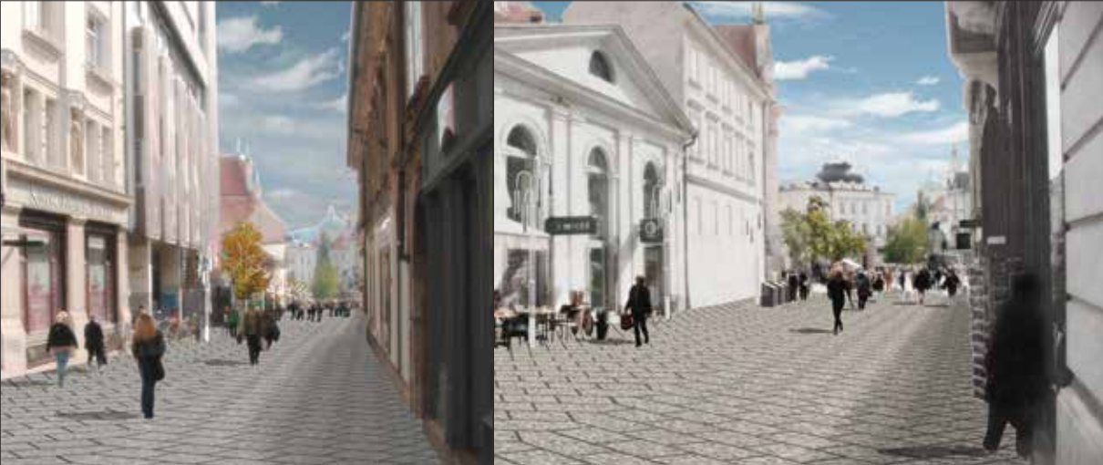
Idejna zasnova: Medprostor

22. aprila 2013 so začela potekati štiri mesece trajajoča obnovitvena dela na Čopovi ulici, ki zajemajo obnovo vodovodnega in kanalizacijskega omrežja, vključno z odcepi hišnih vodovodnih in kanalizacijskih priključkov, odcepov padavinske kanalizacije in ureditev ulice. Kanalizacijsko omrežje na Čopovi ulici je bilo zgrajeno že leta 1934, javni vodovod s cevovodi iz litega železa pa leta 1889. Prenovljena Čopova ulica bo tlakovana s ploščami iz pohorskega tonalita (v spodnjem delu ulice s kockami), položenih v raster ribje kosti, s čimer bo prenovljena podoba ohranila geometrijo tlaka, kakršnega ima Čopova ulica danes. Ob robu hiš se bo raster zgostil in dajal občutek pločnika, ki ga je ulica imela včasih. Celotna površina prenovljene ulice bo gladka, na zalomu pri vhodu v podhod med Čopovo in Nazorjevo ulico pa bodo umeščeni drevo, nekaj klopi in pitnik. Ob izteku proti Prešernovemu trgu bodo nameščene tudi potopne zbiralnice odpadkov. Prenova Čopove ulice predvideva tudi zamenjavo uličnih svetilk, ob osi ulice pa bodo za slepe in slabovidne postavljene taktilne oznake v izvedbi inoksovih trakov. Projekt prenove zgornjega ustroja Čopove ulice je delo arhitekturnega ateljeja Medprostor. - Dela izvaja na javnem razpisu izbrano podjetje Hidrotehnik d.d. Ljubljana, vrednost del je 1,3 mio evrov z DDV.