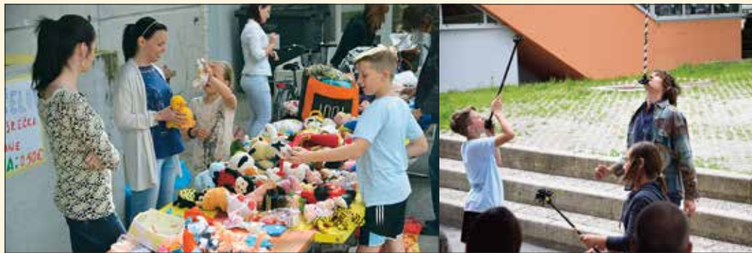
Dobrodelni Kreativni bazar Bežigrad, cirkuške veščine in boljšak.