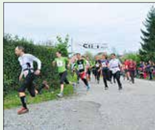
Izjemno dobra udeležba na Krosu Črnuče.