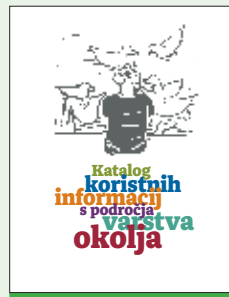
Naslovnica že tretjič ponatisnjene kataloga koristnih okoljskih informacij.