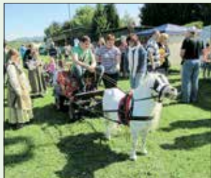
Jesensko srečanje ČS Šentvid.