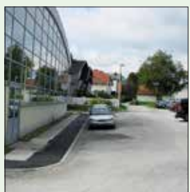
Foto: arhiv ČS Šentvid Peš in kolesarska pot za telovadno dvorano Gimnazije Šentvid.