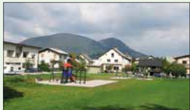
Novo otroško igrišče v Guncljah, izvedeno v okviru malih del ČS.