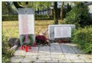
Spominsko obeležje NOB.