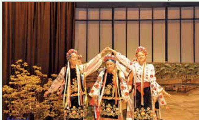
Prvi mednarodni festival folklorne v Črnučah.