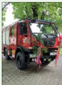
Novo gasilsko vozilo GD Črnuče.