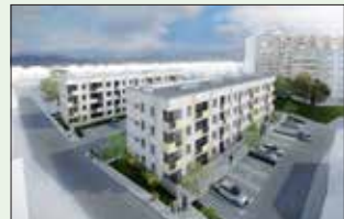
Idejna zasnova: arhiv JSS MOL

JSS MOL je pridobil idejno zasnovo za prenovu stavbe Ob Ljubljani 42, v kateri bo po prenovi 10 neprofitnih stanovanj, in naročil izdelavo mobilnostnega načrta.