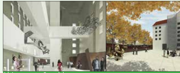
Idejna zasnova: Scapelab

Mestna galerija, ki ima poleg razstave tudi bogato publikiščno bero, je praznovala 50 let delovanja.