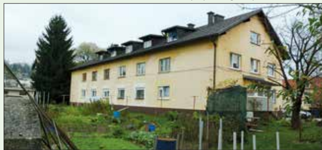
Projekt Hiše Sonček

JSS MOL je odkupil podstrešne prostore v stavbi Zarnikova 4, za katere bo do konca leta pridobljeno gradbeno dovoljenje za izgradnjo 7 bivalnih enot.