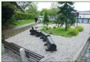
Obnovljeno otroško igrišče na Mlinski ulici in vlakec na igrišču.