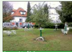
Fitnes na prostem v ČS Center.