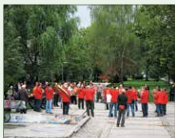
Nastop godbe na pihala v Kosezah 19. septembra 2013.