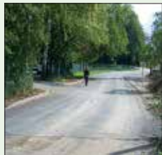
Nova asfaltna prevleka pri Zavodu sv. Stanislava.