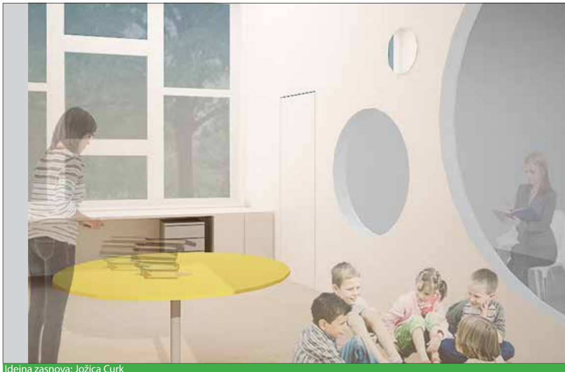
Idejna zasnova: Jožica Curk

Četudi bi imeli v tem trenutku možnost izobraževanja za 200 učiteljev, še vedno ne bi mogli vključiti vseh, tako zelo smo vsi skupaj potrebni znanja o tem, kako otrokom s posebnimi potrebami omogočiti, da razvijejo svoje sposobnosti, da se v šoli počutijo sprejete in enako samozavestne ob svojih dosežkih tako kot njihovi vrstniki in ob tem dozorevajo za svoj življenjski poklic. Ponosna sem, da smo kot Mestna občina Ljubljana – z nepogrešljivo županovo podporo – naredili prvi korak, in veselim se vseh naslednjih.