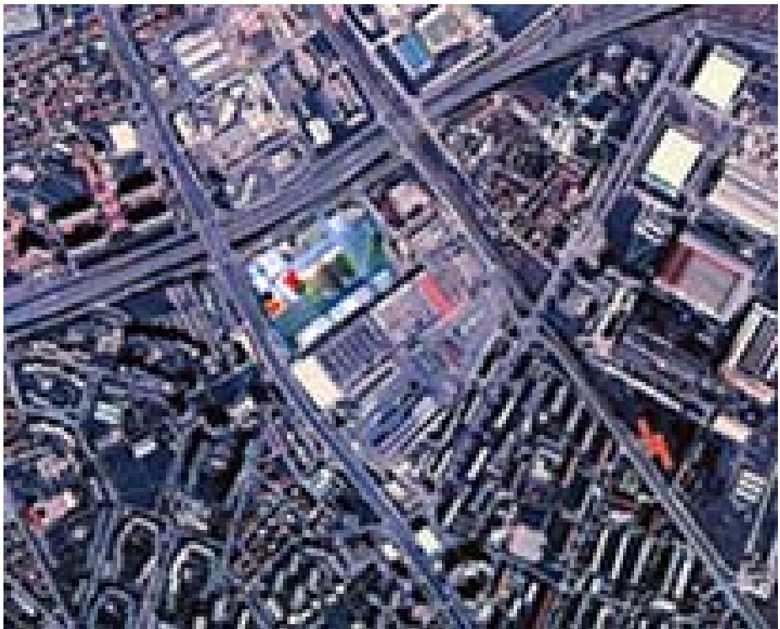
slika 2: SITUACIJA

V skrajni severozahodni del pa je kot prostorska dominanta območja in tega dela mesta umeščen dvojni stolp s poslovnimi programi.