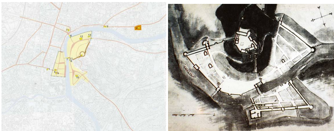
Slika 6: Poselitev Ljubljane v času od 12. do 14. stol. (levo) in načrt Ljubljane iz 16. stol. (desno, Horvat 1997).

Današnja podoba Špice je dal leta 1772-82 zgrajen Gruberjev prekop za odvodnjavanje zamočvirjenega območja na robu Ljubljanskega barja (toponim Prule izhaja iz staronemško Bruel , t.j. mokro, močvirnato ozemlje). Mestni pomerij so na Prule razširili v 18. stol., ko so območje razparcelirali in podelili meščanom, ki so hoteli graditi zunaj obzidja. S tem se je začelo počasno rušenje srednjeveškega obzidja, ki je oviralo spontano širitev mesta. Deželna gradbena komisija je za območje Prul leta 1787 pripravila načrt ureditve z opekarno na Špici (sl. 7, Korošec 1991). V neposredni bližini je bil leta 1810 ustanovljen botanični vrt (Kopriva 1989). Dokončno pozidane so bile Prule šele po ljubljanskem potresu v začetku 20. stol..