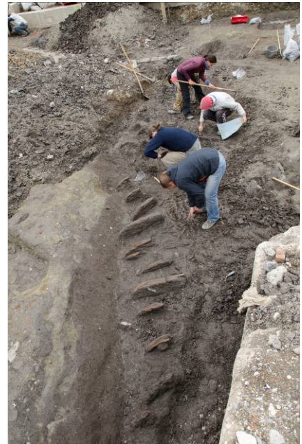
Slika 4: Pogled na tlakovanje (levo) in palisado v odvodnem jarku na lokaciji Prule 9.

Iz časa sredine in druge polovice 1. stoletja pr. n. št. je bilo v Ljubljani do sedaj poznano le staroselsko naselje na območju Starega in Gornjega trga (Vičič 1993, 1994, 2002), kamor so se v tem času priseljevali rimski državljani in Italiki iz severne Italije.