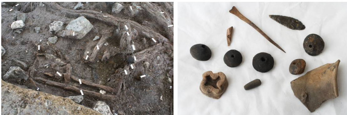
Slika 1: Detajl kulturne plasti z arhitekturnimi elementi (levo) in izbor predmetov (desno).

Na širšem območju današnje Ljubljane so bili prvi pokazatelji poselitve odkriti na položnih terasah osamelcev na Ljubljanskem barju iz časa srednje kamene dobe oziroma mezolitika okoli 5000 pr.n.št. V poznem neolitiku na celotnem območju Barja doživijo razcvet koliščarske naselbine (Plesničar Gec, Sivec 1996, 11). Ena izmed teh je bila odkrita tudi na območju današnjega mesta Ljubljane na Špici. Koliščarsko obdobje je z več prekinitvami trajalo vsaj 2500 let; najstarejša kolišča sodijo v mlajšo kameno dobo, v 5. tisočletje pr.n.št., najmlajša v zgodnjo bronasto dobo, v prvo polovico 2. tisočletja pr.n.št..