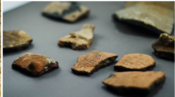
Slika 2: Pogled na prazgodovinski močvirnat sediment in izbor najdb.

Iz tega časa je v neposredni bližini v reki Ljubljanici znano t.i. »mesto žrtvovanja« med Špico in Čevljarским mostom. V tem času je bil že poseljen Grajski grič s pripadajočim grobiščem na drugi strani reke na dvorišču današnjega SAZUja. Iz časa mlajše bronaste dobe oziroma kulture žarnih grobišč pa je tudi žgan grob z območja NUK II (Gaspari 2010, 22-23).