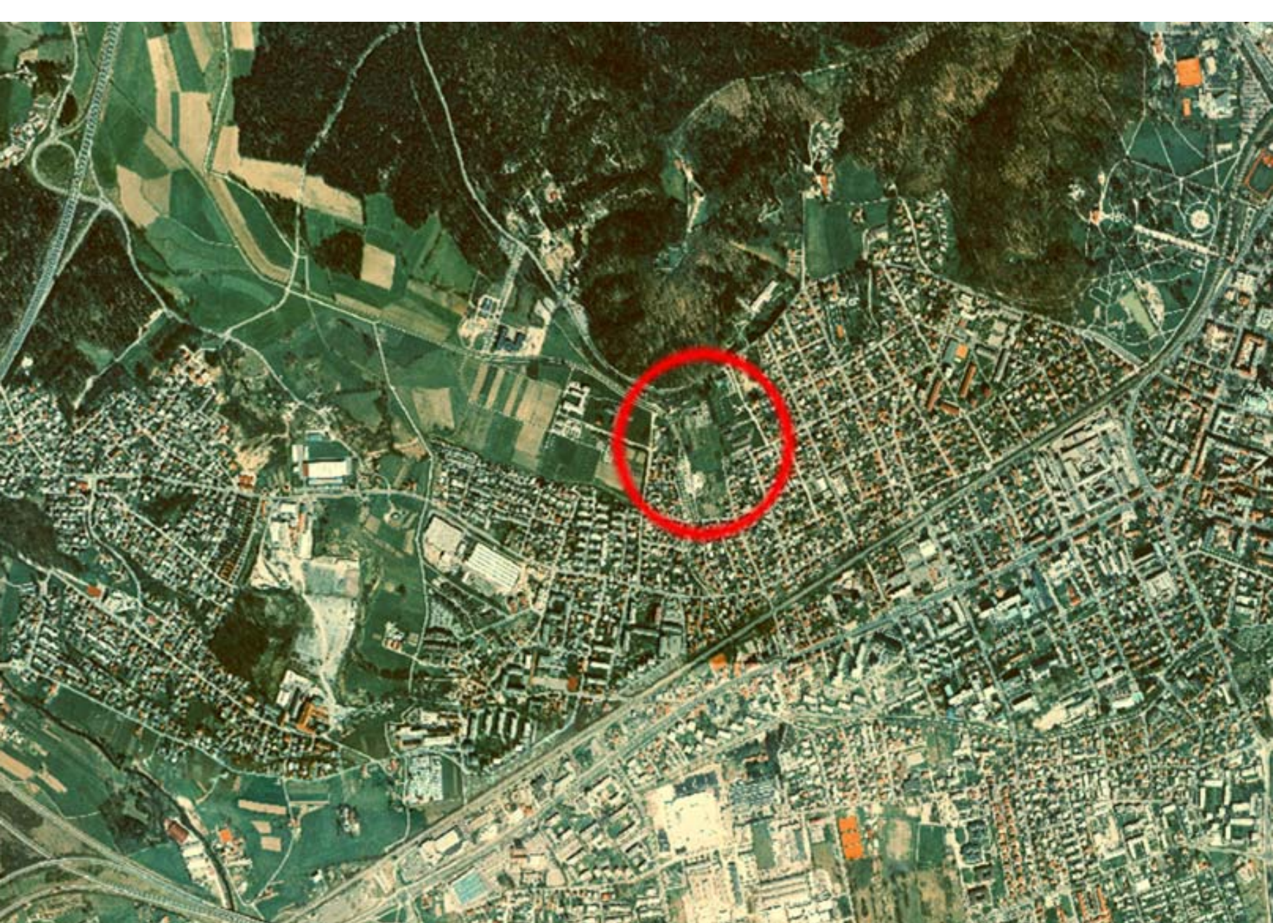
LOKACIA OBMŔOČIA V ŠIRŠEJŠOM PROSTORU