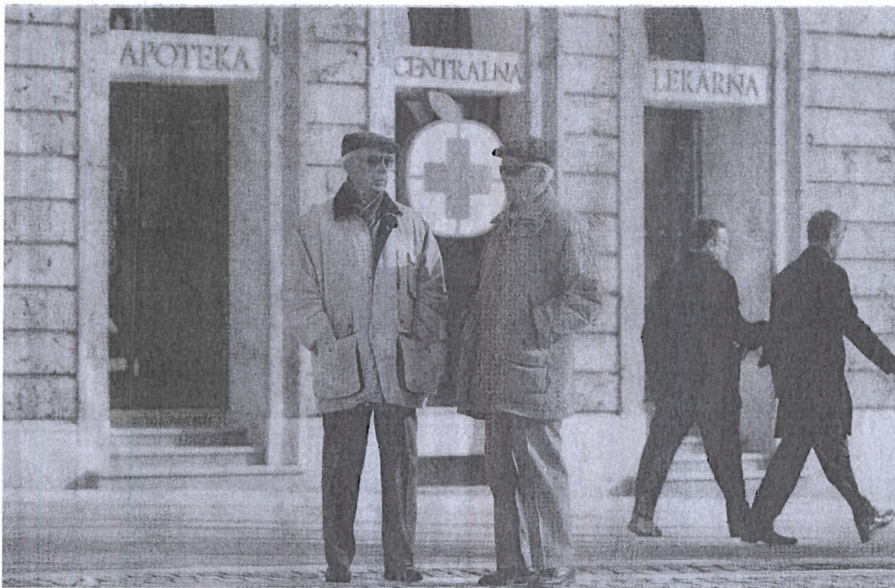
Ljubljanski lekarnarji poslujejo po svoje

ni razpis v nobenem primeru ne sme predpisovati točno določene znamke izdelka; temveč le njegove karakteristike. V nasprotnem primeru naročnik neupravičeno omejuje konkurenco.