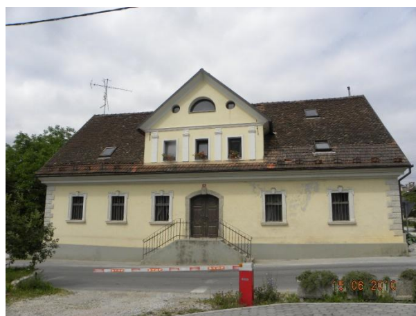
Hiša iz vzhodne strani