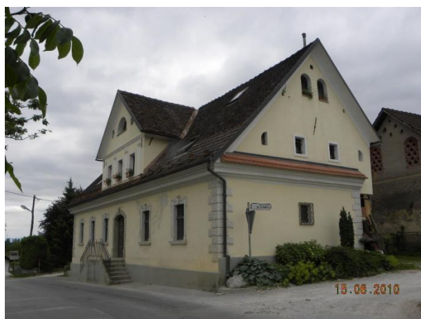
Hiša iz severovzhodne strani

Hiša stoji tik ob glavni cesti, ki vodi skozi naselje Spodnje Gameljne in je ena redkih stanovanjskih hiš v širšem ljubljanskem prostoru z ohranjeno raščeno arhitekturno zasnovo treh stoletij.