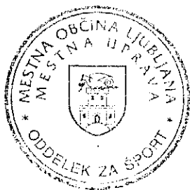
Marko Kolenc Vodja Oddelka za šport

Sprejetje predlaganega sklepa ne bo imelo finančnih posledic, ki bi vplivale na proračun MOL.