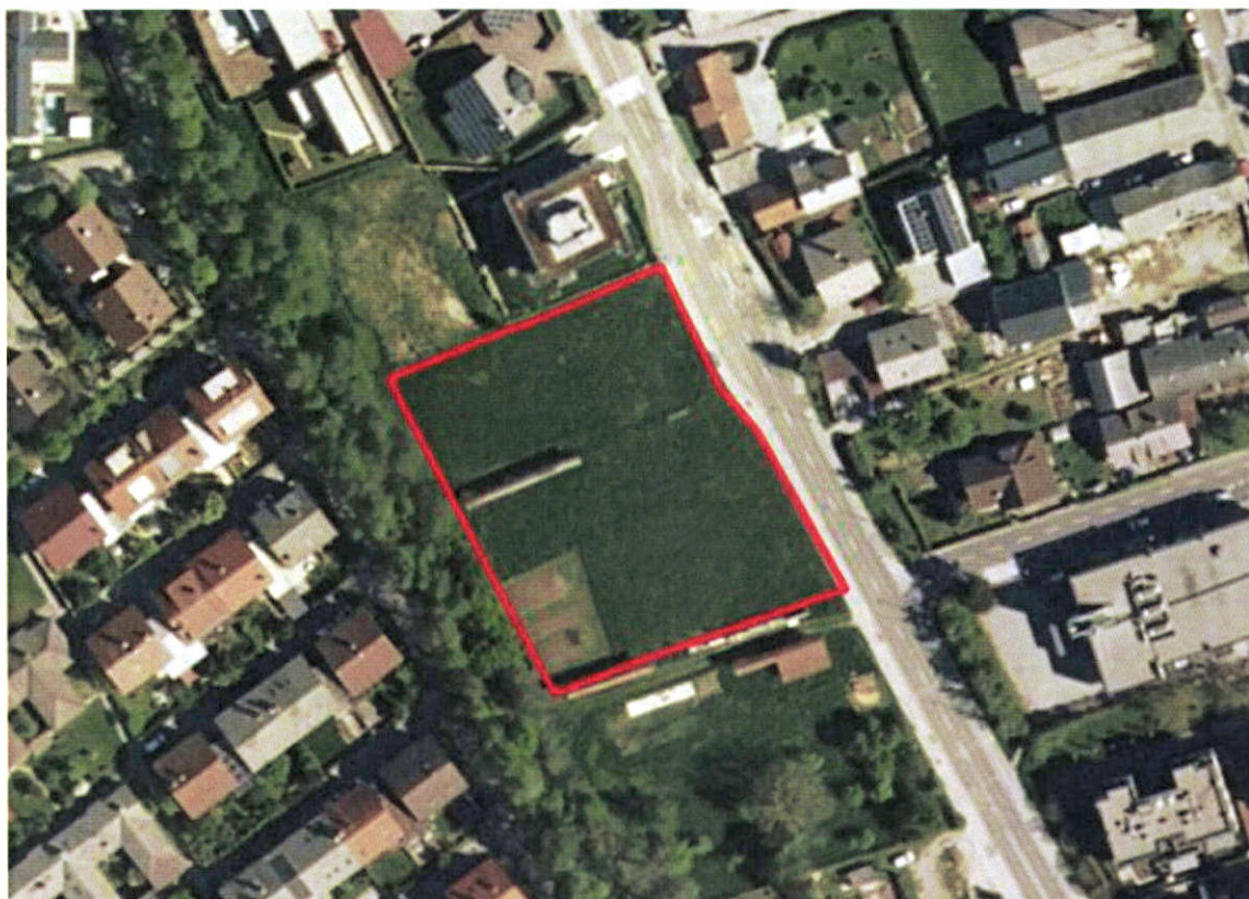
Območje OPPN 498: na ortofoto posnetku