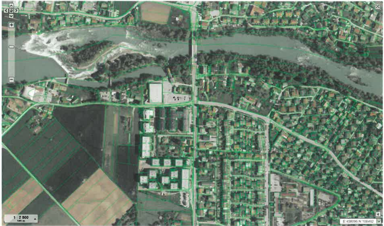
Položaj parcele in širše območje