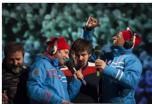
Slika 9: Prizori iz predstave Slovenskega mladinskega gledališča, Rokova modrina, ki je bila opremljena z nadnapisi za osebe z okvaro sluha

Pri JZ Pionirski dom – Center za kulturo mladih se je konec meseca septembra 2016 začel 2. Likfest – Likovni festival za otroke (trajal bo do 25. maja 2017), ki je namenjen likovnemu ustvarjanju otrok vrtcev in osnovnih šol ljubljanske regije ter njihovim mentorjem in likovnim pedagogom. Med razstavljenimi deli na festivalu so bila tudi dela otrok iz Centra Janeza Levca Ljubljana.