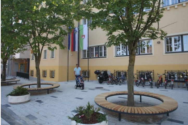
Slika 3: Okolica osnovne šole Vide Pregarc po prenovi

Novogradnja osem oddelčnega Vrta Pedenjped, enota Kašelj, z razvojnim oddelkom za otroke s posebnimi potrebami, je v fazi pridobivanja gradbenega dovoljenja, potekajo postopki, vezani na izvedbo javnega naročila za izbiro izvajalca del, na podlagi katerega se bo začela gradnja (predviden zaključek v 2018).