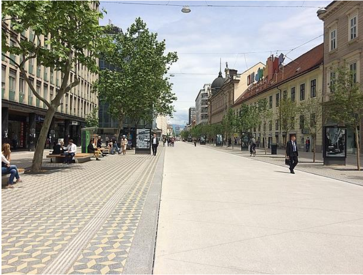
Slika 6: Taktilna pot na prenovljeni Slovenski cesti.

Jakopičevem sprehajališču do gozdne učilnice v Tivoliju. Taktilne oznake na Bregu in na Roški cesti so prvi poskus nameščanja tovrstnih oznak v Ljubljani in jih ni mogoče šteti v celovit in uporabnikom uporaben sistem vodenja.