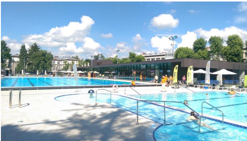
Slika 4: Kopališče Kolezija, kjer je gibalno oviranim na voljo dvigalo za vstop v in izstop iz bazena.

V obdobju, na katerega se nanaša poročilo, je bilo za vstop v in izstop iz bazena na kopališču Tivoli (Park Tivoli, Celovška cesta 25) in na kopališču Kolezija (Gunduličeva ulica 7) nameščeno osebno dvigalo za osebe z oviranostmi.