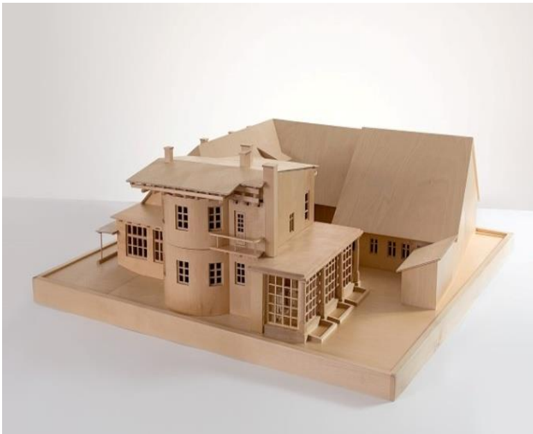
Slika 8: Tipna maketa Plečnikove hiše

V JZ Mestno gledališče ljubljansko so vzpostavili stike z Društvom slepih in slabovidnih Ljubljana ter jih vsakokrat obveščali o terminih uprizoritev in igralski zasedbi. Vzpostavili so tudi tesnejše sodelovanje z MMC RTV SLO in bralne uprizoritve v sezoni 2015/2016 najavljali na portalu DOSTOPNO ( www.rtv slo.si/dostopno/ ), v okviru katerega so dobili več medijskega prostora tudi za intervjuje in podrobnejše opise posameznih dramskih del.