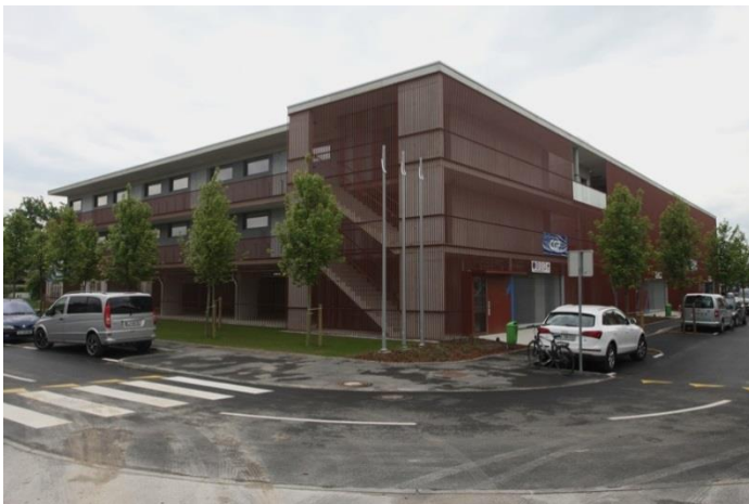
Slika 5: Nova stanovanjska soseška Dolgi most s 30 neprofitnimi najemnimi stanovanji.

Aprila 2016 je bila zaključena gradnja stanovanjske soseške Dolgi most (30 stanovanj) s pripadajočo zunanjo, prometno in komunalno ureditvijo. Sosesko v nizkoenergijskem standardu sestavljajo 3 ločene dvoetažne stanovanjske stavbe (lamelle), v vsaki od njih je po eno stanovanje, prilagojeno gibalno oviranim. Med lamelama Za progo 3 in 3A je na zahodni strani locirano osebno dvigalo, s katerim je omogočen dostop do stanovanj v vseh treh lamelah. V okviru 54 parkirnih mest, v skupni garaži v pritličju stavb, so 4 parkirna mesta prilagojena osebam z oviranostmi.