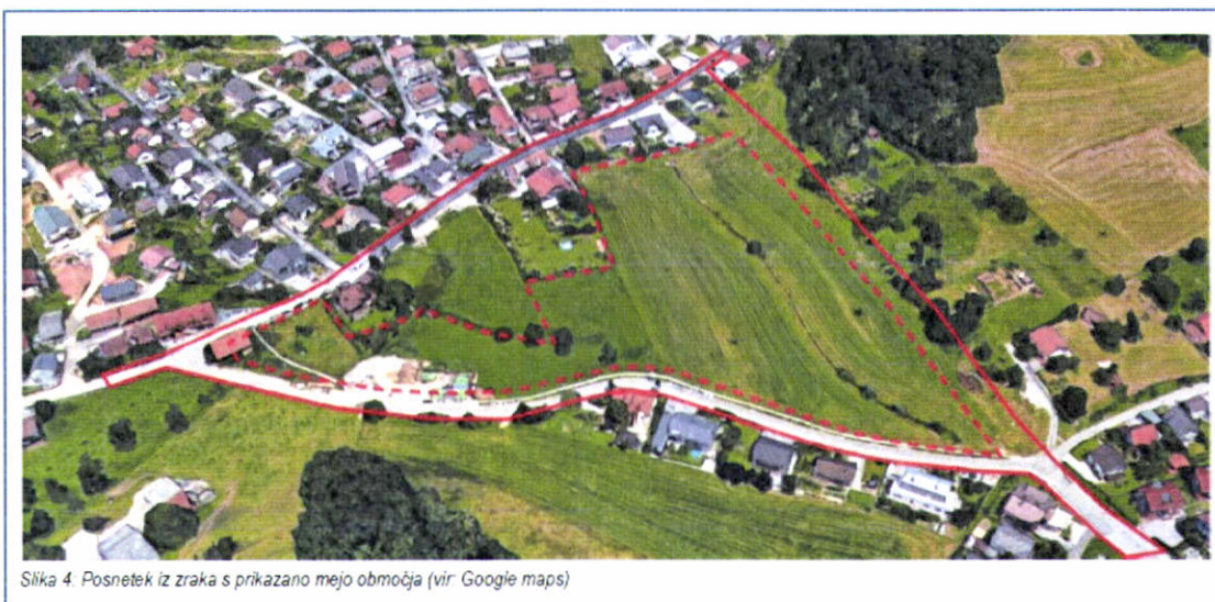
Slika 4. Posnetek iz zraka s prikazano mejo območja

Grafični prikaz zemljišč/območja lokacijske preveritve v elaboratu lokacijske preveritve, ki je bil javno razgrnjen (iz: Elaborat lokacijske preveritve, stran 8)