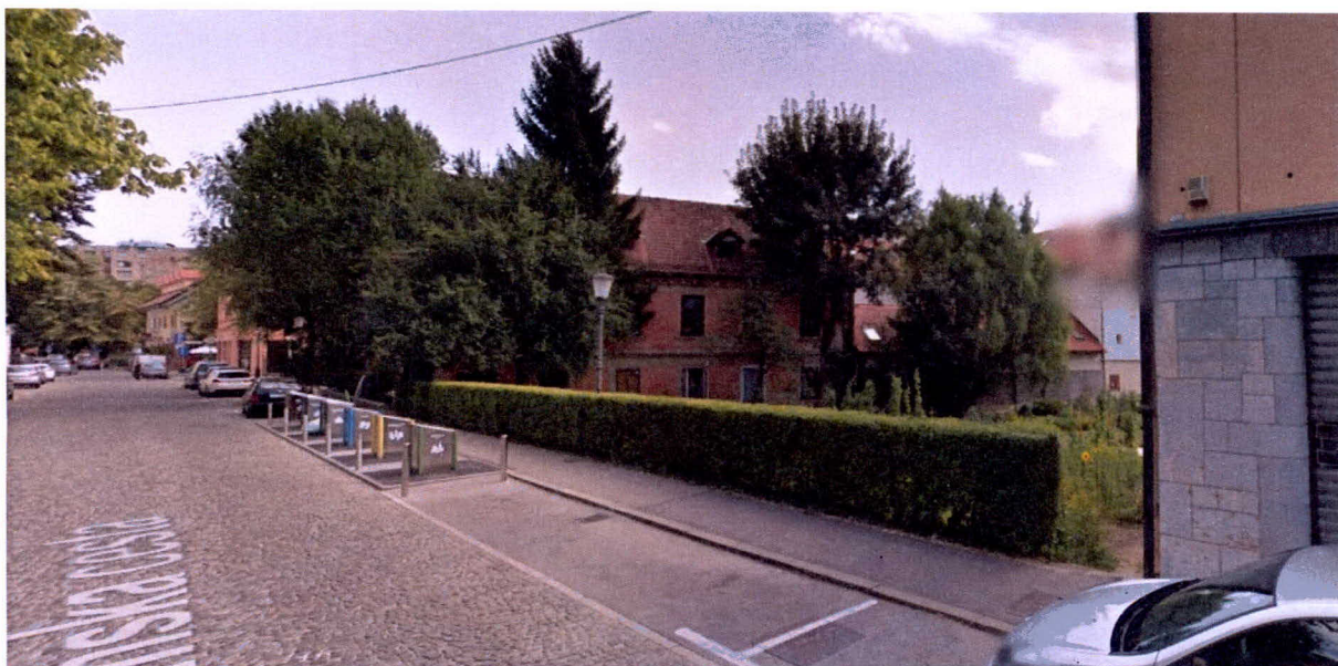
Pogled na območje z Rimske ceste