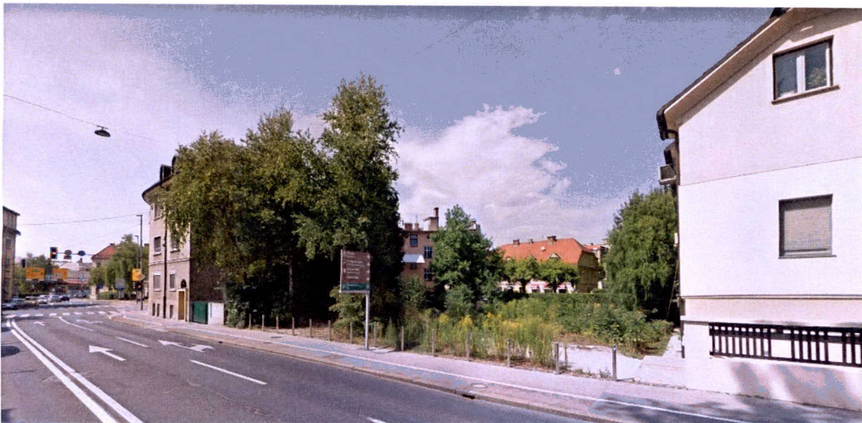
Pogled na območje z Aškerčeve ceste