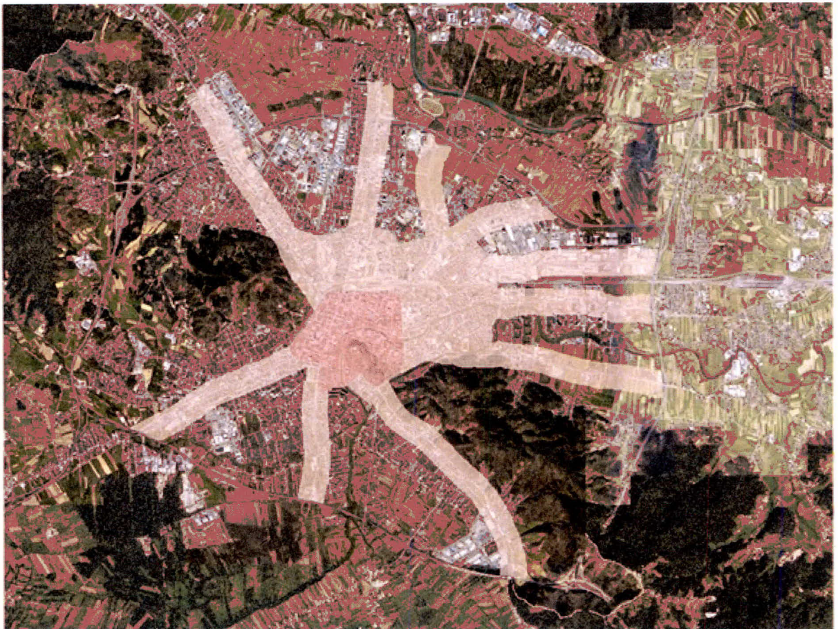
Grafični prikaz parkirnih con, določenih v 37. členu odloka OPN MOL ID (temnejša roza oznaka - parkirna cona 1, svetlejša oznaka - parkirna cona 2, brez oznake - parkirna cona 3)