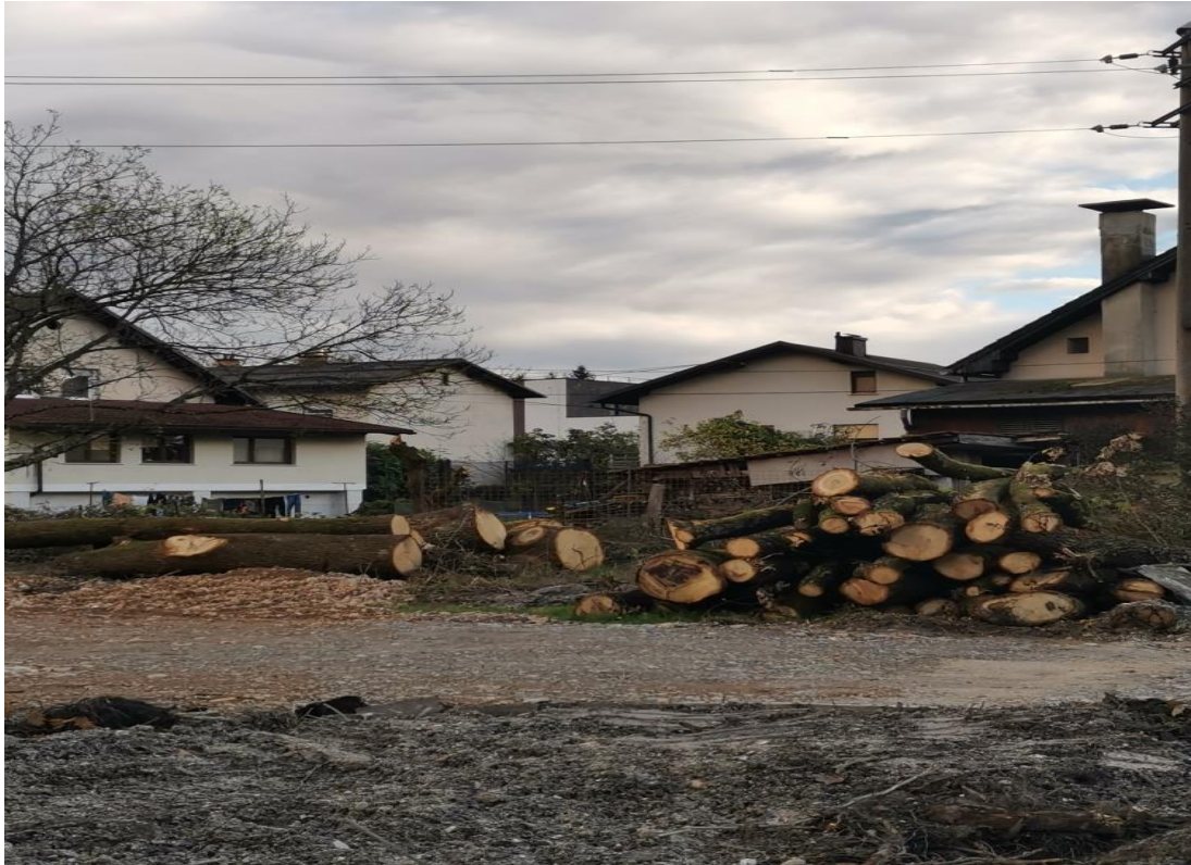
Fotografija: posek dreves, priprave na začetek gradnje

Na območju so posekali ogromno število odraslih dreves, kar je delno razvidno iz fotografije debel, ki še ležijo na parceli. Za območje ni bil sprejet OPPN in zato z odlokom niso predpisani pogoji za oblikovanje zunanjih površin in v kakšni meri bi bilo potrebno ohraniti kakovostna odrasla drevesa, da se jih vključi v zunanjo ureditev. In posledično tudi ni določbe s kolikšnim številom novih dreves bi bilo potrebno nadomestiti odstranjena odrasla drevesa.