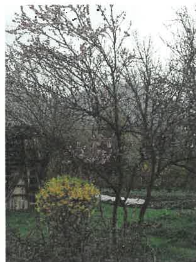
Slika 6. Cvetoče samoniklo drevje.