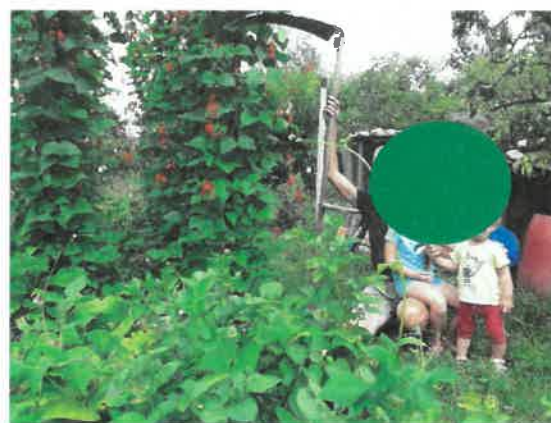
Slika 3. Peta generacija družine se že priučuje k delu na istem vrtu kot njihova pra prababica.