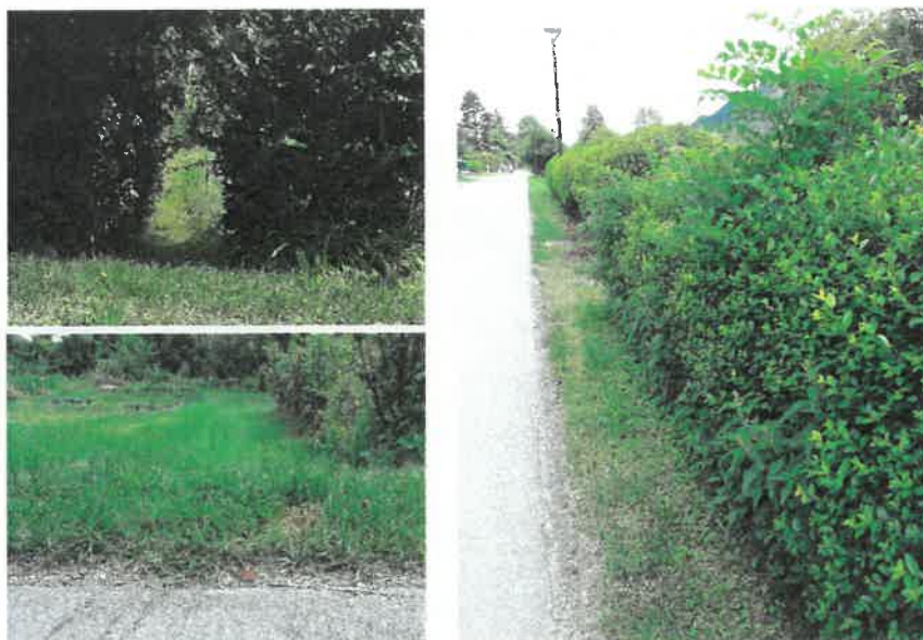
Slika 8. Živa meja ob cesti je najboljša ograja.

Vrtovi na Brodu so s svojo podobo, in pestrostjo flore in favne v vseh letnih časih, lahko vzgled vsem drugim vrtovom v Ljubljani (Slika 8).