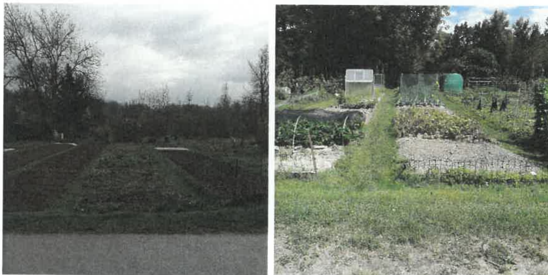
Slika 7. S ceste so dobro vidne karakteristike tradicionalnega ali podeželskega vrta, saj so vrtovi ozki in podolgovati, poti med obdelovalnimi površinami pa so travnate.

Strinjali bi se da se sedanji vrtovi razdelijo na različno velike obdelovalne površine, vendar naj konfiguracija ostane taka kot je sedaj.