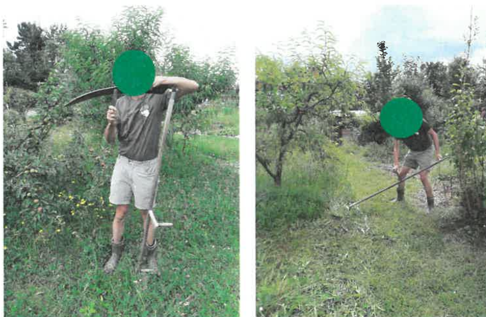
Slika 1. Košenje s koso na tradicionalen način.

Sem [REDACTED], in sem eden od uporabnikov zemljišča na Brodu ob cesti Ob Savi. Na to zemljišče me vežejo lepi spomini na obdobje mojega otroštva. Tja me je vodila pokojna stara mati, kjer je obdelovala njivo s krompirjem, del zemljišča pa je koristila kot travnik za košnjo. Posebej lepi so bili pomladanski in poletni meseci. Imel sem priliko spoznavati vso pestrost narave, ki me je obdajala. Na travniku so rastle raznovrstne rože med katerimi so letali raznovrstni metulji, čmrlji, divje in domače čebele ter hrošči. V mesecu maju in juniju je svoj koncert uprizarjalo nešteto samcev murnov. Vsak od njih je pred svojo luknjico v zemlji s čričkanjem privabljal k sebi samičko. Veliko mi je, kot kratkohlačniku, pomenilo, ko se je delo stare matere potegnilo v večer. Zvečer so po zraku letala druga enkratna bitja. V mesecu maju majski hrošči, junija kresničke s svetlečim zadki in največji leteči hrošči pri nas, rogači ali klešmani. Pri starosti šest do sedem let sem prvič ugotovil zakaj se uporabljajo grablje, motika, kosa in drugo poljedelsko orodje. Travo okoli vrta ob Savi še danes kosim ročno s koso ali srpom (Slika 1).