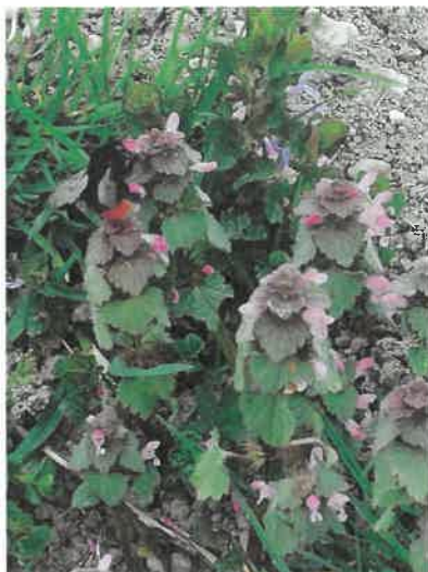
Slika 4. Spomladi je za matico čmrlja cvetoča mrtva kopriva prva hrana.