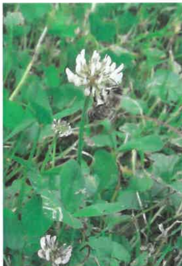
Slika 5. Poleti pustimo rasti deteljo za vse vrste čebel.