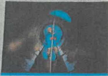
Ilustracija: Miroslav Šušteršič

Čistilnica odpadnih voda na območju ljubljanskega polja je največji projekt, ki ga je v Sloveniji kdoli načrtovala in izvedla. Vrednost projekta znaša približno 1,2 milijarde evrov. Čistilnica bo obsejala površino 1,2 milijona kvadratnih metrov in bo imela 1200 delovnih mest. Čistilnica bo obsejala površino 1,2 milijona kvadratnih metrov in bo imela 1200 delovnih mest. Čistilnica bo obsejala površino 1,2 milijona kvadratnih metrov in bo imela 1200 delovnih mest.