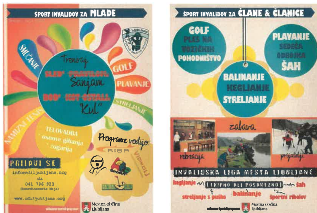
Slika 20: Promocija športno rekreativnih programov za osebe z oviranostmi, ki jih sofinancira MOL

V okviru programa športa odraslih oseb z oviranostmi je MOL v letu 2017 sofinanciral 64 skupin (skupno okoli 866 vključenih oseb), v letu 2018 pa 58 skupin (skupno okoli 742 vključenih oseb). Vadili so v (športnih) programih alpsko smučanje, stadionska atletika, judo, košarka, namizni tenis, nogomet, plavanje, strelstvo, tenis, balinanje, bilijard – pool, bowling, karate, kegljanje, kolesarstvo – steza, mali nogomet – futsal, ples – standardni in latinskoameriški, curling, potapljanje – podvodna orientacija, ribištvo – sladkovodni ribolov.