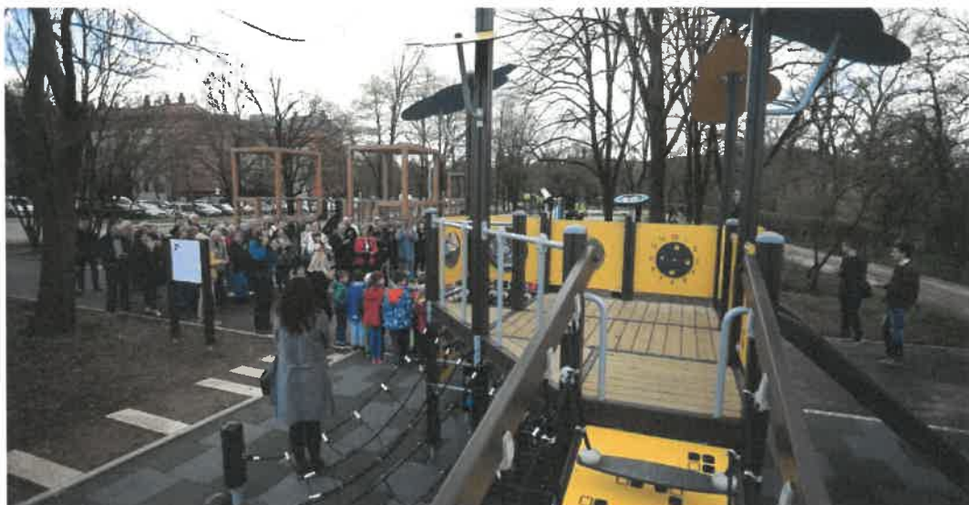
Slika 13: Otvoritev parka Muste

MOL (Oddelek za varstvo okolja MU MOL) je v 2017 začel ter v 2018 končal z gradnjo družinskega parka Muste. Nov park povezuje Nove Fužine in Štepanjsko naselje na nasprotnih nabrežjih Ljubljane, oba dela pa povezuje nov doživljajski most. V parku se nahajajo tudi igrala in naprave za gibalno ovirane otroke in starejše. Na severni strani je park zaključen z urbanim sadovnjakom (že četrtim v MOL) s 64 sadnimi drevesi, ob sadovnjaku je še 14 parkovnih dreves, kot drevored ob Poti na Fužine. Na tem delu je tudi novo vzdolžno parkirišče za potrebe gibalno oviranih, ki je s potko povezano z družinskim parkom oziroma z igriščem.