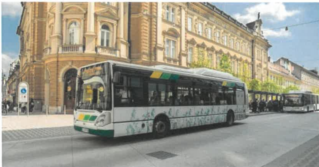
Slika 17: Nizkopodni mestni avtobus na prenovljeni Slovenski cesti, kjer velja omejen prometni režim

Od maja 2016, ko je izvajalec javne službe mestnega linijskega prevoza potnikov v MOL, JP Ljubljanski potniški promet d.o.o. (v nadaljnjem besedilu: LPP d.o.o.), izvedel nakup 30 novih avtobusov, so vsi avtobusi, vključeni v linijski mestni prevoz potnikov, nizkopodni, z nagibno tehniko.