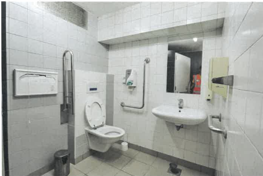
Slika 6: Osebam z oviranostmi prilagojene javne sanitarije