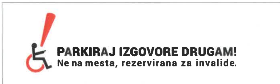
Slika 15: Logotip kampanje Parkiraj izgovore drugam! Ne na mesta, rezervirana za invalide.

aktivnostim. Kampanja je vključevala tako aktivnosti za ozaveščanje širše javnosti o problematiki (izdelan je bil odmeven TV spot, spletna stran projekta, objave na spletni strani MOL...), strokovne posvete oziroma predstavitve in poostren nadzor na terenu. Slednji je potekal od 4. do 17. decembra 2017 in 3. decembra 2018; mestni redarji so v omenjenih terminih nadzor nad uporabo parkirnih mest, rezerviranih za osebe z oviranostmi, izvajali na celotnem območju MOL, s poudarkom na bolj frekventnih lokacijah v mestnem središču in v okolici nakupovalnih središč, kjer najpogosteje prihaja do tovrstnih kršitev. Glavni partner in koordinator projekta oziroma kampanje je bila Javna agencija RS za varnost prometa, ostali partnerji pa MOL, Fakulteta za varnostne vede Univerze v Mariboru in Taktik, agencija za komunikacijski management d.o.o.