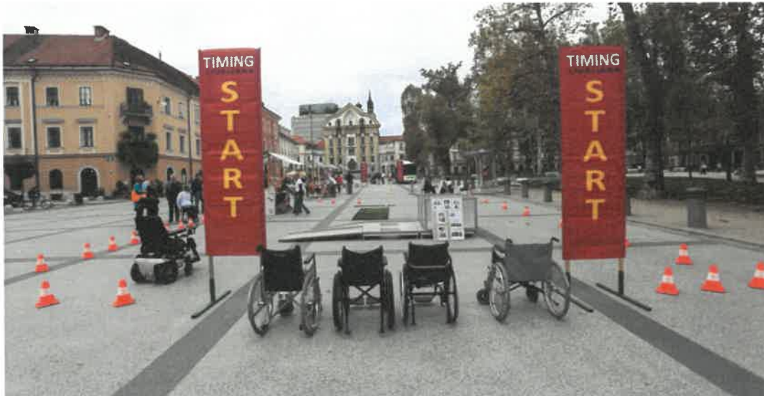
Slika 1: Štartno mesto za preizkus ovir na OVIRANTlonu leta 2017

Za prejem pobud in vprašanj, s katerimi se občanke in občani obračajo na MOL, je vzpostavljena enotna vstopna točka, spletni portal Servis pobude meščanov , ki je dostopen na spletni povezavi https://pobude.ljubljana.si/ . Spletni portal od avgusta 2018 deluje v prenovljeni različici, optimiziran proces obravnave pobud je zdaj standardiziran, enak postopek obravnave velja za vse oddelke in službe MOL, pri čemer so tudi jasno opredeljene odgovornosti, naloge in vloge posameznikov v procesu. Tako prenovljen proces in zaledni portal omogočata hitrejšo, učinkovitejšo in prijaznejšo komunikacijo z občani. Občanke in občani MOL se za pobude in vprašanja lahko obrnejo na MOL tudi osebno – na Odsek za pobude meščanov in na župana MOL, ob organiziranih dnevih odprtih vrat, vsak prvi torek v mesecu ter preko telefona, faksa in elektronskega naslova pobude@ljubljana.si .