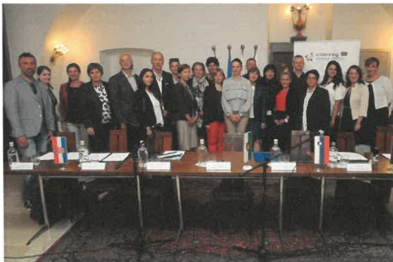
Slika 29: Podpis partnerskega sporazuma za projekt CrossCare

ZOD je nosilec mednarodnega projekta CrossCare (sofinancira ga Evropski sklad za regionalni razvoj v okviru programa sodelovanja Interrrg SL – HR), v okviru katerega izvaja brezplačne storitve fizioterapije, delovne terapije, zdravstvene nege in dietetike na domovih uporabnic in uporabnikov. Partnerski sporazum za projekt CrossCare je bil podpisan septembra 2018 v Mestni hiši MOL.