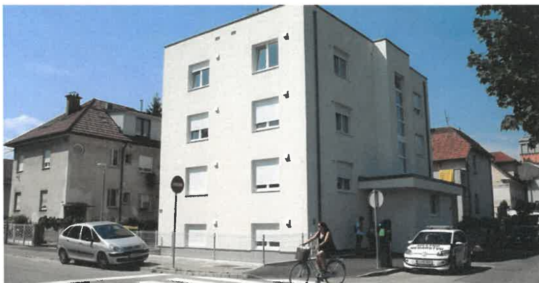
Slika 10: Nova neprofitna najemna stanovanja na naslovu Ob Ljubljani 42

Večstanovanjsko stavbo na naslovu Ob Ljubljani 42, z uporabnim dovoljenjem z dne 21. marec 2017, je investitor prevzel po opravljenem kvalitativnem pregledu v mesecu juliju 2017, ko je tudi začel z oddajo stanovanj upravičencem. Z izvedbo prenove in rekonstrukcije stavbe se obstoječa etažnost stavbe (K + P + 2N) ni spremenila. V stavbi, ki je bila v okviru prenove tudi energetsko sanirana, je JSS MOL pridobil skupno 10 neprofitnih stanovanjskih enot s pripadajočimi shrambami v kleti. Eno stanovanje je prilagojeno za uporabo gibalno ovirane osebe. Ob obstoječem stopnišču na severni strani stavbe je bilo vgrajeno osebno dvigalo. Glavni vhod v objekt je bil zaradi zagotavljanja neoviranega dostopa prestavljen na dvoriščno stran. Eno od dveh zunanjih parkirnih mest je namenjeno osebam z oviranostmi. Projekt je bil zaključen v letu 2017, v letu 2018 pa so stanovanja že v uporabi najemnikov.