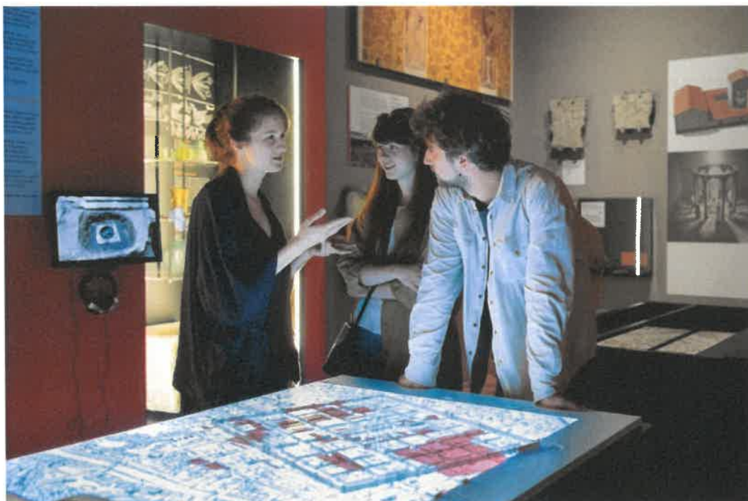
Slika 23: Utrinek iz nove stalne postavitve Ljubljana.Zgodovina.Mesto. v Mestnem muzeju

Po vsem dostopni stalni razstavi Obrazi Ljubljane je v Mestnem muzeju Ljubljana, Gosposka ulica 15, od 8. maja 2018 na voljo nova stalna razstava o zgodovini Ljubljane z naslovom Ljubljana.Zgodovina.Mesto. , ki prinaša pregleden kronološki razvoj prostora ljubljanske kotline od prazgodovine do danes. Za slepe in slabovidne so na voljo tipni zemljevid in tehnični opis stalne razstave, zvočni vodnik bo pripravljen v 2019. Pri pripravi nove stalne razstave je Mestni muzej Ljubljana sodeloval s Kulturno izobraževalnim zavodom Ustvarjalna Pisarna SOdelujem, s katerim pripravljajo tipne zemljevide, zvočni vodnik, tehnične opise in več-čutna vodstva.