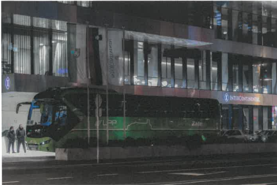
Slika 18: Nov turistični avtobus LPP d.o.o., dostopen tudi osebam na invalidskih vozičkih

Po več letih prizadevanj je LPP d.o.o. v 2017 izvedel nakup dveh turističnih avtobusov za občasne prevoze. Avtobusa podjetja MAN se ponašata s prostornostjo in udobjem in sta prva tovrstna v Sloveniji s posebnim dvigalom, ki zagotavlja udoben vstop na avtobus potniku na invalidskem vozičku. Na enem avtobusu lahko hkrati potujeta dve osebi na invalidskih vozičkih.