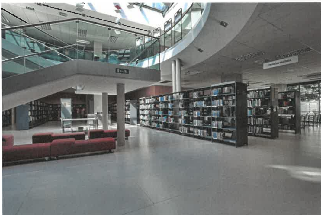
Slika 4: Knjižnica Šiška obratuje v sodobno opremljenih in brez arhitekturnih ovir dostopnih prostorih, na Trgu komandanta Staneta 8, neposredno ob Celovski cesti

JZ Mladi zmaji zagotavlja dostopnost prostorov treh od štirih četrtnih mladinskih centrov (ČMC): za dostop do prostorov ČMC Črnuče, Dunajska cesta 367, je v uporabi dvigalo, ČMC Bežigrad in ČMC Šiška sta dostopna brez arhitekturnih ovir.