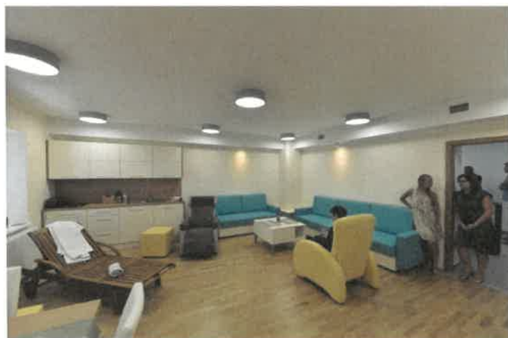
Sliki 8 in 9: Zunanost in notranji prostori prenovljene stavbe na Vodnikovi ulici 5, ki je v uporabi Centra za usposabljanje, delo in varstvo Dolfke Boštjančič, Draga