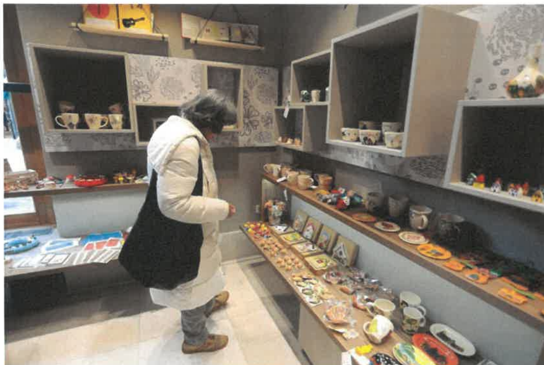
Slika 2: Skrbovin'ca, kjer so na prodaj izdelki oseb s posebnimi potrebami, ima prostore v Informacijski točki MOL za starejše 65+ in za osebe z oviranostmi (foto: arhiv MOL).

Ljubljana (Dnevni centri aktivnosti za starejše Ljubljana), Združenje gluhoslepih Slovenije Dlan, Društvo paraplegikov ljubljanske pokrajine, Društvo Projekt Človek, Društvo SOS telefon za ženske in otroke – žrtve nasilja, Društvo invalidov Ljubljana – Center, Društvo Altra – Odbor za novosti v duševnem zdravju, Društvo distrofikov Slovenije, slikarska skupina upokoencev Union 04 in Center Iris – Center za izobraževanje, rehabilitacijo, inkluzijo in svetovanje za slepe in slabovidne. Redno tedensko so bile zainteresiranim na voljo brezplačne preventivne meritve krvnega tlaka, srčnega utripa, glukoze, trigliceridov in holesterola (izvajalec Društvo za zdravje srca in ožilja).