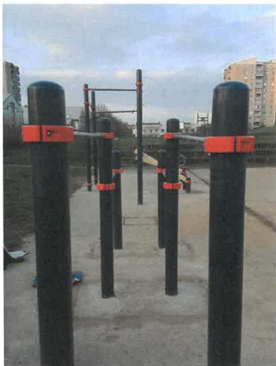
Slika 14: Naprave za ulično vadbo

V skladu z Odlokom o posebni rabi javnih površin v lasti Mestne občine Ljubljana (Ur. l. RS, št. 105/15) ter skladno s pooblastili iz naslova Zakona o cestah (Uradni list RS, št. 109/10, 48/12, 36/14 – odl. US, 46/15 in 10/18) je Inšpektorat MU MOL zagotavljal redni in izredni nadzor nad neovirano in varno uporabo javnih površin (predvsem nadzor nad postavljanjem gostinskih vrtov, »A« panojev in drugih predmetov na javno površino brez dovoljenja oziroma v nasprotju z izdanim dovoljenjem ter nadzor nad postavljanjem ovir na cesti in odrejanje ukrepov za odpravo nepravilnosti skladno z zakonom ter v okviru pooblastil s tega področja). V 2017 in 2018 je Inšpektorat MU MOL uvedel skupno 788 prekrškovnih postopkov in 1058 upravnih inšpekcijskih postopkov iz naslova predmetnega zakona in odloka.