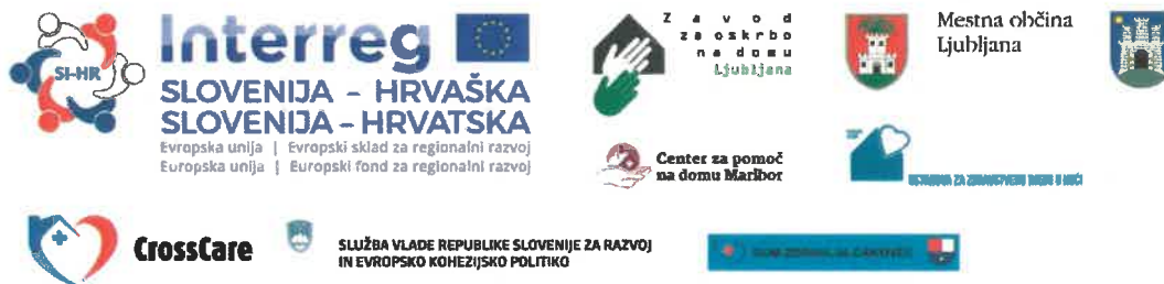
Slika 30: Logotip projekta CrossCare in partnerji v projektu

Kot rezultat sodelovanja ZOD s projektnimi partnerji je bil v okviru projekta CrossCare pripravljen obsežen pisni dokument Integriran pristop oskrbe starejših ljudi na domu/ Integriran pristop skrbi za starije osebe u kući , ki določa način in postopke izvajanja storitev za starejše na domu. Program integriranega pristopa oskrbe na domu združuje socialne in zdravstvene storitve v zaključeno celoto. Je pripomoček za konkretno izvajanje storitev delovne terapije, fizioterapije, zdravstvene nege in dietetike na terenu, in hkrati strokovna podlaga, priročnik za sistemsko ureditev področja, saj določa tudi način in postopke povezovanja storitev socialnega in zdravstvenega varstva.