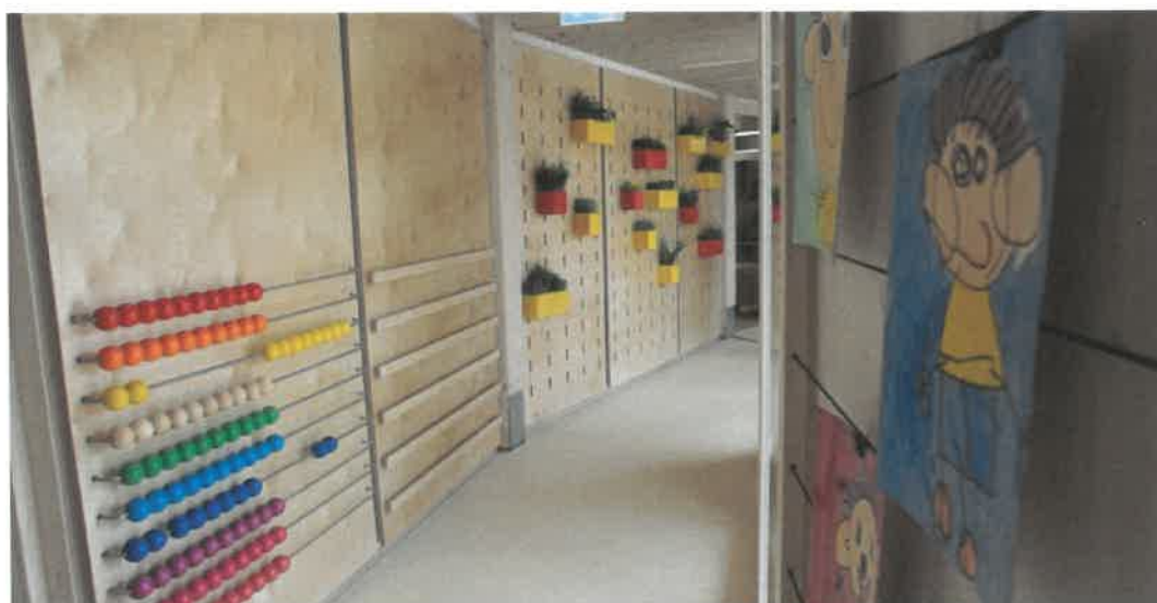
Slika 25: Inovativno zasnovane prostore novozgrajene enote vrtca Pedenjped, Pedenjcarstvo, je Zbornica za arhitekturo in prostor Slovenije nagradila z zlatim svinčnikom za odlično izvedbo.

V 2018 je bila na naslovu Kašeljška cesta 125 odprta novozgrajena enota vrtca Pedenjped, Pedenjcarstvo, kjer se poleg rednega programa izvaja tudi specializiran program za predšolske otroke z motnjami avtističnega spektra. V ta oddelek so usmerjeni otroci z odločbo o usmeritvi Zavoda RS za šolstvo, na podlagi strokovnega mnenja komisij, katerih člani so tudi strokovni delavci Ambulante za avtizem, ki deluje v Pediatrični kliniki Univerzitetnega kliničnega centra Ljubljana. V oddelek je vključenih do 6 otrok z diagnosticirano motnjo avtizma, ki imajo temeljno znižane prilagoditvene sposobnosti, a obenem tipične do lažje znižane kognitivne sposobnosti. V strokovnem timu oddelka so specialna in rehabilitacijska pedagoginja (vodja), vzgojitelj za izvajanje dodatne strokovne pomoči in pomočnik vzgojitelja. MOL je prva občina v Sloveniji, ki je v javni mreži vrtcev ponudila specializirani program za otroke z avtizmom, katerega sestavni del je program prehajanja v redne oddelke in s tem pripomogla k strokovnemu razvoju specializiranih vzgojno-izobraževalnih pristopov znotraj nacionalnega kurikulumu za vrtce ter k promociji pozitivnega odnosa in zagotavljanja ustreznih pogojev ranljivim skupinam otrok.