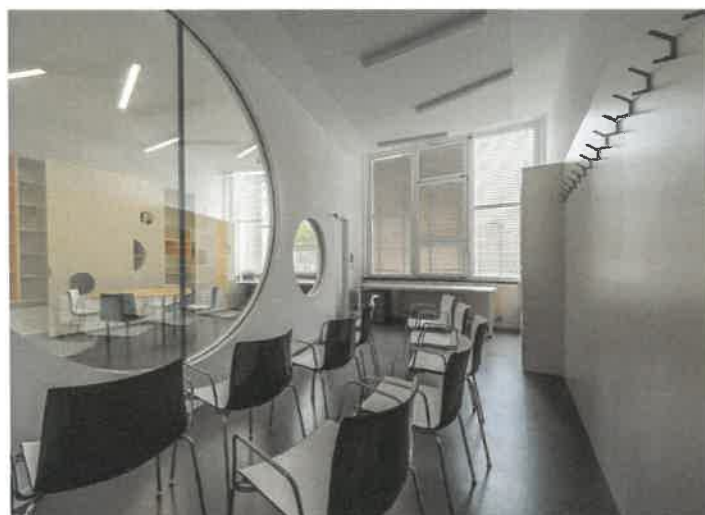
Sliki 26 in 27: Sodobno opremljeni prostori Izobraževalnega centra Pika, na naslovu Zemljemerska ulica 7 (foto: Blaž Zupančič, vir: http://curkarhitektura.si )