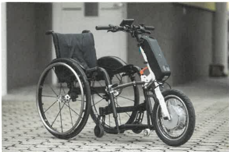
Slika 11: Električni priklop za invalidske vozičke, ki ga za izposajo zagotavlja JZ Turizem Ljubljana.

Za lažje premagovanje daljših poti po mestu JZ Turizem Ljubljana zagotavlja možnost brezplačne izposoje električnega priklopa za invalidske vozičke. V Slovenskem turistično informacijskem centru, Krekov trg 10, sta na voljo dva priklopa, za dan izposoje je potrebno predložiti kopijo osebne izkaznice ali potnega lista ter vplačati kavcijo v višini 300 eurov, ki se ob vračilu nepoškodovanega priklopa v celoti vrne. Gre za inovativen produkt, razvit v Sloveniji, ki presega kakovost in enostavnost vseh podobnih izdelkov v Evropi in svetu. Priklop se enostavno pripne na voziček, ki ga oseba sicer uporablja in je primeren za vožnjo tudi do 40 km z enim polnjenjem baterije.