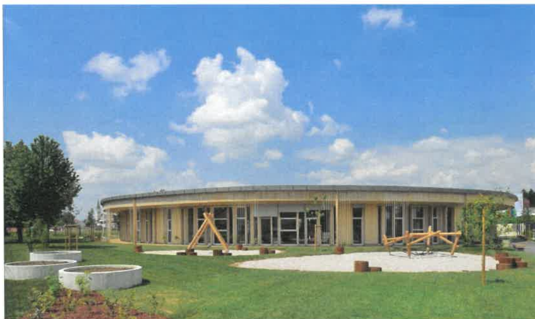
Slika 5: Novozgrajena enota vrtca Pedenjped v Kašlju

Dostopnost predšolskega in osnovnošolskega izobraževanja v MOL je bila v obdobju, na katerega se nanaša poročilo, dodatno obogatena z izvedbo vgradnje dvigala v Osnovni šoli Dragomelj ter z zaključkom izgradnje in začetkom delovanja Pedenjcarstva, nove enote vrtca Pedenjped, na naslovu Kašeljaska cesta 125, kjer se poleg rednega programa izvaja tudi specializiran program za predšolske otroke z motnjami avtističnega spektra.