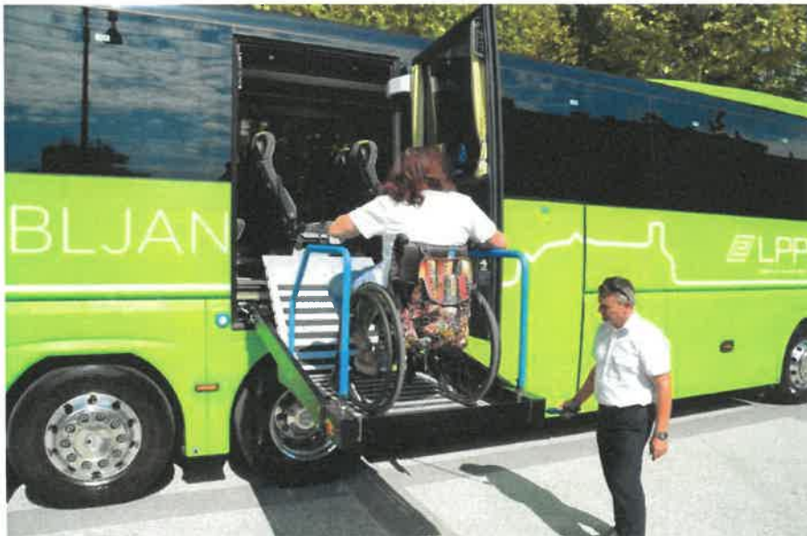
Slika 19: Nov turistični avtobus LPP d.o.o. z dvigalom, ki zagotavlja udoben vstop na invalidskem vozičku.

Po več letih prizadevanj je LPP d.o.o. v 2017 izvedel nakup dveh turističnih avtobusov za občasne prevoze. Avtobusa podjetja MAN se ponašata s prostornostjo in udobjem in sta prva tovrstna v Sloveniji s posebnim dvigalom, ki zagotavlja udoben vstop na avtobus potniku na invalidskem vozičku. Na enem avtobusu lahko hkrati potujeta dve osebi na invalidskih vozičkih.