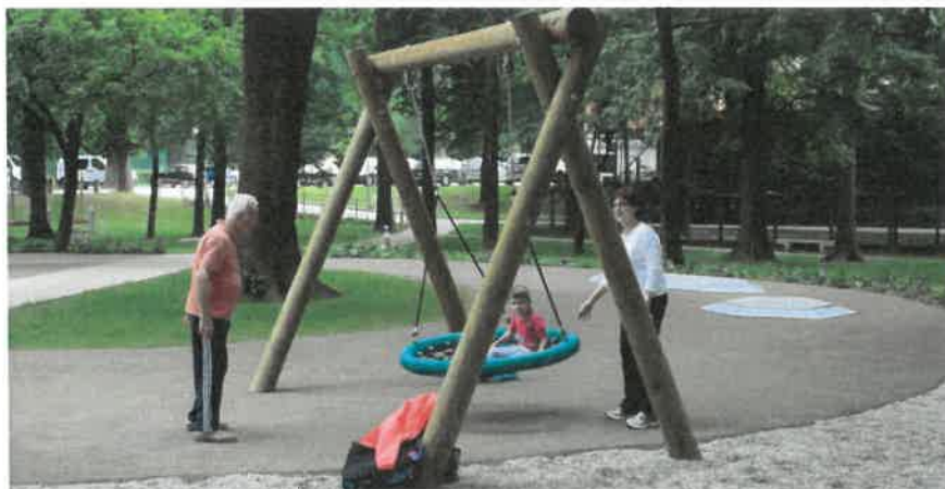
Slika 12: V Parku Kodeljevo je od maja 2018 prenovljeno otroško igrišče s kakovostnimi igrali, dostopnimi tudi otrokom z oviranostmi (foto: Nik Rovar, vir: www.ljubljana.si ).

MOL pri urejanju javnih površin in parkov zagotavlja brezplačno dostopna zunanja igrala/ naprave, ki jih lahko uporabljajo tudi otroci s posebnimi potrebami. Vsako leto je obnovljenih (okoli 15) ali na novo urejenih več javnih igrišč, za vzdrževanje katerih skrbi JP Snaga, d.o.o. Še posebej dostopna in otrokom s posebnimi potrebami prijazna so otroška igrišča v Severnem mestnem parku, v Šmartinskem parku, v parku Tivoli ter v dveh novo urejenih, v Parku Kodeljevo in v Družinskem parku Muste.