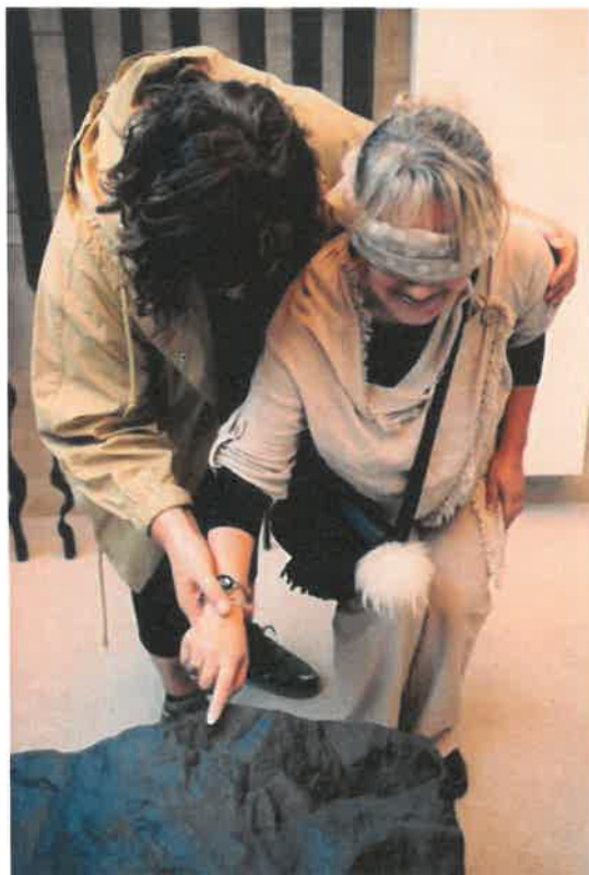
Slika 21: Utrinek iz delavnice MGLC