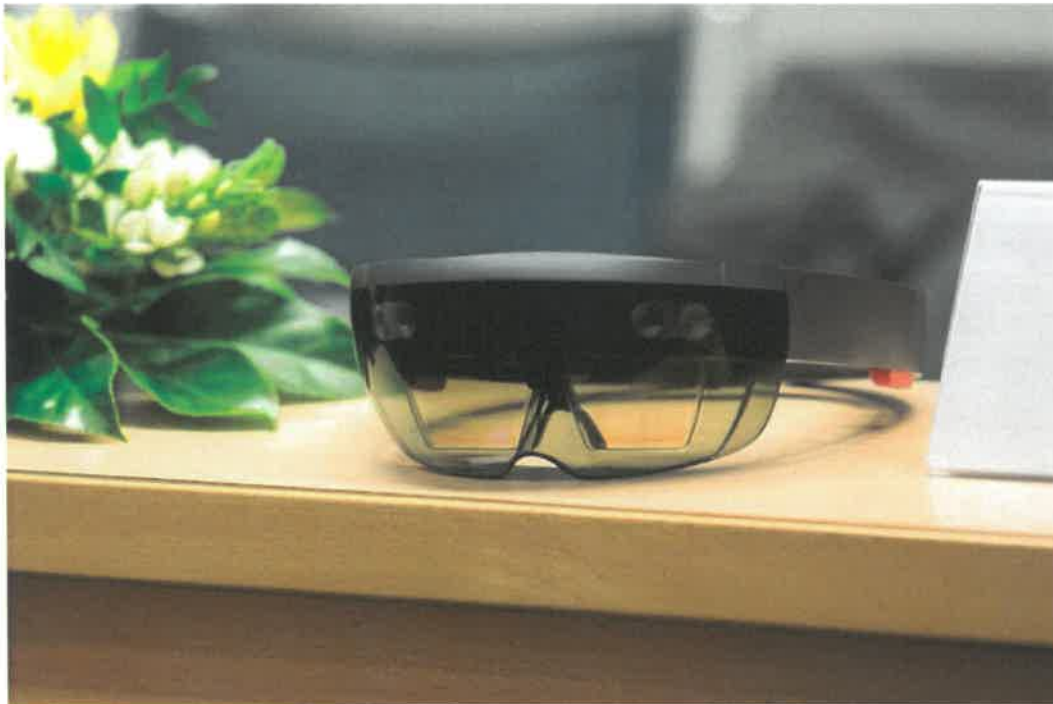
Slika 31: Očala za prikazovanje obogatene resničnosti – nova pridobitev Simulacijskega centra JZ Zdravstveni dom Ljubljana

pomočjo očal lahko izkusimo, kako se nujna stanja izražajo, kako jih prepoznamo in kako je potrebno ravnati, saj očala omogočajo scenarije, ki jih učeči sicer v vsakdanjem okolju morda nikoli ne bi videli ali prepoznali. Posameznik tako s svojim znanjem, ki ga je pridobil skozi simulacijo s pomočjo tovrstnih očal, lahko reši življenja. (iz Sporočila za javnost z novinarske konference 13. marca 2019, na kateri je JZ Zdravstveni dom Ljubljana skupaj s partnerji predstavil nadgradnjo učenja s simulacijami s pomočjo očal za prikazovanje obogatene resničnosti).