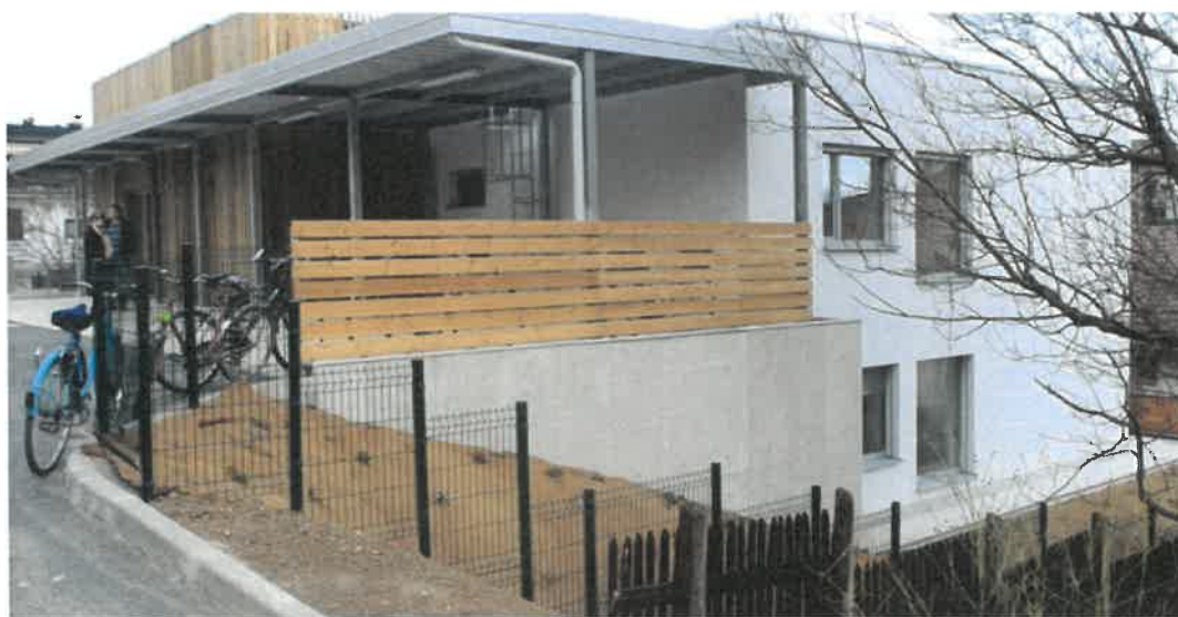
Slika 7: Hiša Sonček

V okviru redne naloge oddajanja neprofitnih najemnih stanovanj v najem različnim neprofitnim organizacijam za izvajanje podpornih oblik bivanja so bile v uporabo dodeljene 4 stanovanjske enote oziroma stavbe. YHD – Društvu za teorijo in kulturo hendikepa je bilo dodeljeno stanovanje, prilagojeno uporabnikom invalidskih vozičkov, ustrezno prilagojeno večsobno stanovanje je bilo dodeljeno Zavodu za gluhe in naglušne Ljubljana. Sredi leta 2017 je bila dokončana izgradnja Hiše Sonček in bila oddana Sončku – Zvezi društev za cerebralno paralizo Slovenije, so.p. (v njej prebiva 12 uporabnikov). Prenova stavbe na naslovu Vodnikova 5, v kateri biva 12 varovancev Centra za usposabljanje, delo in varstvo Dolfke Boštjančič, Draga je bila zaključena in predana v uporabo avgusta 2018. V času priprave tega poročila ima 8 invalidskih organizacij v najemu skupno 25 stanovanjskih enot, od tega 3 hiše, v katerih bivajo njihove članice in člani.