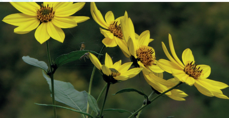
Topinambur ( Helianthus tuberosus )

Danes v Sloveniji odstranjene invazivne tujerodne rastline kompostiramo ali sežigamo. S pilotnim projektom predelave v papir v letu 2016 pa smo v Ljubljani že dokazali, da jih je mogoče uporabiti tudi v druge, koristne namene. S projektom APPLAUSE nadgrajujemo dosedanje aktivnosti, saj želimo delovati po načelu nič odpadkov in krožnega gospodarstva, z aktivnim vključevanjem meščank in meščanov.