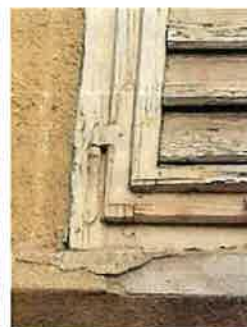
Fotografija 3: Detajl ustreznega nasadila.