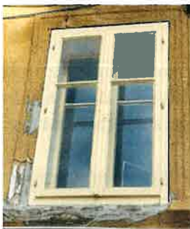
Fotografiji 1 in 2: Primera oblikovno ustreznega zunanjega okna