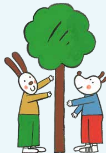
Ilustracija Silvan Omerzu

Med pravnimi odgovori, ki bodo na spletni naslov ljubljanske.glavce@gmail.com prispeli do 30. septembra , bomo izžrebali dobitnika štirih brezplačnih vstopnic za ogled ene od predstav v Lutkovnem gledališču Ljubljana.