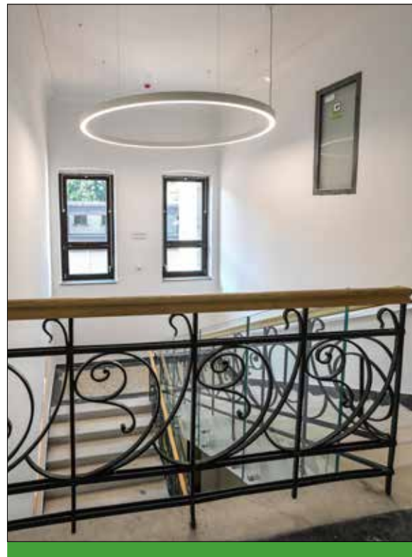
OŠ Franca Rozmana Staneta

OŠ Zadobrova je z novim prizidkom pridobila prepotrebne dodatne prostore.