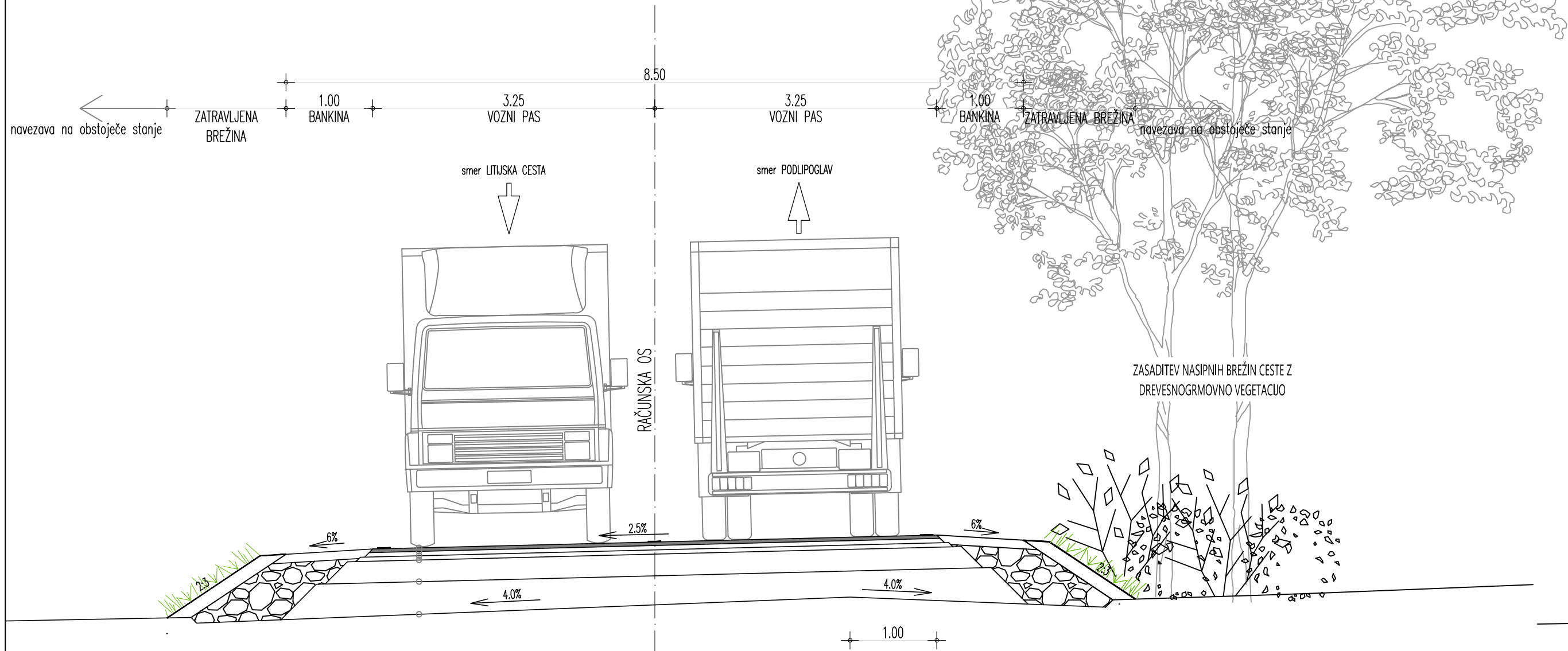
KPP 1 OBVOZNA CESTA glavni odsek (od navezave na Cesto II. grupe odredov do navezave na cesto Podlipoglav)