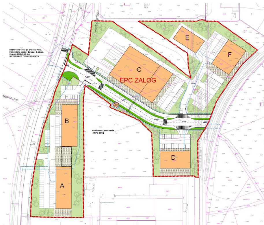
Tabela 2: Načrtovane stavbe (v tabeli so določene maksimalne dimenzije stavbe)